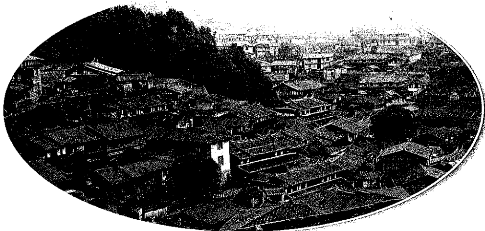
中国历史文化名村——桂峰村