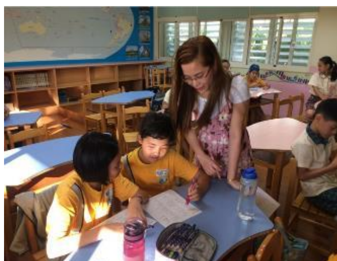
邀請越南新住民指導越南語