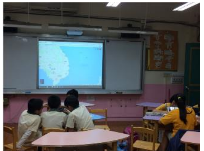
越南中部小旅行計畫書

Souvenir (伴手禮) 1. 越南咖啡 2. 芒果乾 3. 越南米糕 4. 龍眼乾