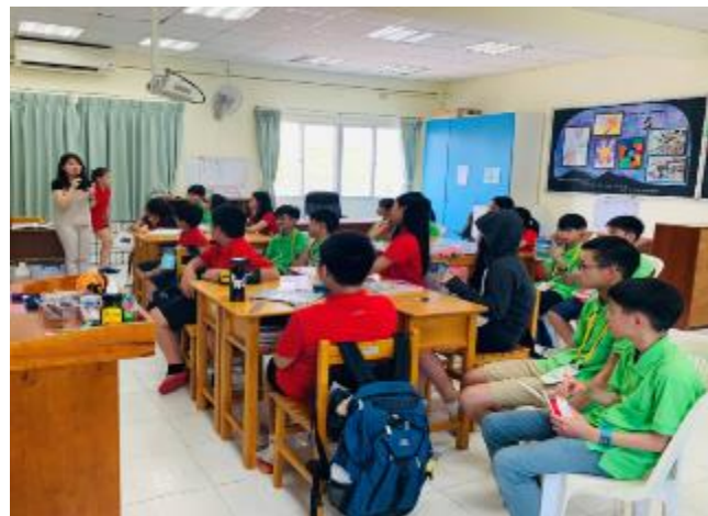
入班與當地學生一起上課