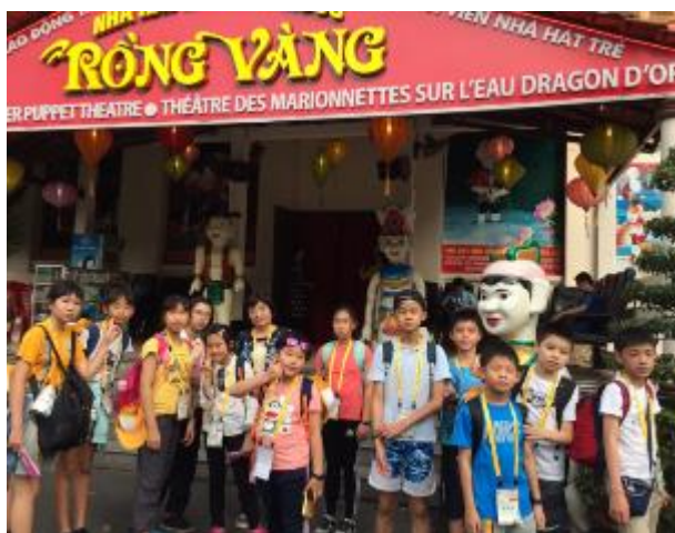
水上木偶戲院前合影

◆ 水上木偶戲：越南水上木偶戲已有千年的歷史，在國際文化交流上為越南文化表演的重要項目，透過親臨現場欣賞演出，認識各國藝術文化的多元性。