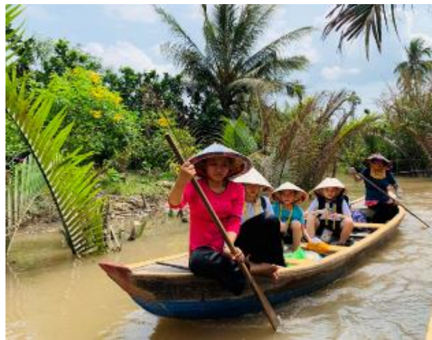
湄公河的水上觀光

◆ 阮惠街行人徒步區：走在胡志明市中心最繁華的街道，兩側星羅棋布的各式各樣的商店，街角矗立著五星飯店，遠處到處都是高樓工程，真切的感受越南這個國家正要開始起飛，奮力進步的氛圍。