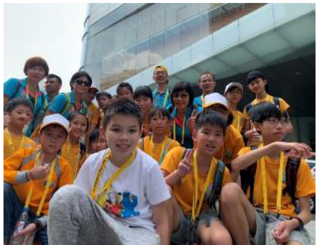
西貢金融塔前合照