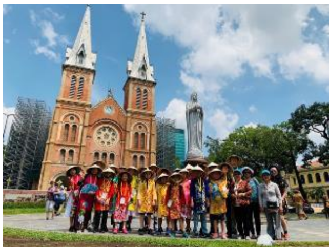
奧黛體驗市區觀光-紅教堂