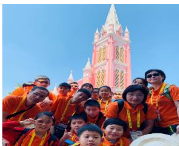
參觀粉紅教堂合影