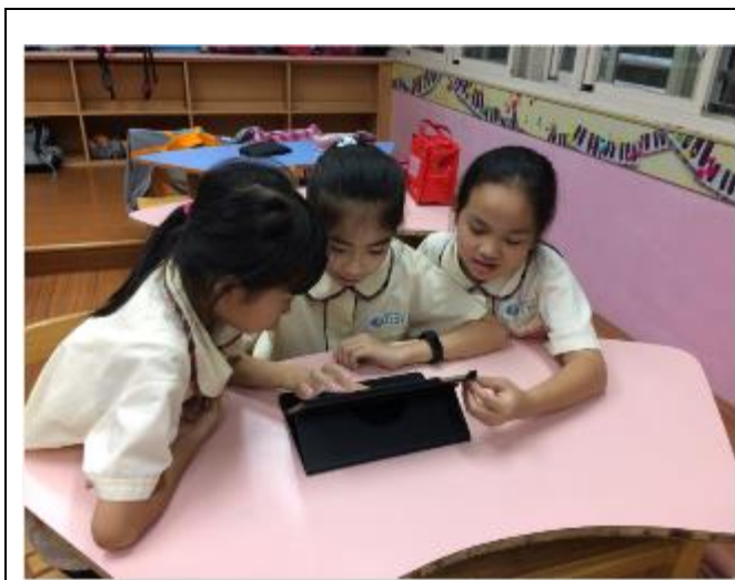
利用Ipad上網蒐集圖文資料

設計一個文化箱，裡面放著能代表臺灣的各種東西，請同學思考什麼東西是具有代表性的。