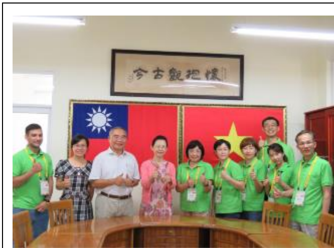
越南臺商學校教育交流參訪