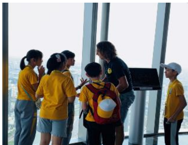
學生小組進行訪問外國觀光客