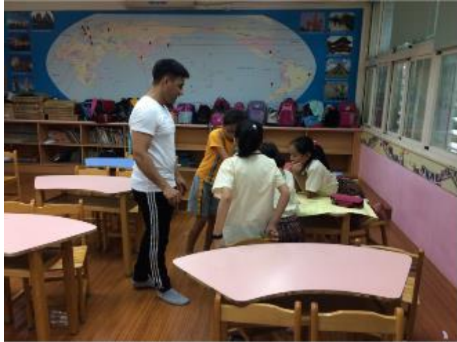
外師共同指導學生的海報製作

以給外國友人的臺北一日遊活動為主題，繪製觀光海報，選擇不同行政區為旅行的重點區域。