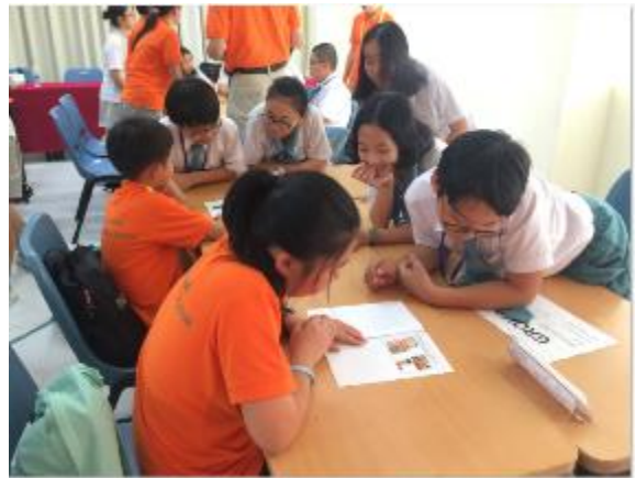
在越南丁善理國際學校向學伴介紹臺灣