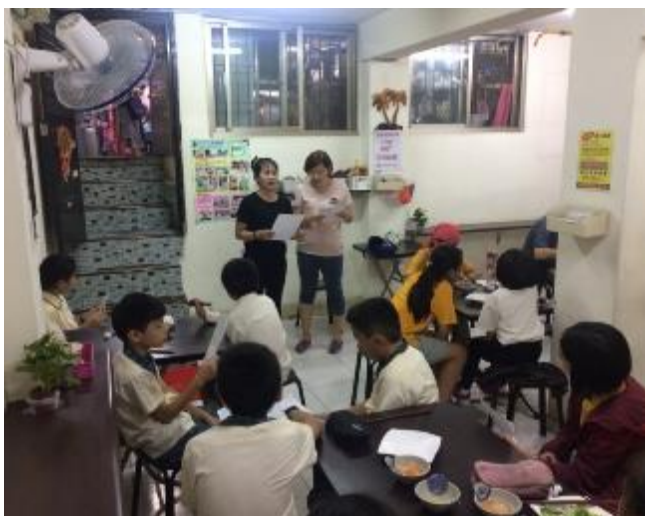
越南餐廳品嚐春捲，學越南話。