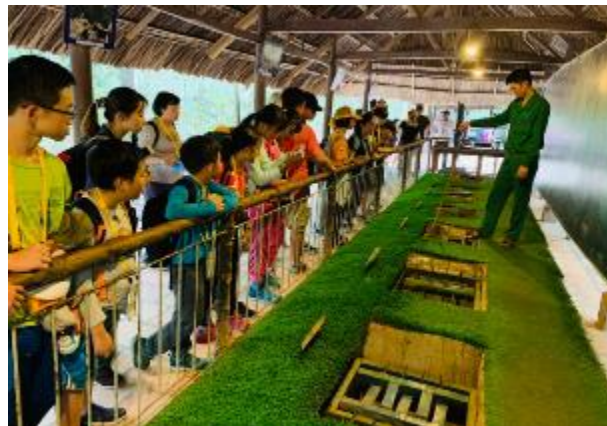
古芝地道陷阱說明