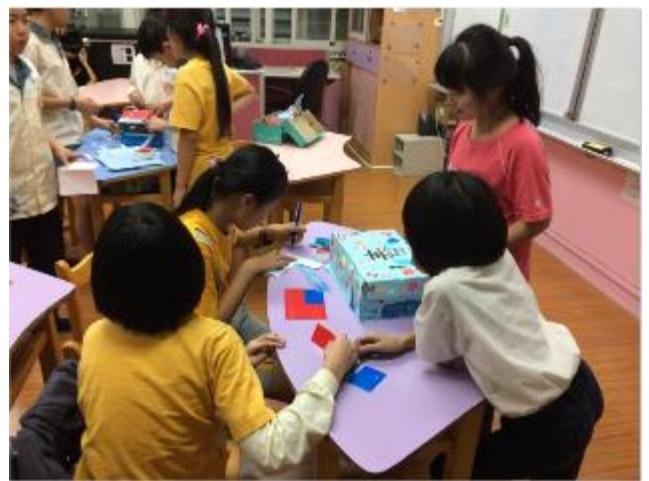
自己設計文化箱的內容與外部圖案