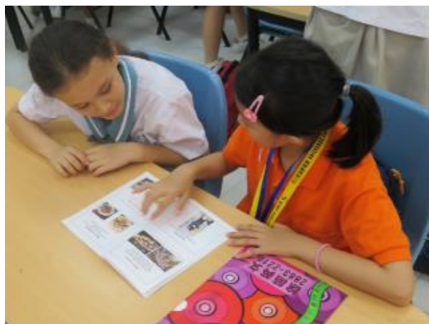
介紹臺灣給越南夥伴