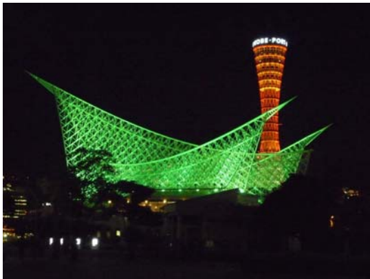
神戶海洋博物館夜景

1995 年神戶經歷了一場毀滅性的大地震，此公園將受到大地震災害的美利堅碼頭一部分按原樣保存而修建的紀念公園，在這裏以影像、照片展板的形式展示著神戶港受災的情況以及修復的過程等，可 24 小時開放供民眾參觀，在夜間淡綠的燈光下訪視感覺有些許的淒涼與哀慟，讓人見識到地震的無情及大自然可怕的力量。