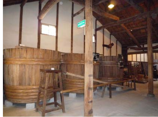
醬油展示館內部展示空間