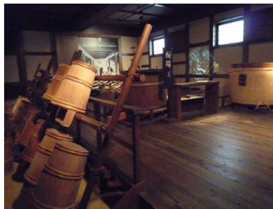
菊正宗酒造紀念館內部展示空間