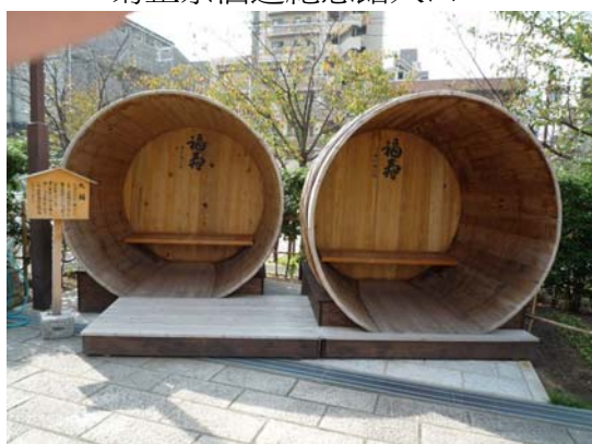
神戸酒心館外部展示空間