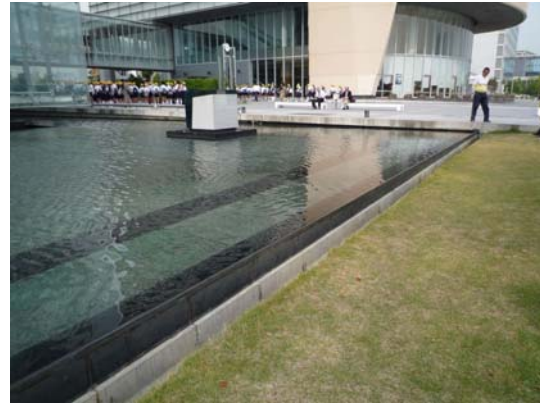
神戶地震紀念館前水景