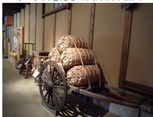
澤之鶴資料館內部展示空間