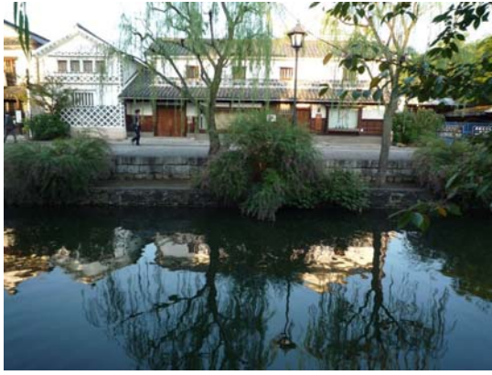
倉敷美觀地區街景