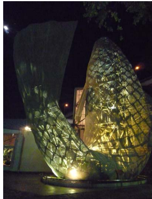
神戶一角之公共藝術