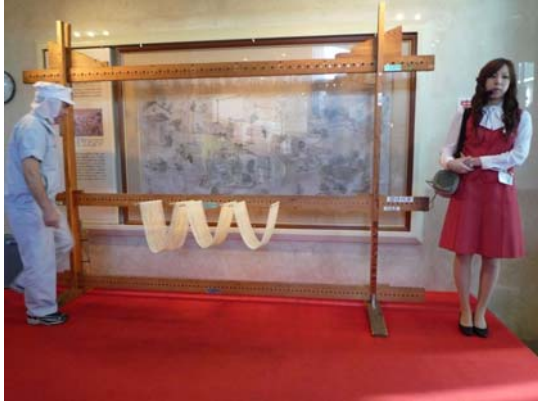
揖保乃糸資料館—細麵製作示範

保川的河水仍然是少不了的關鍵。此區特別設有龍野醬油資料館，介紹龍野醬油的歷史資料，並有製作過程的完整介紹，館內留有早期手工時代醬油製作的重要器具，兵庫縣已指定為有形民俗文化財。