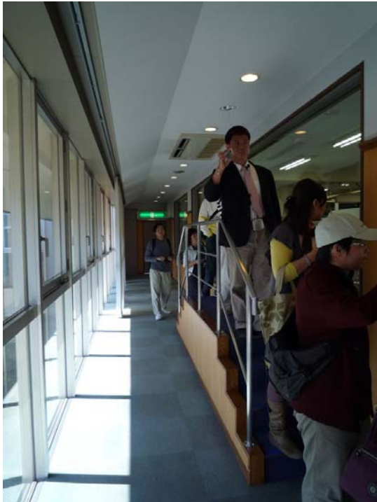
揖保乃糸資料館—生產線參觀