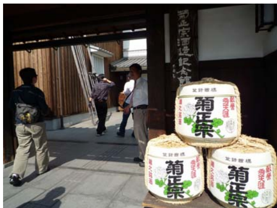
菊正宗酒造紀念館入口

澤之鶴資料館是經兵庫縣指定的「重點有形民俗文化遺產」，展示過去各種釀酒工藝，同時還設有「澤之鶴博物館商場」。