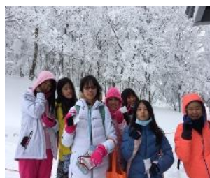
體驗日本自然景觀