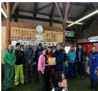
感謝教練指導師生滑雪