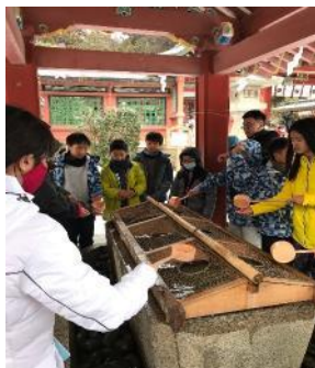
塩釜神社文化體驗