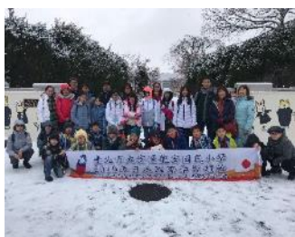
山形大學附屬小學交流