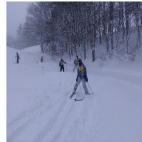
依序進行滑雪課程體驗