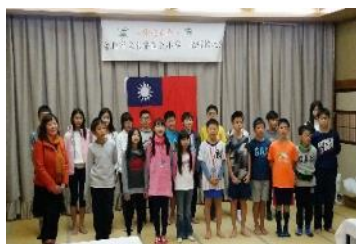
西川町歡迎會表演