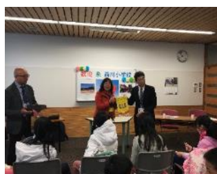
西川小學-校長致贈感謝狀