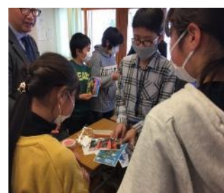
入班學習－認識新朋友