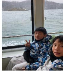
松島自然景觀踏查