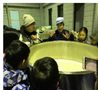
說明米釀酒的發酵過程