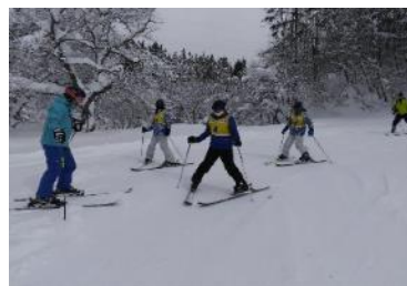
滑雪基本動作指導