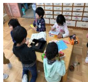
幼兒園學習區活動