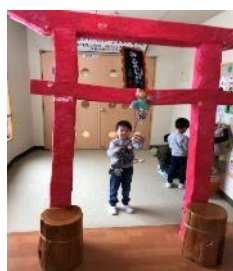
參觀幼兒園學習活動