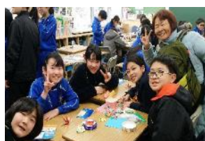
學生入班學習完成摺紙