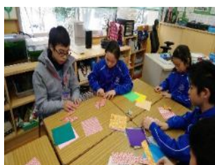
學生入班學習，摺紙活動