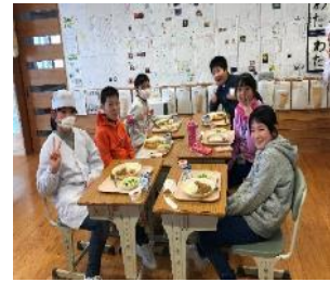
西川小學營養午餐