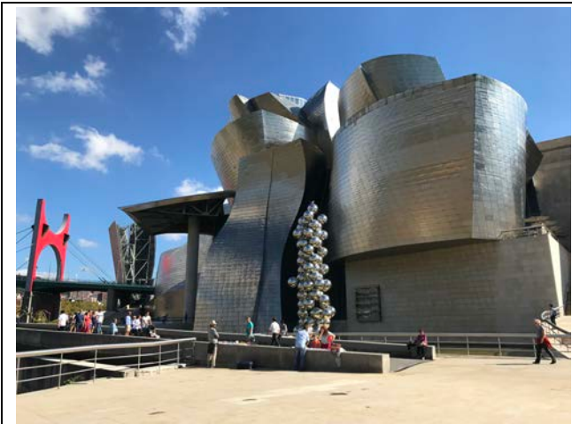
9月30日參訪古根漢美術館