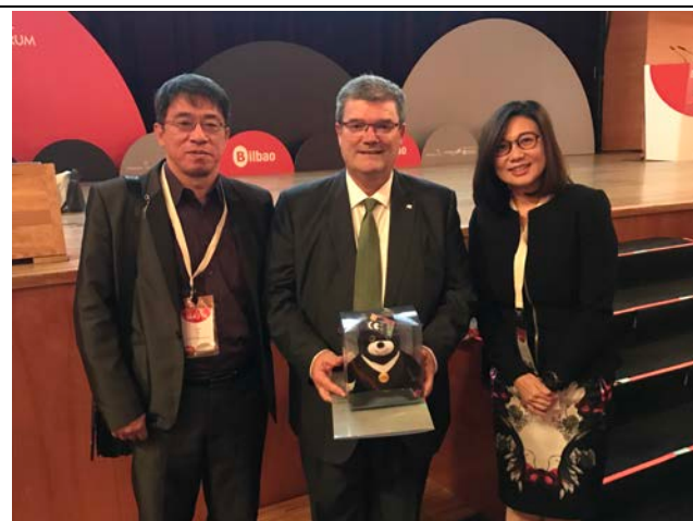
10月3日本府代表致贈畢爾包市長 Juan María Aburto 禮品並遞交本市智慧城市展邀請函