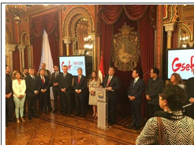
10月1日畢爾包市長歡迎式