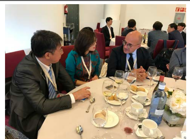
10月1日本府代表於午宴與其他與會代表交流