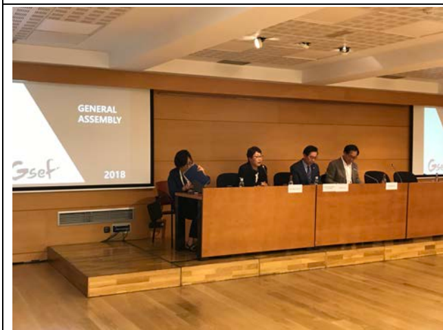
10月2日大會 (General Assembly)