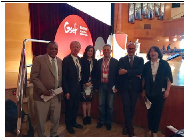
10月3日饒參事與主題座談4與談人合影