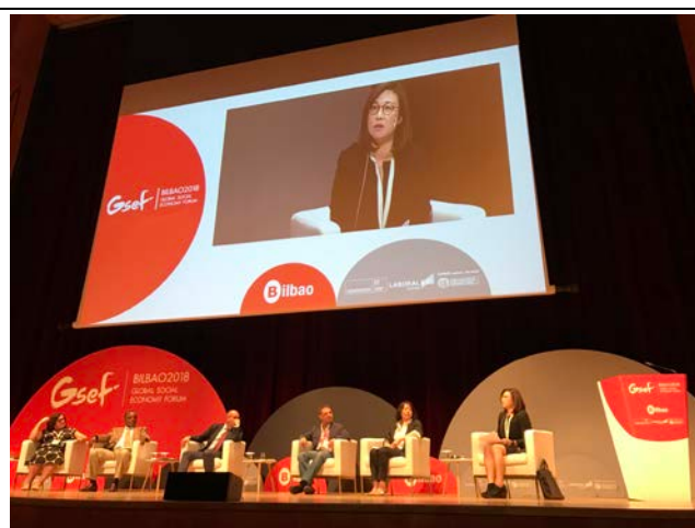
10月3日饒參事於主題座談4 擔任與談人