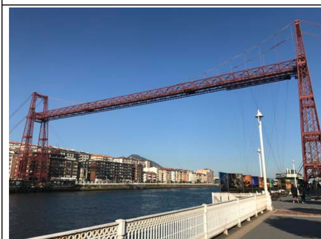
10月4日參訪比斯開橋(Puente de Vizcaya)