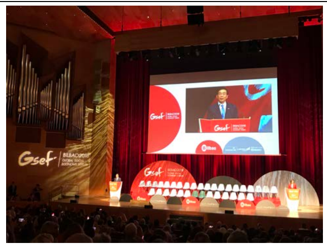
10月1日大會主席首爾市長朴元淳於大會開幕式致詞