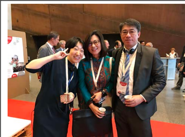
10月1日本府代表與 CityNet 組織與會代表合影