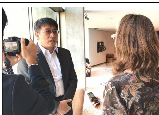
10月2日陳副秘接受聯合國社會發展研究所 (UNRISD)影片訪問