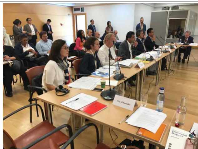
10月2日饒參事參與大會與會情形