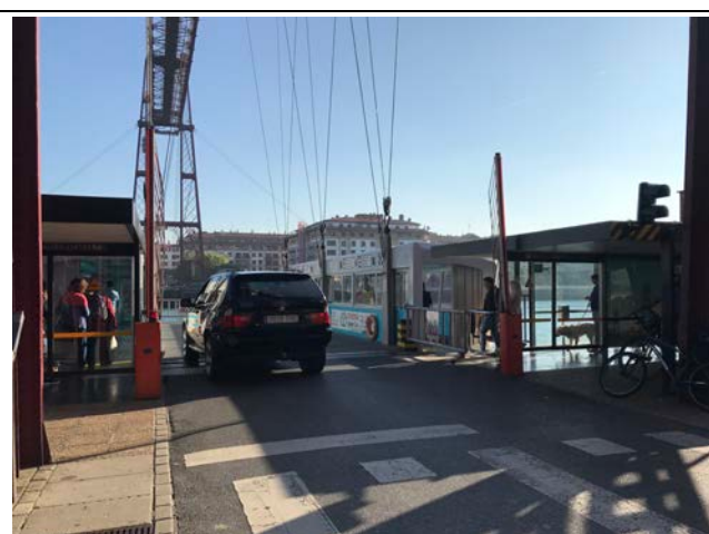
比斯開橋下方吊艙可同時運載行人及車輛