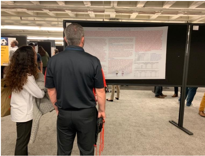
本人海報發表與演講會場