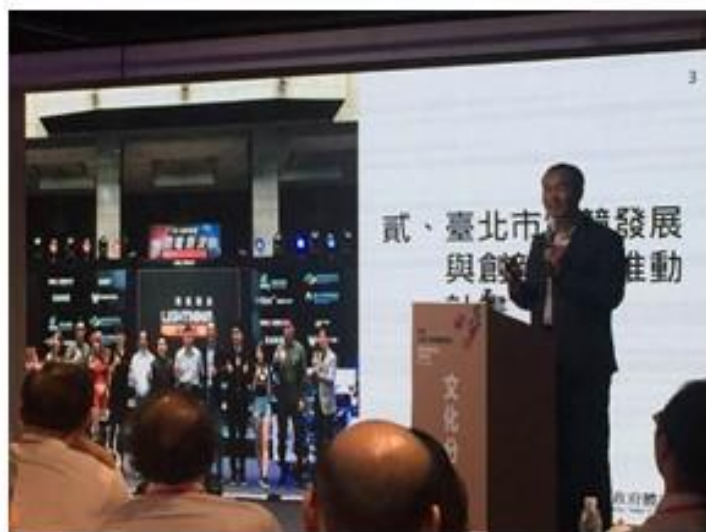
臺北市政府體育局局長李再立主題演講