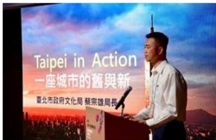
臺北市政府文化局局長蔡宗雄主題演講