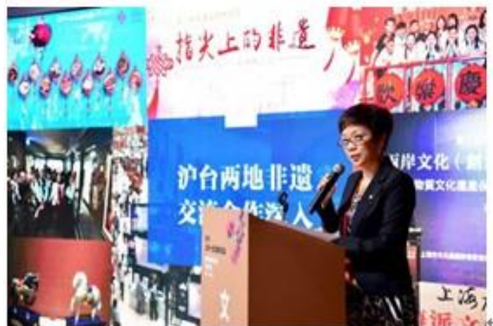
上海市文化和旅遊局局長于秀芬主題演講