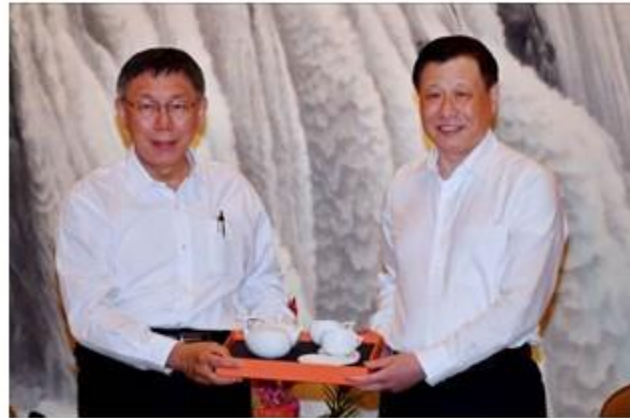
柯市長與應勇市長會面並互贈禮品