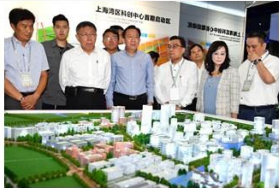
參觀上海灣區科創中心