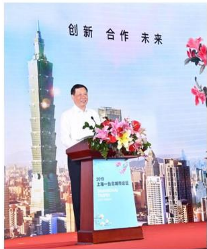
上海市長應勇致詞