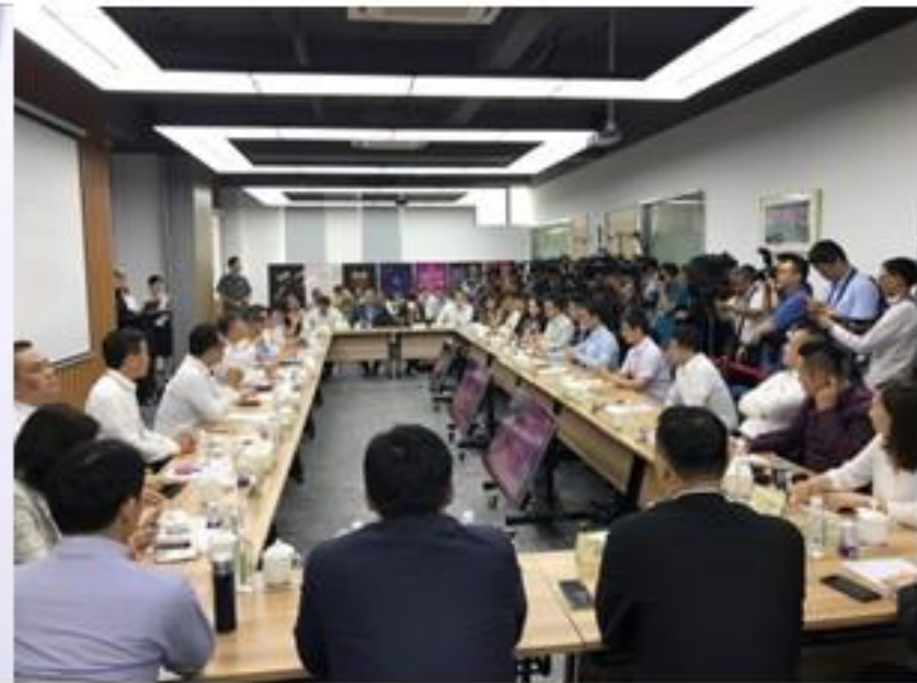
柯市長與臺商青年座談