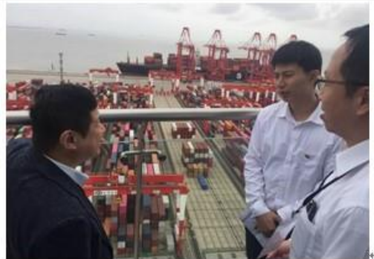
討論碼頭自動化系統