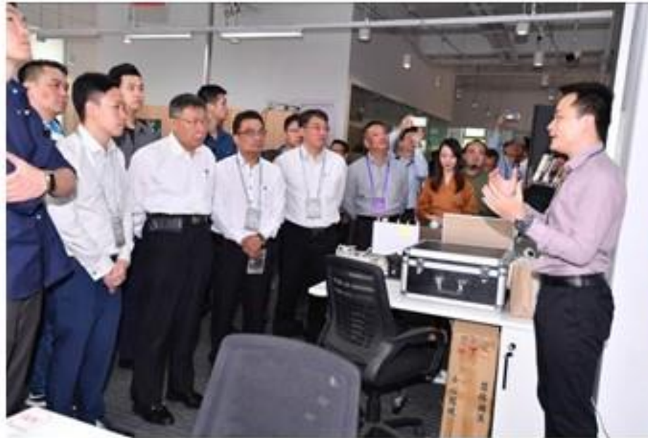
參觀青年創業基地