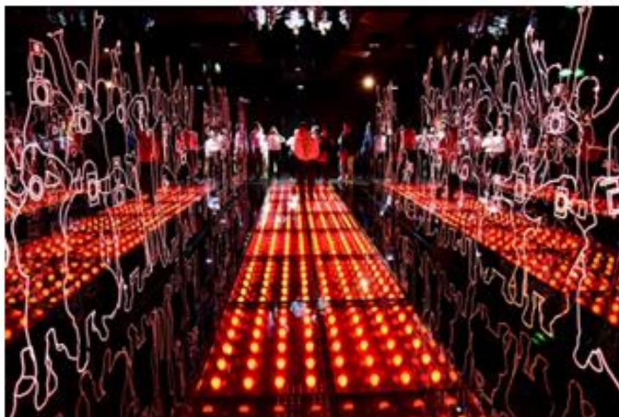
上海電影博物館 4 樓星光大道