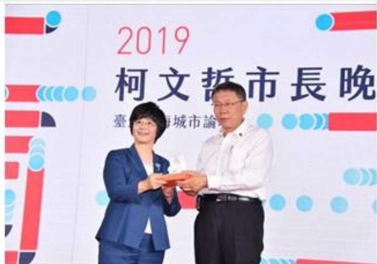
柯市長致贈知足常樂瓷器