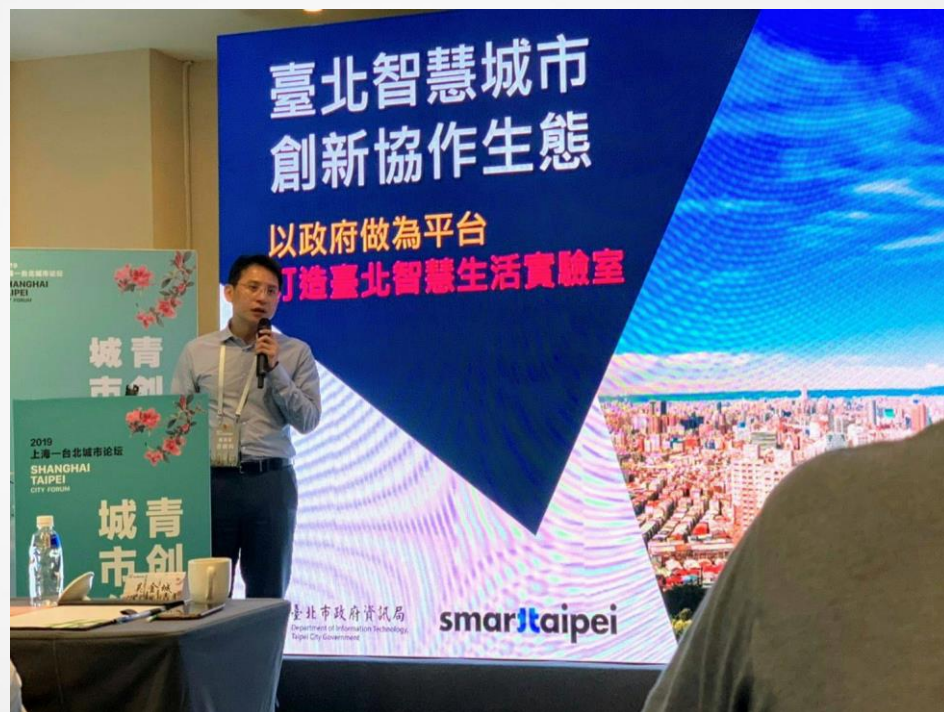
青創與智慧城市分論壇 講者演講