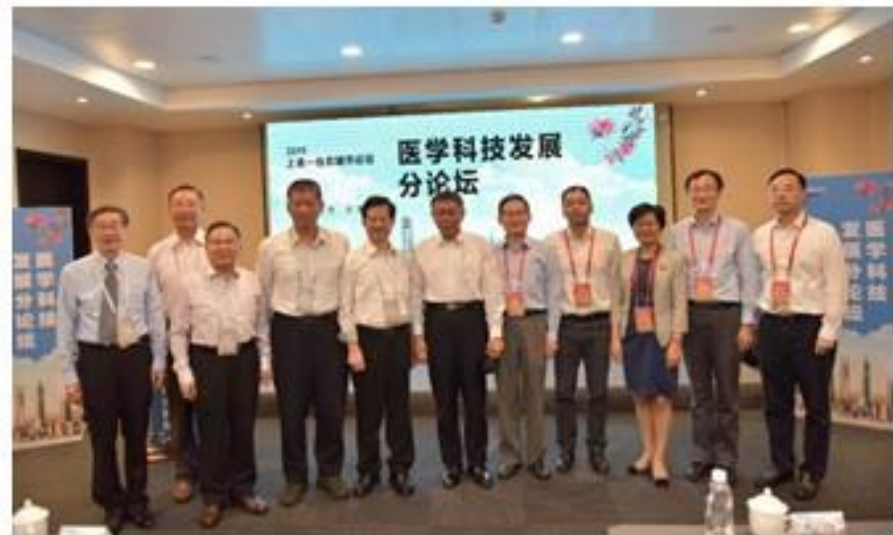
柯文哲市長至醫學分論壇致意合影