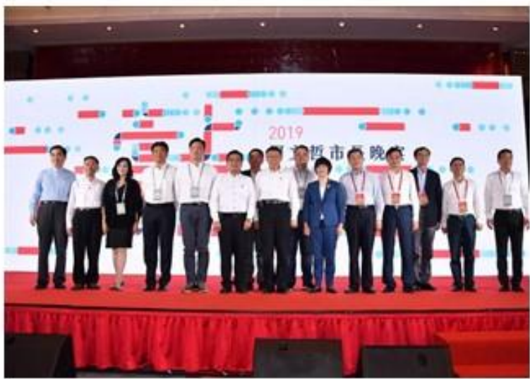
臺北市議員、柯市長及上海市宗副市長合影