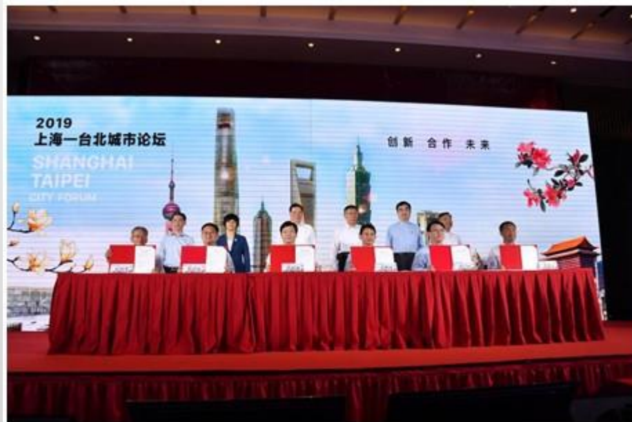
合作備忘錄簽署暨見證