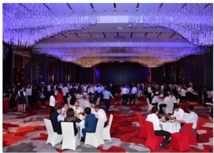
晚宴席間賓主盡歡