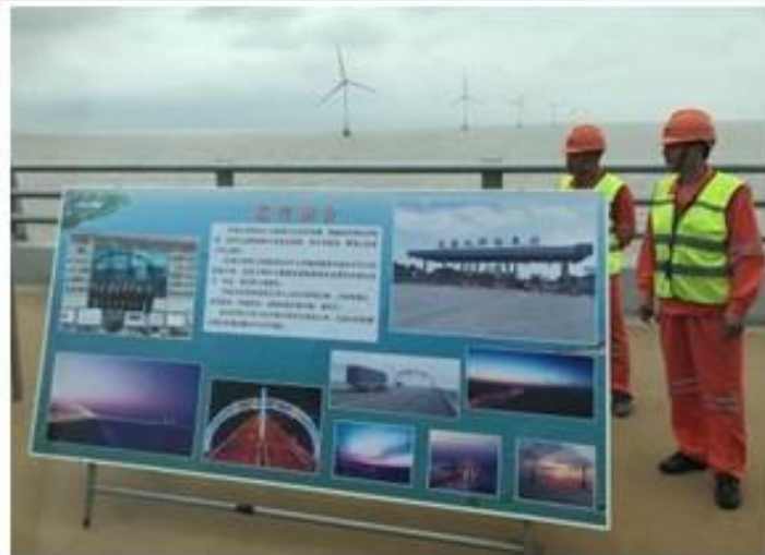
東海大橋中段(東海大橋簡介)