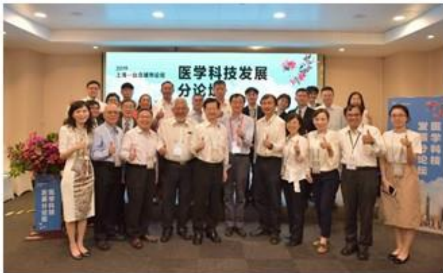
臺北方團員與上海市衛生健康委員會合影