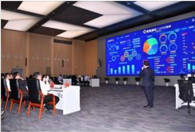
聽取簡報、相互交流