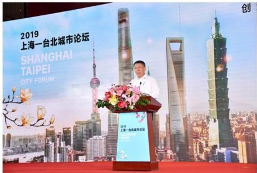
臺北市長柯文哲致詞