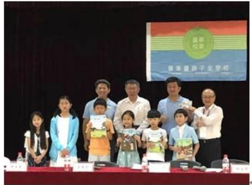
市長贈送本市教育局研編之國小一、二年級教材