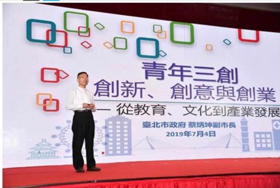
臺北市蔡炳坤副市長 主題演講