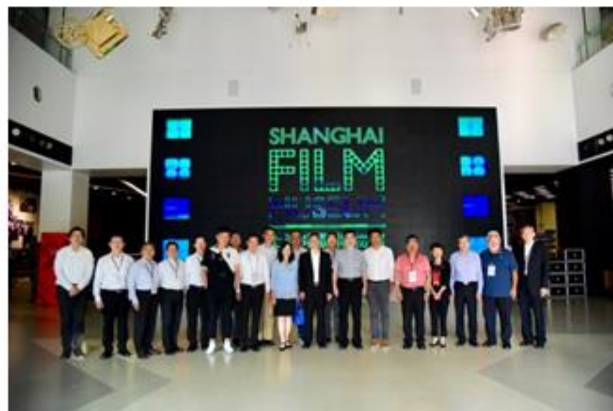
參訪團於上海電影博物館 1 樓合影