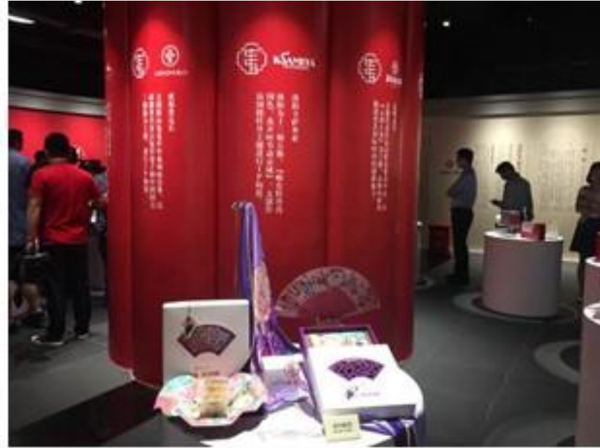
針對一市一餅的定位及全系列設計