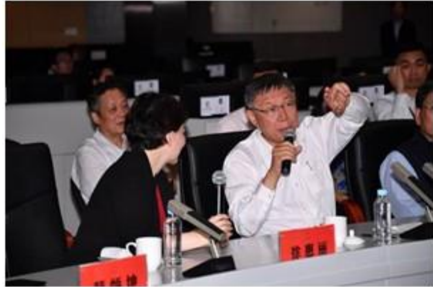
聽取簡報、相互交流