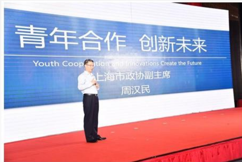
上海市政協周漢民副主席 主題演講