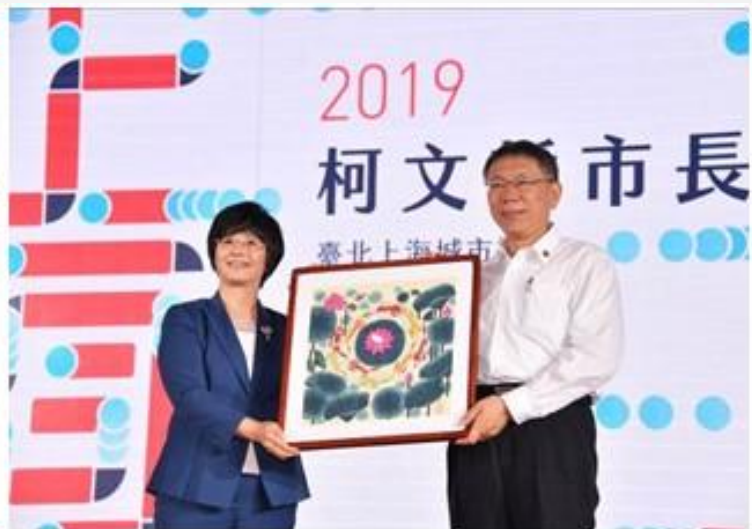
上海市政府宗副市長回贈金山農民畫