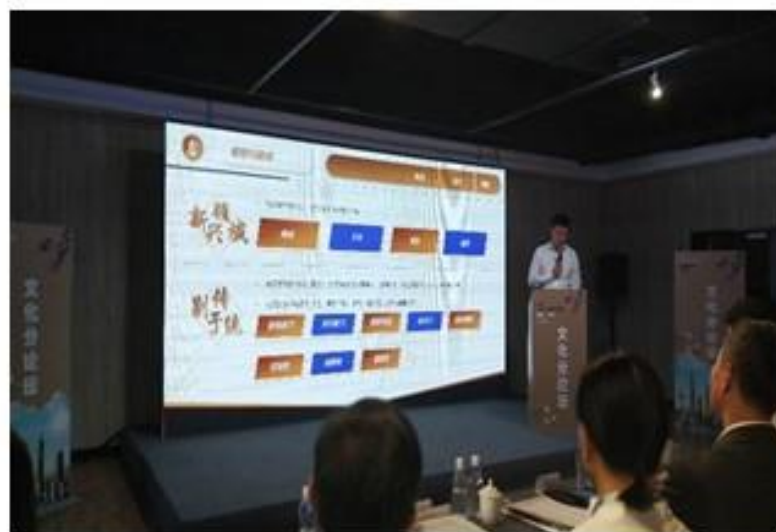
上海市體育局副局長羅文樞主題演講