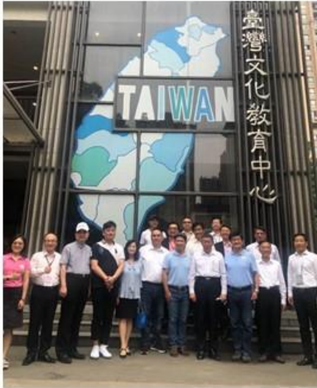
柯市長與校長、主任及臺商家長們的合照