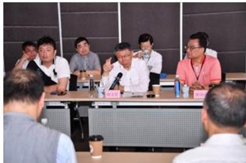
柯市長與昆山臺商協會代表座談交流