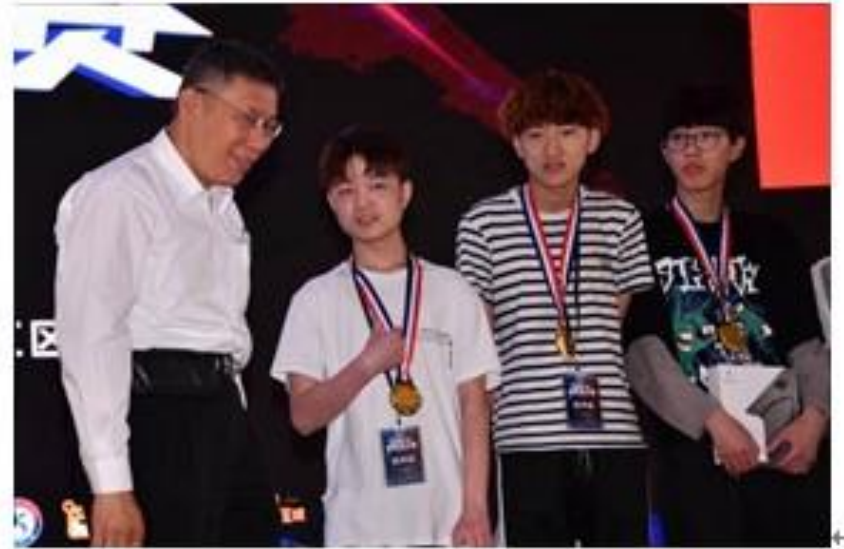
柯市長頒獎給臺北、上海優秀電競團隊