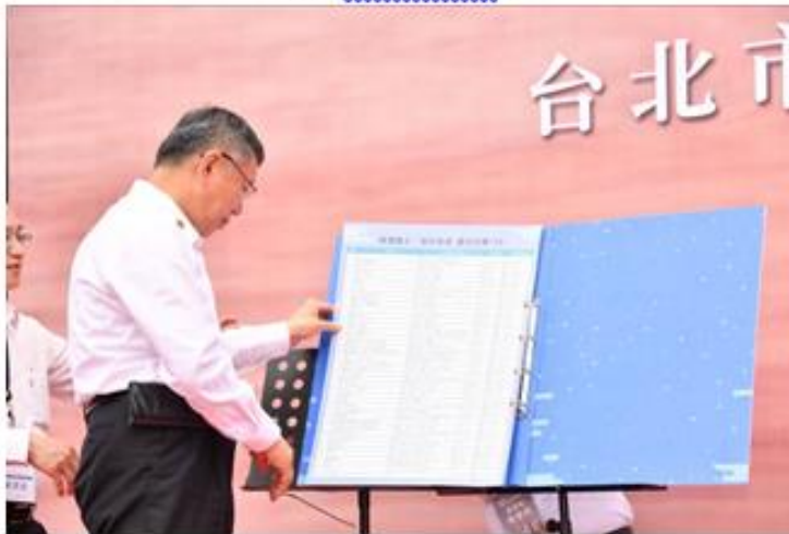
慧聚書苑贈書儀式