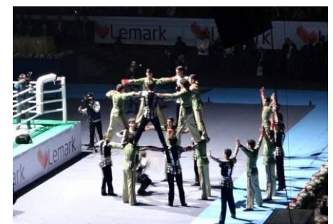
11/28 開幕典禮表演節目