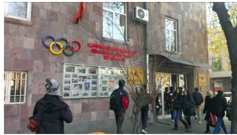
前往練習場地練習