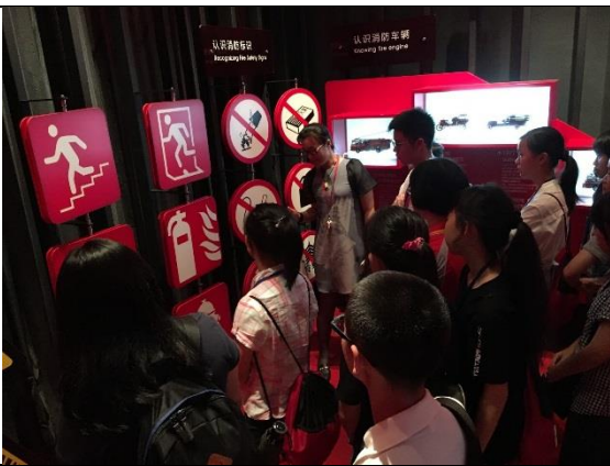
師生參觀上海閔行區紀王學校防災館