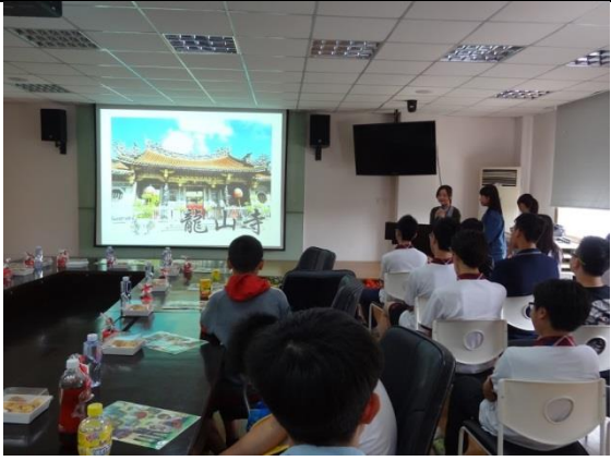
本校學生在上海台商子女學校進行萬華地方文化分享