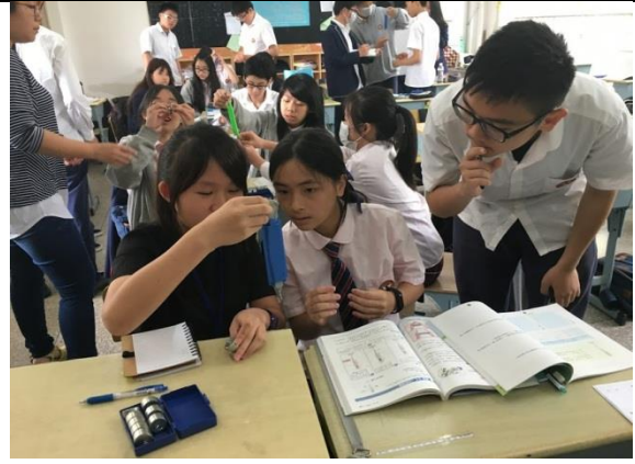
於上海台商子女學校入班上課交流