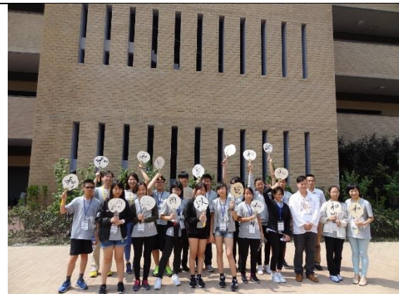
上海復旦五浦匯實驗學校書法課成果