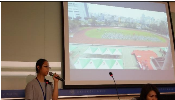
本校學生於上海復旦五浦匯實驗學校進行分享