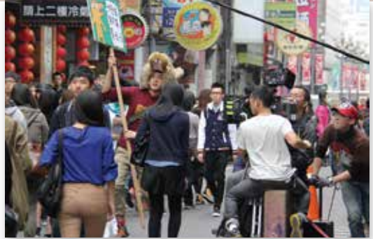
影委會協助電影《南方小羊牧場》在南陽街封街拍攝

郝龍斌市長在12月24日就職六周年記者會上，更宣布「臺北影視音產業園區」為臺北市新十大建設之一，12月27日宣布第一波選址－內湖五期重劃區基地的政策公告，邀請產業界踴躍提案。未來，內湖五期的「影視音產