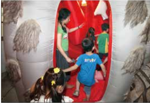
臺北兒童藝術節「兔子洞。開開門」創作裝置展覽

費社區推廣演出活動，同時辦理1檔的互動裝置藝術展覽、1檔動畫影展，以及3梯次工作坊、4場次創作對談，共有29萬6,180人次於本屆兒童藝術節，一同享受精彩豐富的藝文之旅，讓想像力飛馳。