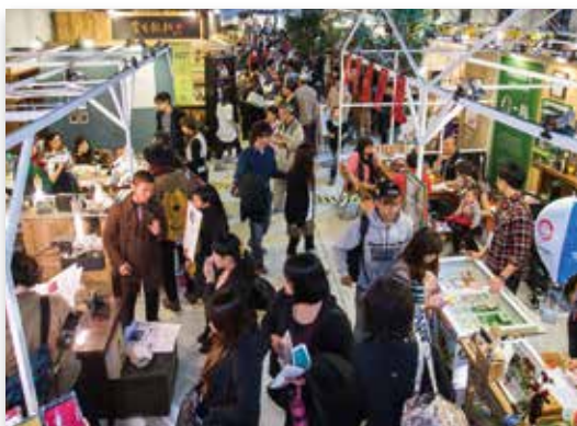
「好家在臺灣」跨越地域的隔閡，集結多家文創業者