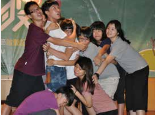
「2012北投生活藝術節」的市民劇場活動