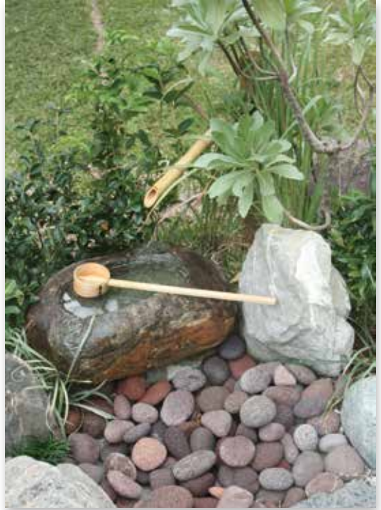
北投區林泉里辦公處認養、維護「水琴窟」作品

身分，卻承載整個城市居民的集體記憶，更是每個城市的獨特表情。臺北市政府文化局自成立以來，對文化資產的保存修復與再利用不遺餘力，「老房子文化運動」媒合機制企圖打破過去由政府編列預算修復並經營的唯一途徑，希望結合民間經營團隊的資金與創造力，整合公、私部門的資源與效率，在老房子昔時的脈絡裡尋找未來的可能性，投入老房子的搶修與再利用，提供文化創意工作者展現各種創意計畫的空間。