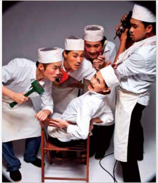
臺北藝術節由台南人劇團演出的《金龍》

臺北市政府文化局串連22個藝文館所，民國101年10月至12月推出「書院臺北—摩登六