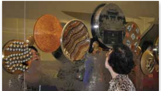
先富宮站穿堂層牆面的公共藝術作品《金屬之城（36種凝視）》

臺北市在政府與民間攜手合作下，運用獨特、深厚的文化底蘊，兼容並蓄、全面佈局，不僅營造出文創產業的優質環境，也邁向成為宜居、美好的城市。臺北已準備好躍登國際舞臺，讓世界看見城市豐富多元的創造力！