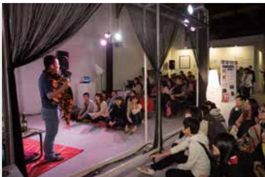
「城市就是舞台」讓民眾可近距離欣賞劇場表演