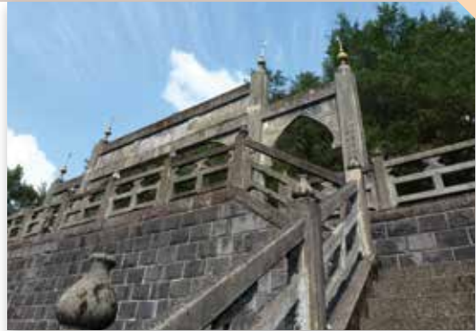
白榕蔭堂墓園(白崇禧將軍墓)成為本市第150處古蹟

保存時代意義的「林安泰古厝」；日治時期保存至今良好的公共建築日新國民小學（原日新公學校）紅樓、臺灣大學公共宿舍、臺灣省農業試驗所分所長宿舍，日治與戰後初期具特色的街屋包含迪化街一段248號、迪化街一段308號（明善堂）、南京西路255號店屋、延平北路二段45號店屋、峰圍茶莊、原辰馬商會本町店鋪、三井株式會社舊倉庫等。目前臺北市共有150處古蹟、170處歷史建築、2處聚落、1處遺址及6處文化景觀，數量冠於全國。