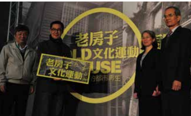
「老房子文化運動」在「一號糧倉」內舉行啟動記者會

「老房子文化運動」這項創新政策於民國101年12月3日，在老房子之一的「一號糧倉」內舉行啟動記者會，由文化局局長劉維公與國有財產局、臺灣鐵路管理局、臺灣銀行等單位的代表共同見證首度攜手合作的歷史時刻。