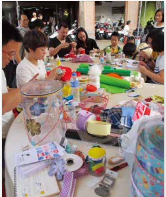
臺北設計城市展的街區亮點活動

臺北「設計城市展」涵括「社會設計 Social Design」與「設計臺北 Design Taipei」兩大主題概念展，結合「臺北設計種」設計主題博覽會，以及臺北市產業發展局舉辦的「2012臺北設計獎成果展」；並同步串聯四大