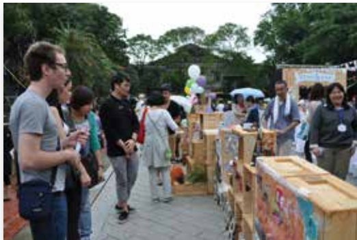
臺北設計城市展的「城東設計嘉年華」活動現場

由臺北市政府文化局主辦的第1屆臺北「設計城市展」，以「期待 臺北」為主題，民國101年10月5日至28日於松山文創園區盛大登場，透過一系列設計主題展、論壇與講座等活動，帶領市民思考設計的本質，共同夢想、建構與實踐一個更宜居人本的臺北城市。