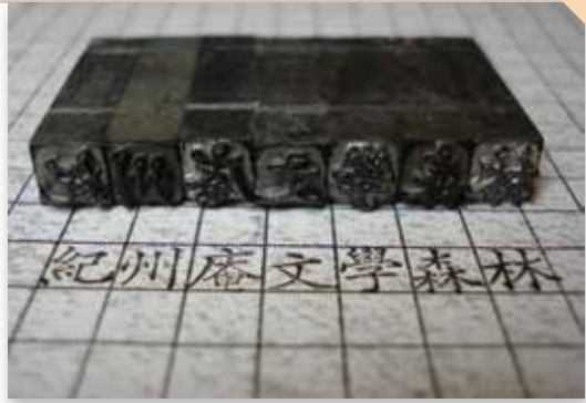
「書院臺北」專屬集章採用日星鑄字行所製作紀念戳章