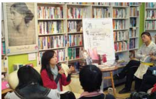
「我讀，與我遇見的書—文學書塾系列講座」系列講座

「2012臺北文學季」於民國101年2月11日至5月27日辦理，參與總人次約3萬6,000人次，成功凝聚民眾對臺北的情感和記憶，也讓整座城市的文學氛圍更加深濃。