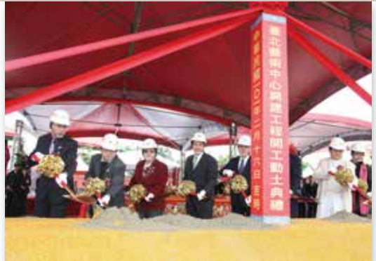
「臺北藝術中心」開工動土典禮

「北部流行音樂中心」主廳館外型構思靈感來自臺灣山稜線，設有5,000個席位，加上站席最多可容納6,300人；名人堂以LCD螢幕組成