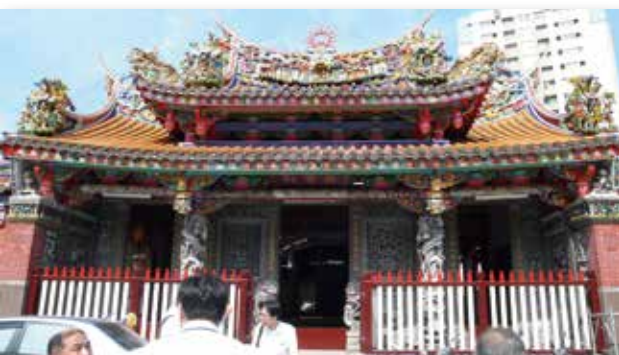
位於臺北市寧夏夜市旁的陳德星堂

「明年此時明信片，來年追憶舊時光」則製作6款手繪古蹟明信片，民眾造訪景點並寫下參與活動的心情與感想，投入專用信箱，在隔年古蹟日活動前夕，即可收到去年自己親筆寫的明信片；「古蹟一齊來開門，輕鬆自由行」，則在古蹟日週末串連臺北市內83處古蹟、歷史建築共同參與古蹟開門活動。