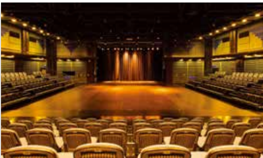
「水源劇場」為臺北市獨特的三面式劇場