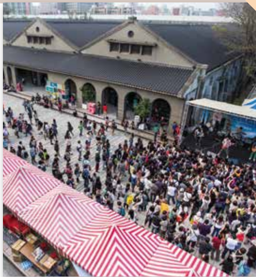
「原創音樂舞臺」吸引許多喜愛音樂的民眾圍觀聆聽。

「2012松山原創基地節」主題展分為四大展區，分別為「創意實驗室」、「城市就是舞台」、「臺北創意學院」及「好家在臺灣」四大區域。除主題展區外，並透過藝術藏寶圖、原創市集及原創音樂舞臺各項活動，讓民眾飽覽臺北的原創魅力。