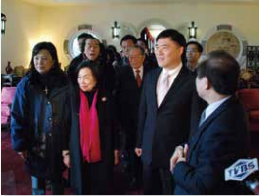
郝龍斌市長參觀士林官邸正館新開放的二樓

由文化局補助，餘由陳德星堂自行籌措，為臺北市兼具宗族象徵與文化資產多重意義的建築之一。歷經6年整修工程，終在101年12月25日舉行修復竣工落成祭祖大典，臺北市市長郝龍斌親至現場祝賀，並與陳德星堂董事長陳澤永共同揭牌。