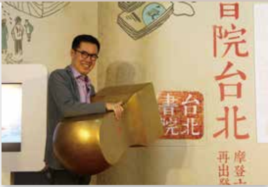
「書院臺北」起跑記者會