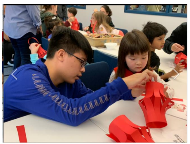
新年闖關活動受到很多美國高中老師與學生們的喜歡，活動進行中，陽明學生額外指導附設幼兒園的教師與孩子們製作燈籠。