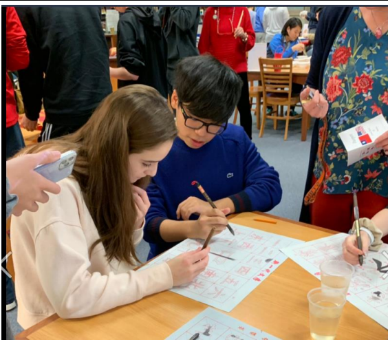
新年闖關活動之一-寫書法，陽明學生指導美國學生如何正確握毛筆，並示範書法寫字方式。