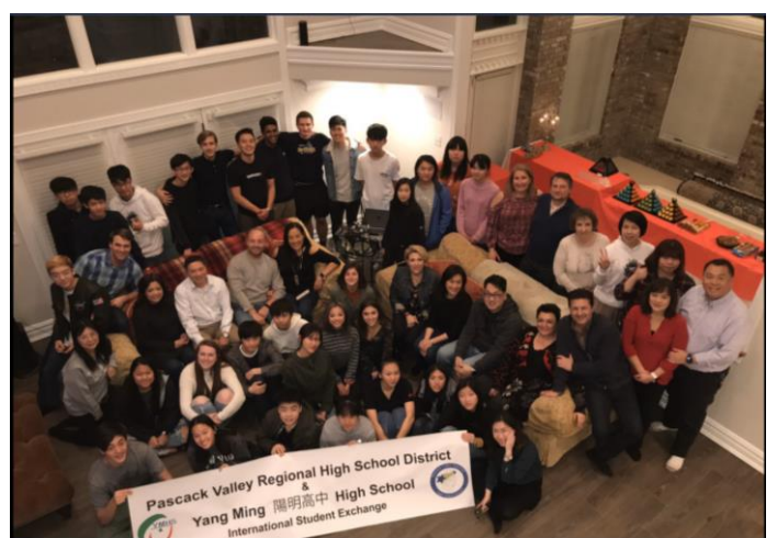
所有參與這次交流的教師、學生與寄宿家庭在歡迎晚會中一起合拍的大合照，留下美好的紀錄。