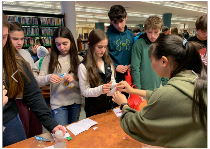
新年闖關活動進行狀況，陽明高中學生指導美國學生製作香包，示範如何使用針線縫紉香包。