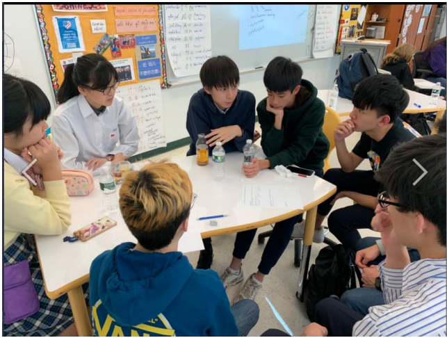
學生穿著陽明高中制服，與美國學生分組討論糧食安全議題。