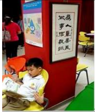
圖書室內學童閱讀情境