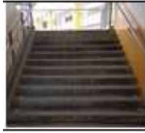
老師錄影學生彩排