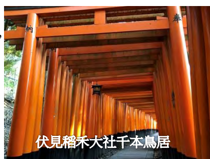
伏見稻禾大社千本鳥居

這裡最有名的就是千本鳥居，稻禾大社祀奉稻荷神屬農業及商業的神明，從江戶時代起，信徒會捐獻興建鳥居以表達對神明的敬意。