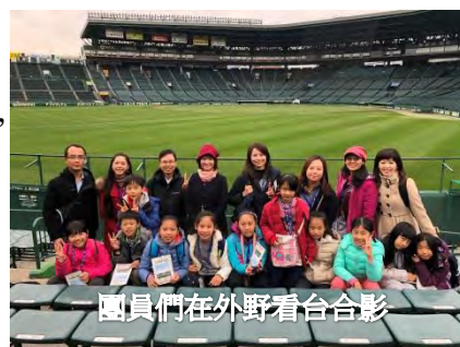
團員們在外野看台合影

參觀甲子園歷史館，館方特別開放球場讓團員參觀拍照，在這裡舉辦的日本全國高中棒球聯賽已有 100 多年的歷史。