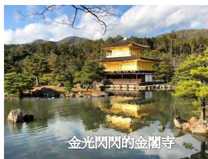
金光閃閃的金閣寺

鹿苑寺又名金閣寺，是日本室町時代足利義滿修建禪修之處，1950 年遭縱火焚毀後，1955 年依原有的樣貌重建。參觀當日運氣不錯，原本陰霾的天候，頓時陽光露臉，讓金閣寺更加金碧輝煌。