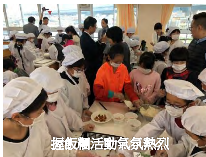
握飯糰活動氣氛熱烈

五月田小學及沖小學午餐主食，星期二、四為麵包，星期一、三、五為米飯，訪問沖小學的這一天是星期三，校方巧思的安排了握飯糰的活動，飯糰是日本國民日常美食，和日本小朋友一起握飯糰格具意義。