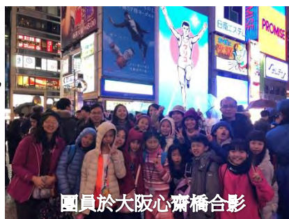
團員於大阪心齋橋合影

到大阪道頓堀及心齋橋一定要和固力果的霓虹招牌合照，道頓堀是 1615 年完成的運河並以捐地興建的的安井道頓命名的知名購物聖地。