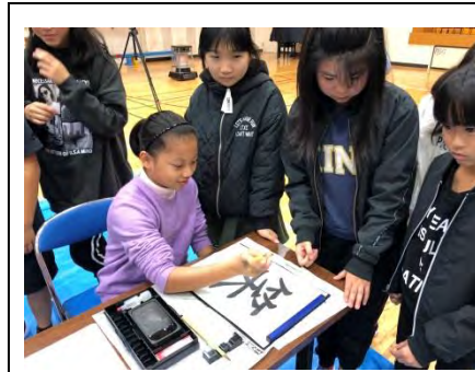
雙蓮學生體驗書道