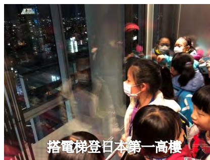
搭電梯登日本第一高樓

登上日本第一高樓，隨著高速電梯往上升，孩子們望著電梯外的夜景連連發出讚嘆聲，阿倍野 HARUKAS 高 300 米，也是日本第三高結構物，僅次於東京晴空塔和東京鐵塔。