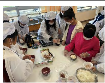
兩校學生一起握飯糰