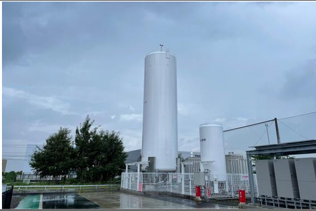
圖5、現場液氫罐照片