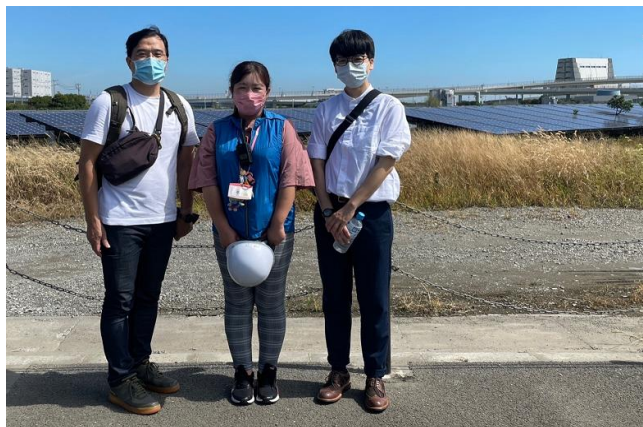
圖7、本次參訪成員合影留念