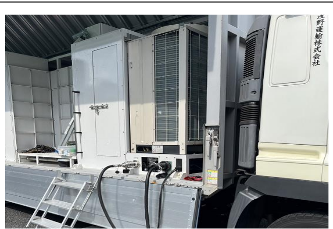
圖20、移動式加氫站照片