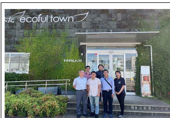
圖13、本次參訪成員合影留念