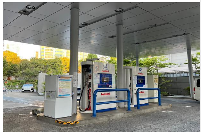
圖12、岩谷加氫站照片