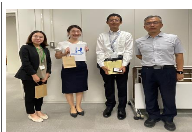
圖17、本次參訪成員合影留念