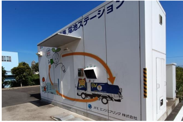
圖9、電動垃圾車電池交換系統