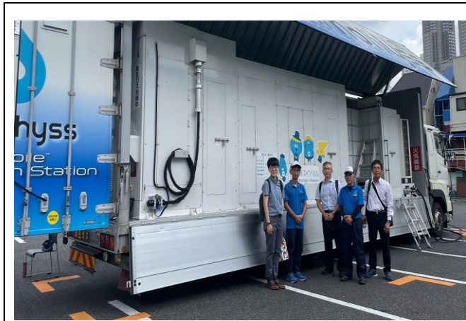
圖19、本次參訪成員合影留念