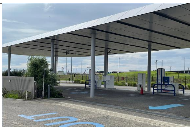
圖2、關西機場加氫站