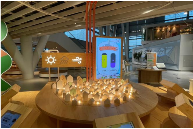
圖25、氫能展示館內部照片