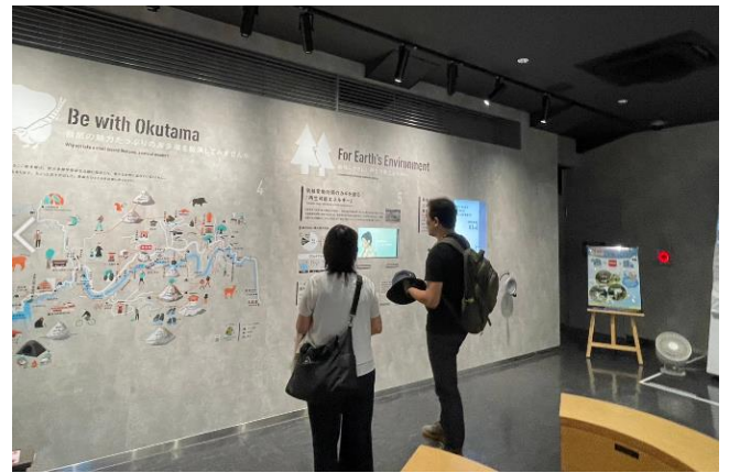
圖24、再生能源宣傳館內部照片