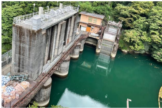
圖23、水力發電取水口