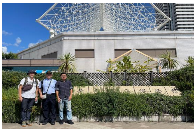
圖3、參訪成員合影留念