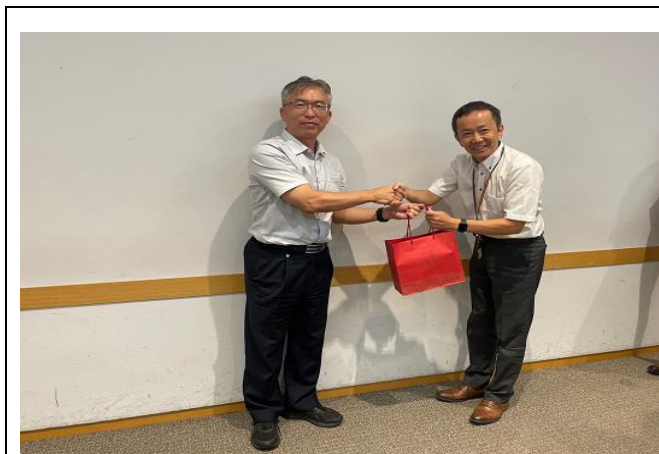
圖21、本次參訪成員合影留念