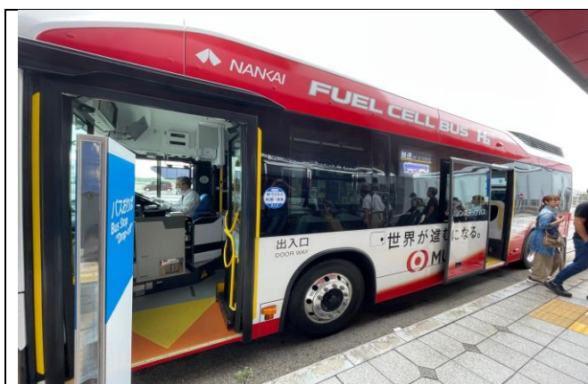
圖1、氫燃料電池巴士