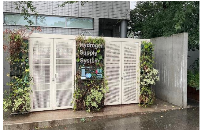
圖26、氫氣貯存掩體設施