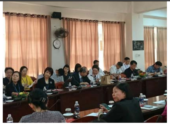
校長團維新大學座談會

3月14日(二)，參展人員於上午參訪峴港大學，下午搭乘越南航空VN125返回胡志明市。