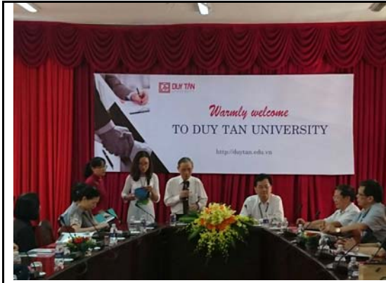
校長團維新大學座談會