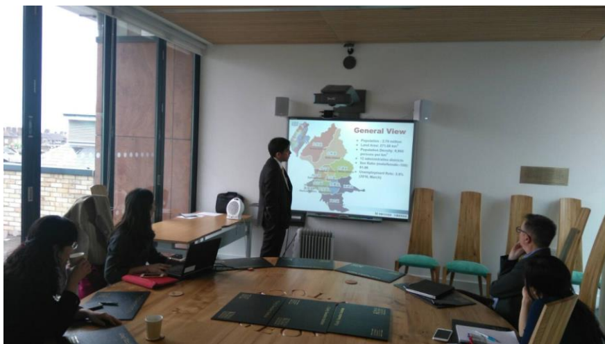
圖一、於倫敦國王學院桑德斯機構洽談未來合作內容