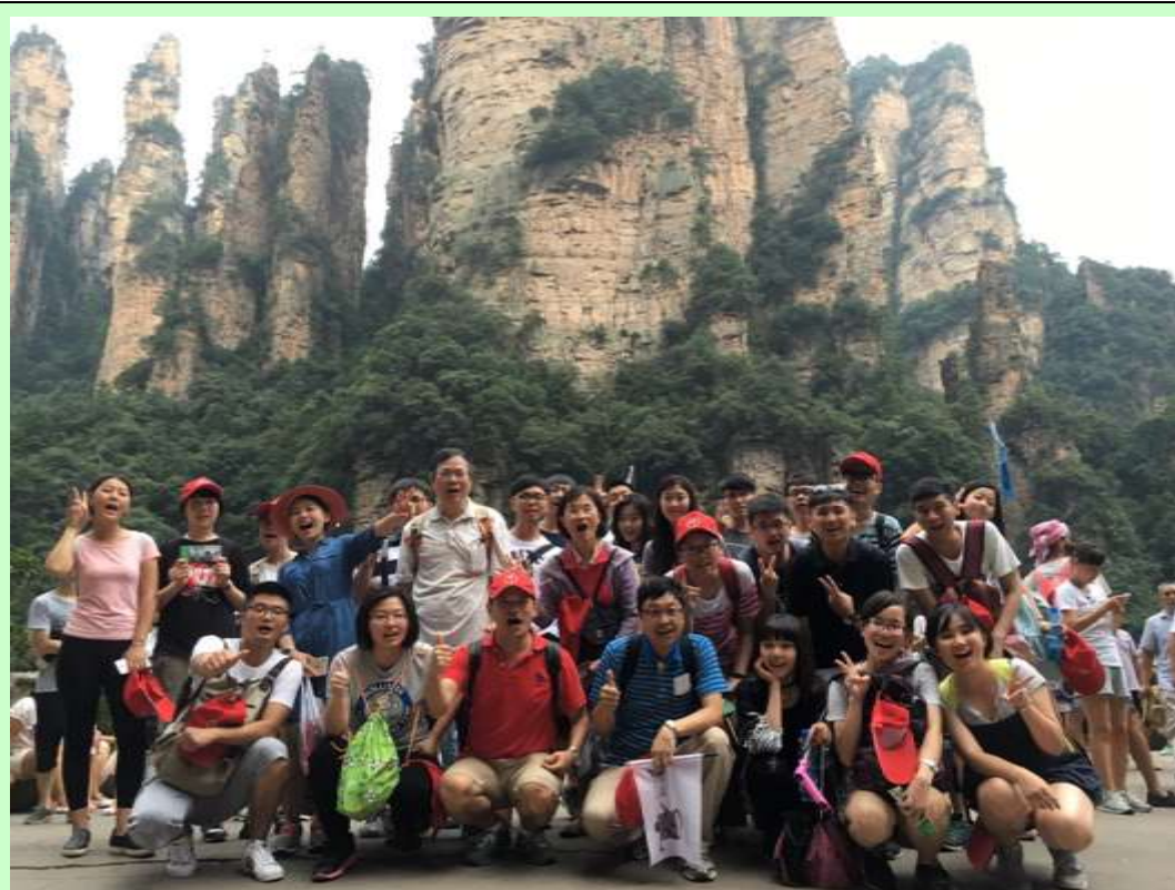
領略世界地質公園張家界風光