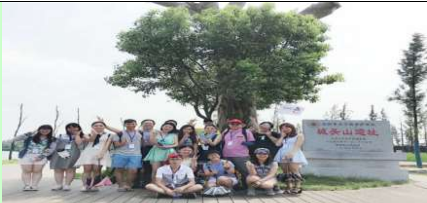
參觀澧縣城頭山博物館

臺灣師生及湖南文理學院同學共同領略湖湘文化，前往澧縣參觀目前年代最早、被譽為「中國第一古城」的城頭山遺址所在地— 城頭山博物館 、6500 年前全世界最早的 稻田遺址 。