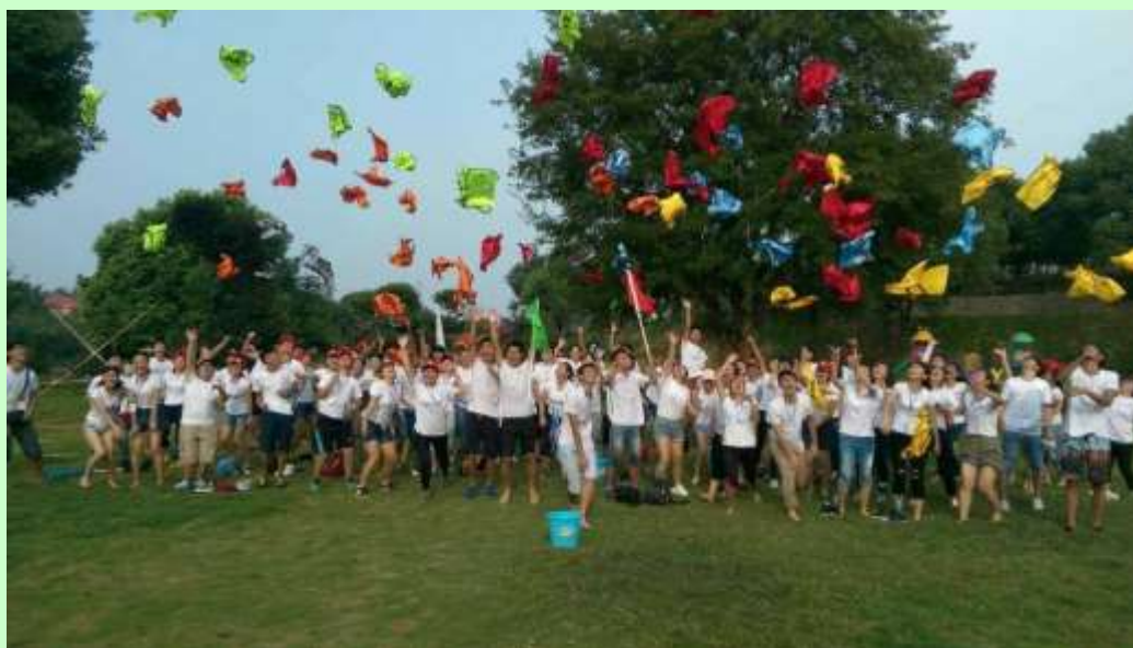
兩岸學生拓展營活動