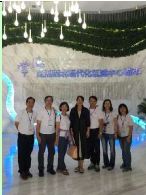
拜訪常德城市規劃館