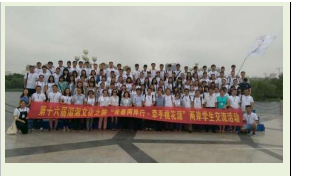
此次交流活動所有師生合影