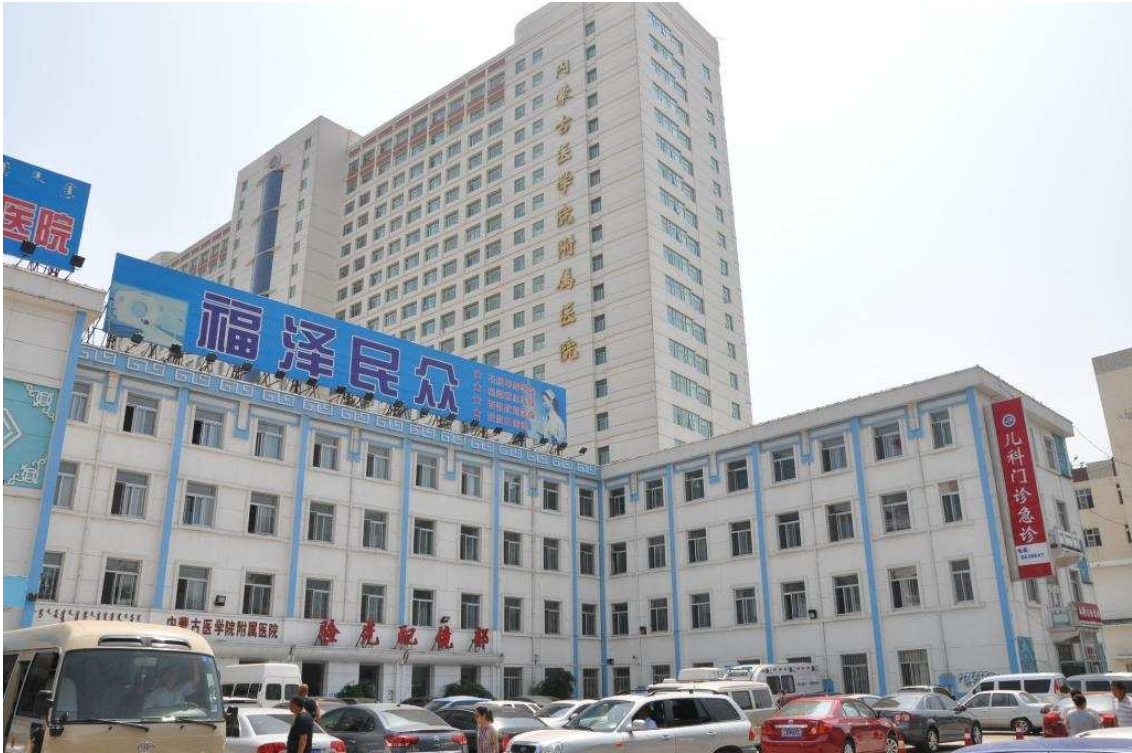
內蒙古醫學院第一附屬醫院新舊大樓林立形成強烈對比