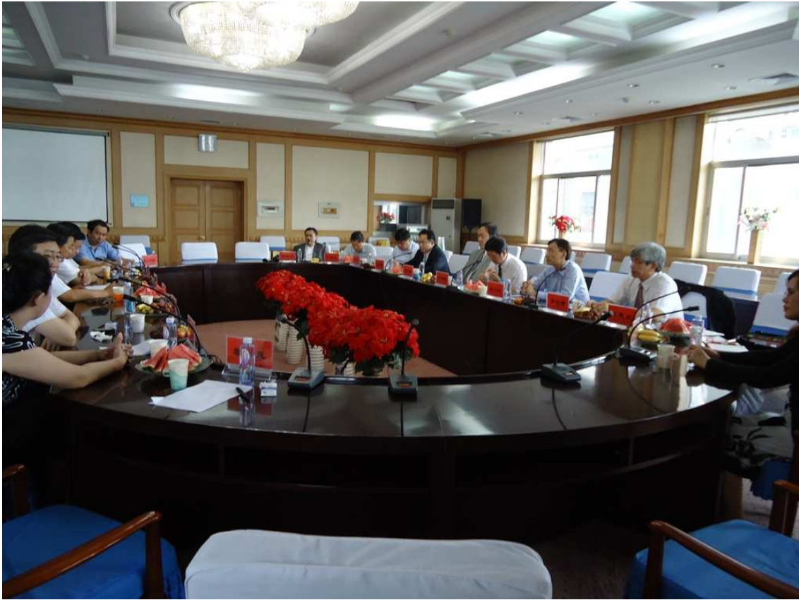
內蒙古自治區衛生廳與各醫院院長座談（一）