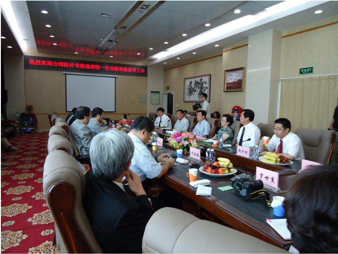
內蒙古自治區人民醫院座談會