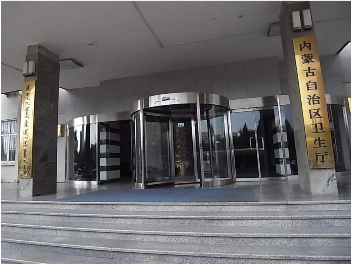
內蒙古自治區衛生廳辦公大樓外觀