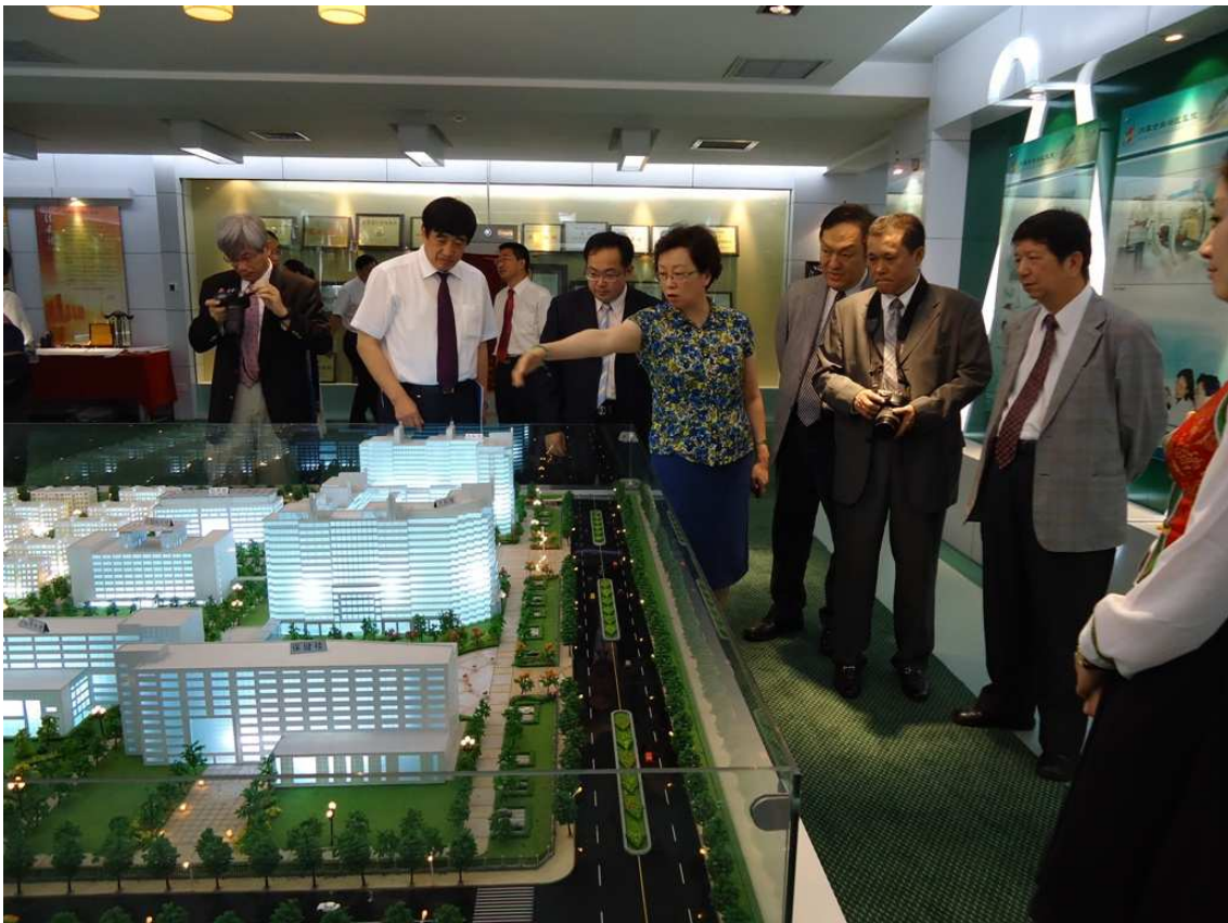
參觀內蒙古自治區人民醫院 60 年成果展廳