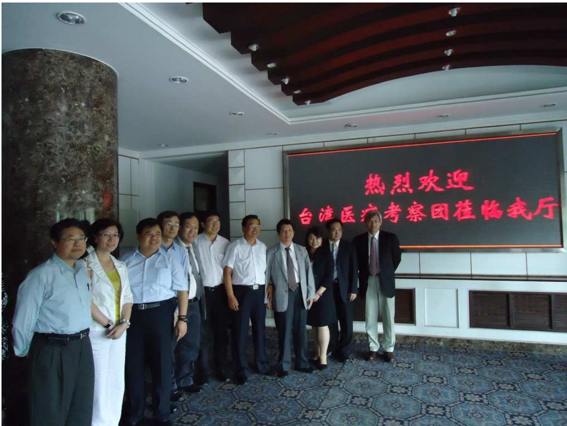
拜會內蒙古自治區衛生廳