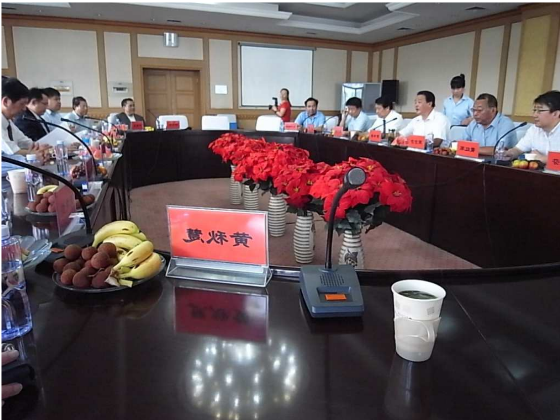
內蒙古自治區衛生廳與各醫院院長座談（二）