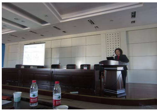
10月23日疾病預防控制中心演講