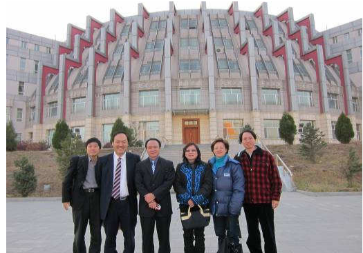
10月24日參訪內蒙古醫學院