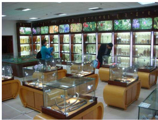
10月24日內蒙古醫學院蒙醫博物館