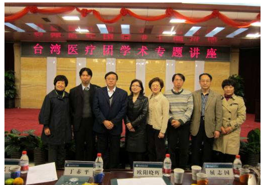
10月23日內蒙古人民醫院演講