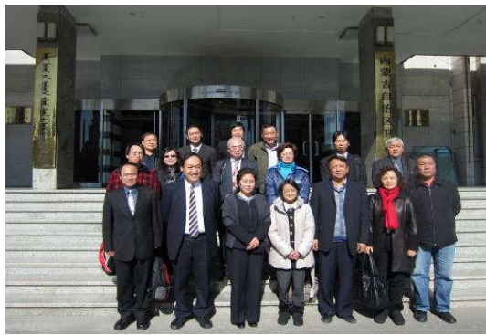
10月24日拜會內蒙古衛生廳