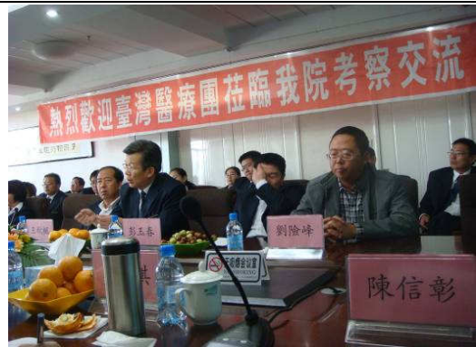
10月28日包頭市第二附屬醫院