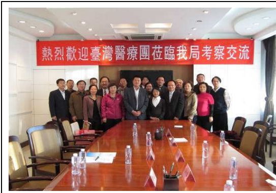
10月27日包頭市衛生局