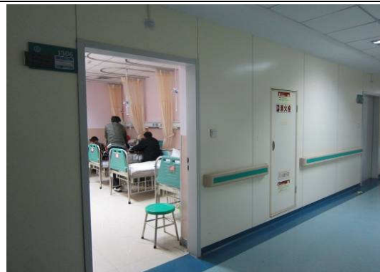
10月27日包鋼醫院病室及懸吊點滴架