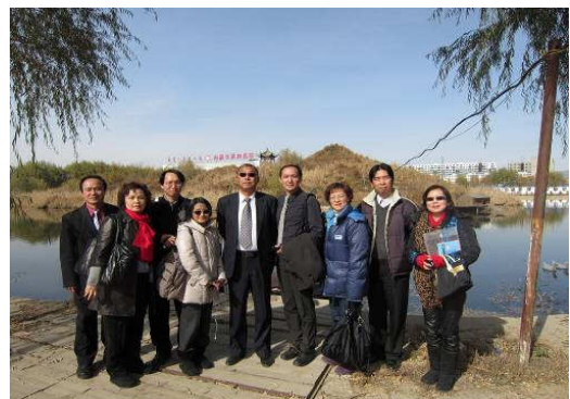
10月25日內蒙古第四醫院人工湖