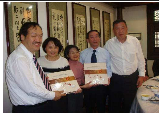
10月28日包頭市第二附屬醫院