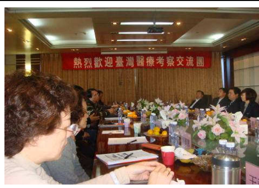
10月28日包頭市中心醫院