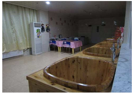
10月27日包鋼醫院嬰兒室浴盆