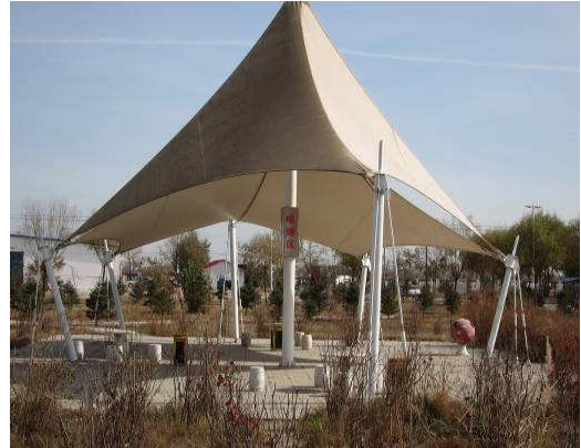
10月25日內蒙古第四醫院戒菸亭