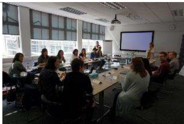
圖 23 課程上課情形。