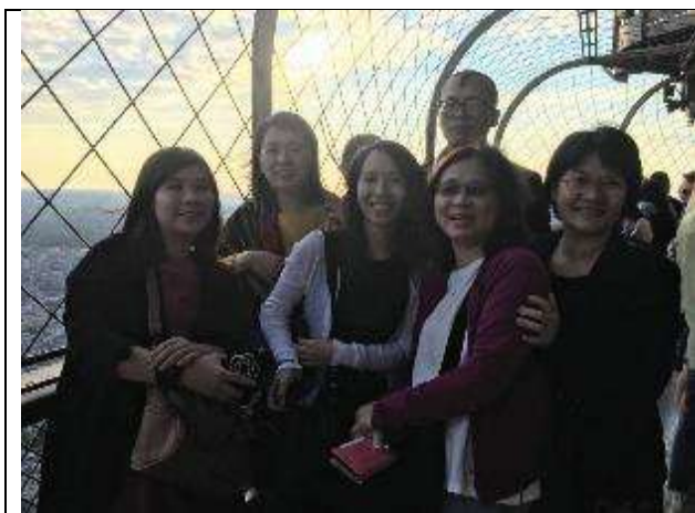
圖 24 團員們於艾菲爾鐵塔上合影。