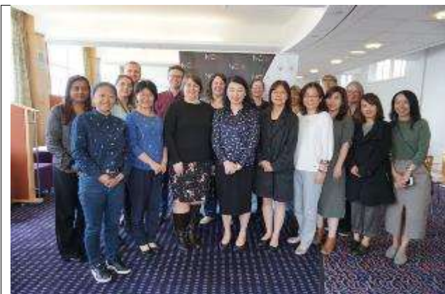
圖 22 訪團與 NCUK 曼徹斯特辦公室人員合照。