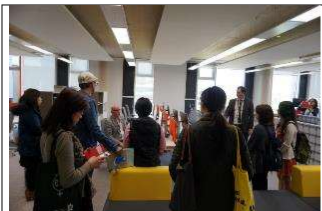
圖 20 全英最新穎校園-河畔校區教職員辦公室介紹。