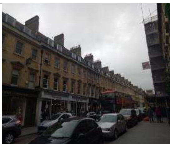
圖 32 在巴斯城裡信步漫走，浸淫獨特文化古城氛圍。