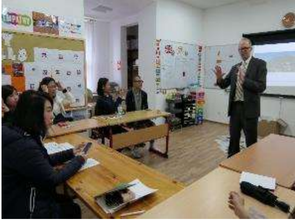
圖 3 瑞士萊辛中學校長向參訪團介紹行政 領導實務。