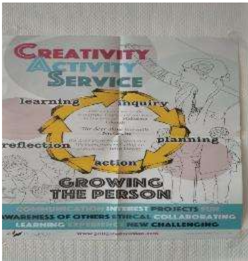
圖 15 CAS 課程的核心思想與設計。

習氣氛，也是相當具有執行力與創業家精神的課堂內容。課堂裡除了活動討論外，也有另一位老師為同學進行個別指導，教授學生做活動用的影片。同一個課堂有二位教師同時進行活動需要的教學且互不干擾，這是在台灣少見的教學情形。