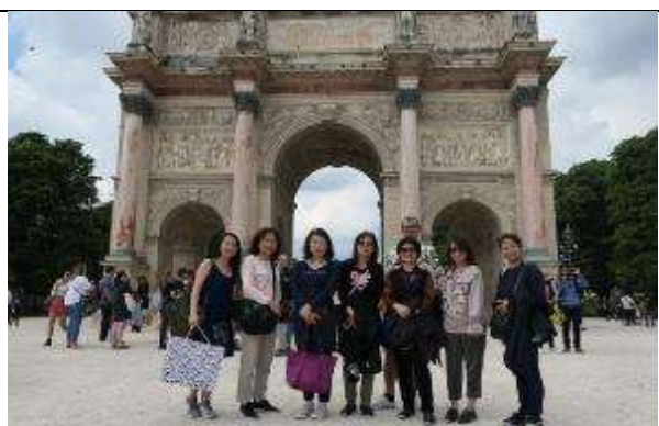
圖 27 參觀完羅浮宮，團員們於外圍凱旋門合影。