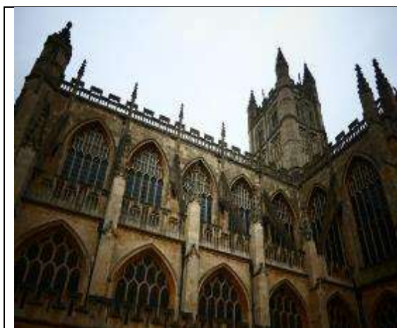
圖 31 巴斯修道院外欣賞其宏偉的建築。

的排隊人龍，只好放棄。在巴斯城裡信步漫走，望眼皆是古時留存至今的建築，化身為現代商店與餐廳，構成一幅與大多數現代城市有顯著差異的獨特城市風貌。與看完巴黎市景之後的感想一樣—忍不住深思起要如何改善自己國家的城市美學，架構出獨一無二的城市景觀。我想我們也不應該一味崇尚外國的文化，應好好發揮自己文化的特色，讓自己國家的特色彰顯出來，這樣的國家與城市才有看頭。在教學上也是如此，除了要培育學生必備的知識與技能外，更要視個人特色與差異讓學生們都能盡情發揮，在未來就業與競爭的場域上，才能有自己獨特的特色勝出。