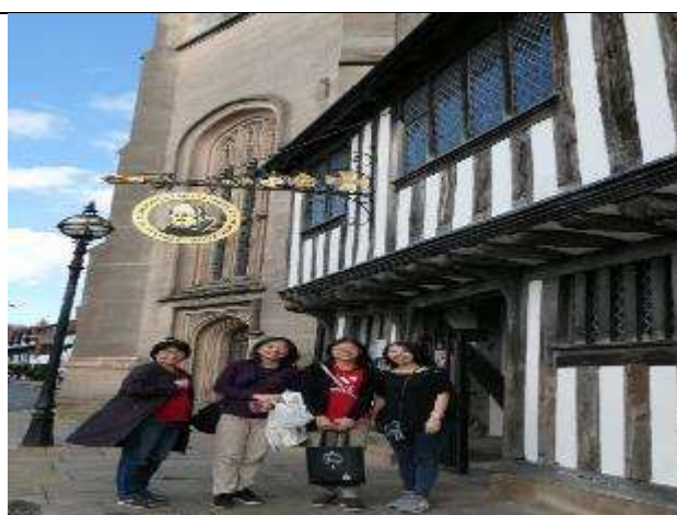
圖 34 團員們上完拉丁文體驗課程，於莎士比亞的教室和市政廳外合影。