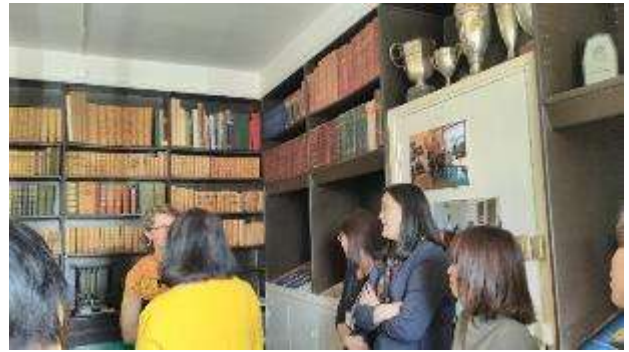
圖 16 CAS 教師向參訪團對介紹學生目前討論的活動設計，還有教師的角色。

4.化學課：這是一門 11 年級的課程，課程的內容是反應熱的介紹，在台灣課綱中是屬於高一基礎化學的課程，介紹黑斯定律，即為反應熱加成定律。這個教室的白色油漆牆壁上貼著這門課會介紹的部分，定義 Definitions、先備知識化學方程式 Equations needed、焓 Enthalpy、還有兩張學生的作業放熱反應與吸熱反應的圖。這門課教師只使用一個海報架大小的白板介紹今天的課程，學生只有 7 人，教師先是介紹反應方程式可以由不同的路徑達成，也就是說反應方程式雖然表達成為一個步驟其實也可能是兩個步驟，在這裡教師用中間產物的概念來介紹，反應方程式可以是數個步驟的整合，而在教師所給予的學習單中，選擇題的部分，部分的概念是台灣在高三的時候所教授的，但其實在反應熱的大概念下，熱的產生是因為鍵結的斷裂，所以如果由大概念來看，國際文憑 IB 化學課程的設計比較有統整性，而不是將概念直接切割成細小的部分來處理。