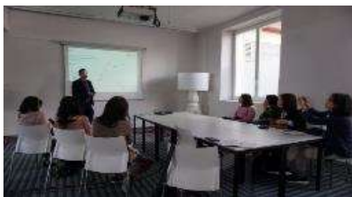
圖 5 瑞士飯店管理大學接待人員講解不同學 習主軸的課程。

本次參訪瑞士飯店管理大學萊辛校區，了解該大學如何運用五星級運動會所渡假酒店改建而成的校舍、完備的酒店設施及環境與極富盛名的飯店管理運作經驗及資源，透過『課堂學習、參觀體驗、應用實踐』的課程模式，多年來招徠近 55 個國家的國際學生，提供多國語言、烹飪藝術及飯店管理等不同學習主軸的遊學體驗課程，將運作五星級飯店中的創業家精神融入大學教育的各類課程中，亦將精緻深化的大學實務教育內容轉化為涵養國際學生的短期體驗課程，打造能行銷至各國的優質教育品牌。