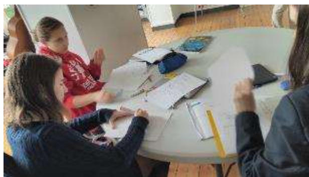
圖 18 教師隨堂小考，學生利用小白板回答問題。