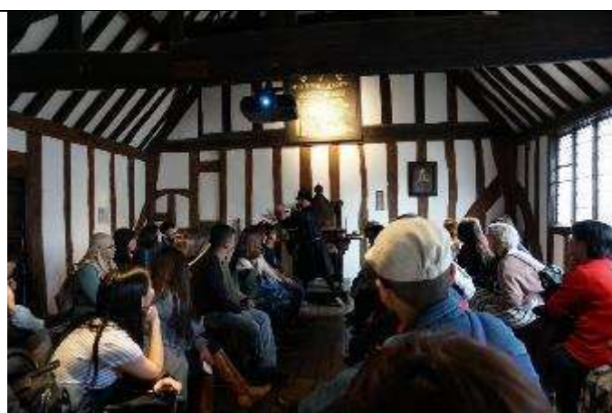
圖 33 團員們體驗都鐸時代的拉丁文模擬課程。

整體而言，這個體驗課程的安排，使我們彷彿掉入時光隧道，化身莎士比亞的同學，體驗當時教育的方式與精神。體驗完拉丁文課程，我們還有些許時間，便散步走到埃文河畔體驗迷人靜謐鄉村風光，想像莎翁少時也曾凝視著同樣的一條河。這裡也有許多跟莎翁劇作人物有關的雕像，整個史拉特福可說是圍繞著莎士比亞的主題，使人充分浸淫在莎翁的文學世界裡。