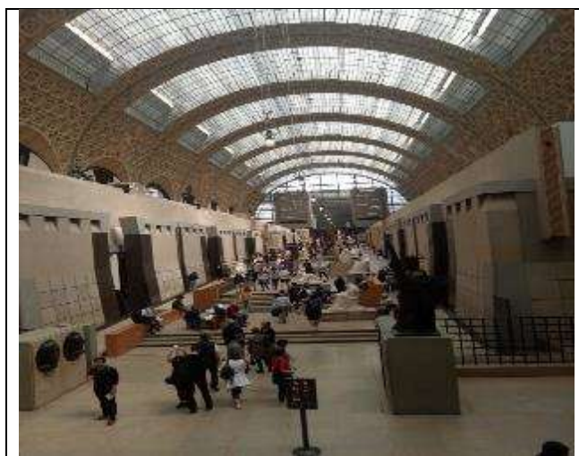
圖 28 於奧賽美術館明亮的中央展區欣賞雕塑作品。