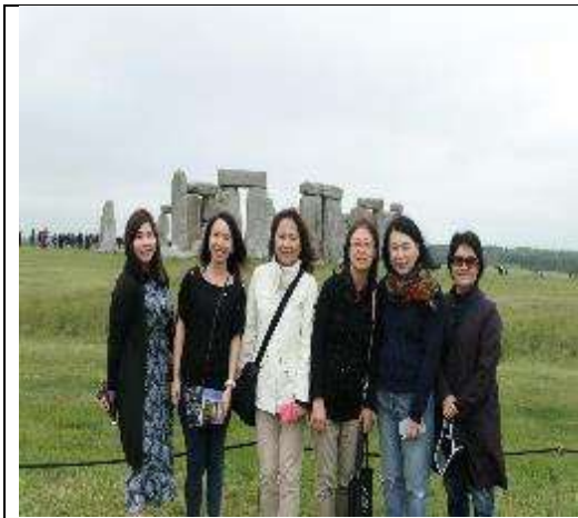
圖 29 團員於巨石陣前合影。

另外，對於旅客中心設立在離巨石陣有一小段距離的地方，以及我們須搭接駁車才能接近巨石陣的做法，顯示出英國對於古蹟維護的用心。如果遊客中心就直接座落在巨石陣旁，破壞的範圍難免就會變大，而巨石陣旁若有熱鬧現代的服務中心，恐怕也顯現不出如此蒼茫的氣勢，因此這種用心維護古蹟的態度與做法實在值得我們參考。