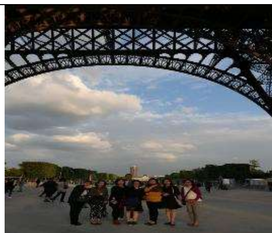
圖 25 團員們於參觀完艾菲爾鐵塔後在出口處合影。