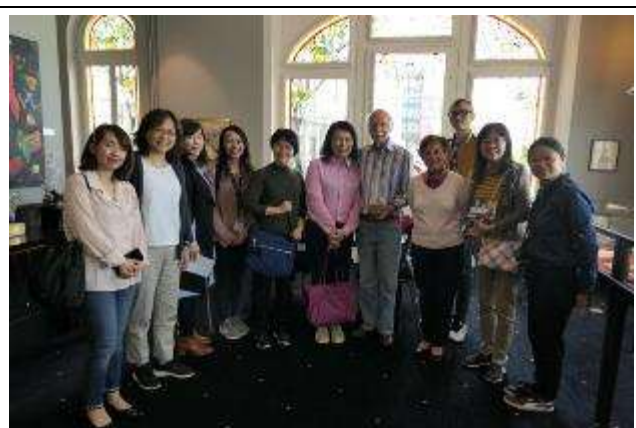
圖 8 在莫西曼廚藝收藏館 The Mosimann Collection 巧遇世界名廚 Anton Mosimann。

參訪的 Le Bouveret 校區位於日內瓦湖的湖濱，校舍由五星級飯店改建而成並與世界名廚 Anton Mosimann 的莫西曼廚藝收藏館(The Mosimann Collection)及瑞士廚藝學院(The Culinary Arts Academy)比鄰而立，提供學生學習飯店經營管理及廚藝深入探究最佳的環境與軟硬體資源，融合商業及廚藝的三年制瑞士及美國雙大學學士文憑的飯店管理課程中。