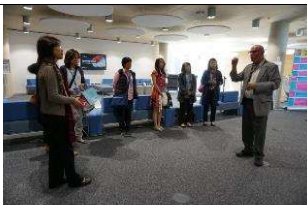
圖 21 全英最新穎校園-河畔校區學生學習中心設施介紹。