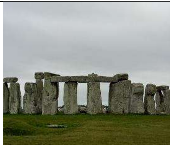
圖 30 觀察夏至時陽光可直接穿透的位置。