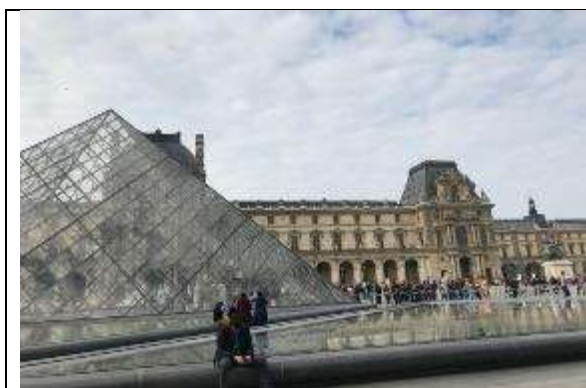
圖 26 在羅浮宮入口處等待安檢，一邊欣賞著名的透明金字塔。

不論是蒙娜麗莎還是維納斯，所呈現出的「美女」形象皆是較為豐腴、中性，與現今世俗的審美觀不同，說明每個時代對於美的定義都有所不同。身為教育者，我們應多鼓勵孩子欣賞自己的獨特與美麗，不需特意節食追求紙片人般的身材或迎合不停改變的一時審美觀與短暫流行，應培養自我的信心與內涵，並對美好的事物能從多元角度欣賞。