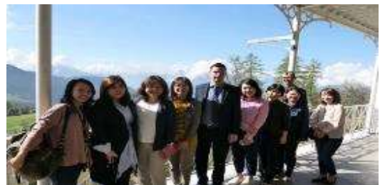
圖 6 瑞士飯店管理大學融合阿爾卑斯山 作為體驗學習的校舍環境。