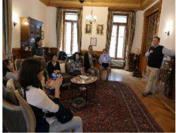
圖 4 瑞士萊辛中學知識論課程教師分享。