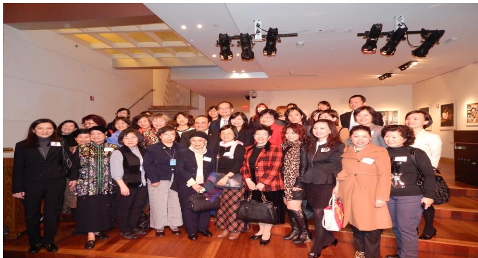
本屆臺灣代表團與外交部駐紐約臺北經濟文化辦事處人員合影

本屆會議臺灣NGO籌組多場平行會議，其中研究內容質與量皆達到國際水準，而其中提及臺灣的案例，亦獲得與會人士的認知與討論，增長了臺灣的能見度；另公部門方面，TECO除響應大會主題辦理國際研討會，有助我國與國際社會之經驗交流外，又由於我國非聯合國會員國，但透過其溝通與協調，能使團員進入聯合國參與相關會議，亦提升臺灣對婦女權益問題了解的廣度、深度與國際視野。