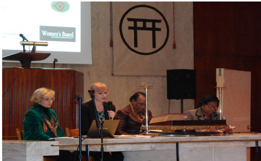
主講者對與會人員闡述 3 個 F 的理念與影響

因此，由於婦女是家庭的核心，家庭又是社會的基礎，所以第21世紀則將仰賴婦女，重塑一個人性化的社會。