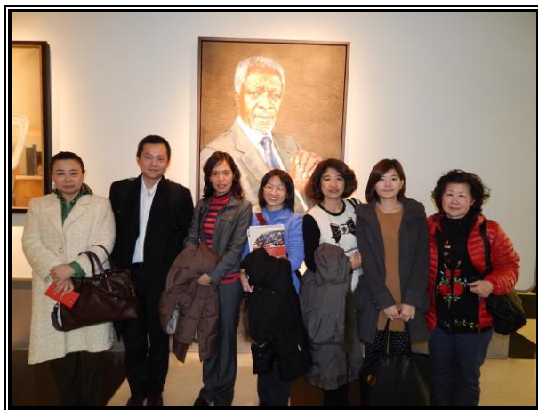
團員們珍惜進入聯合國內參與會議的難得經驗

由於我國非聯合國正式國，一般來說無法參與聯合國CSW正式會議，但在外交部駐紐約臺北經濟文化辦事處（Taipei Economic and Cultural Office in New York，簡稱紐文處、TECO）的多方努力下，為本次參與夥伴爭取得進入聯合國旁聽的證件，團員對此難得的機會，表示感謝與珍惜。