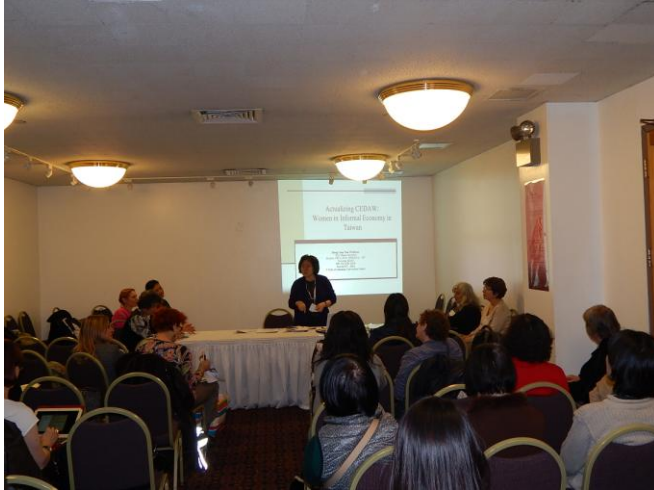
落實CEDAW：臺灣婦女在非正式經濟體制下角色之探討會議現場

，但在非正式經濟體制下，婦女在工作職場缺少安全性與保護性，但要加強社會的保護性有其相當困難度，因此建議運用特殊的方法與政策，例如利用提供較高的保險與福利，去改變那些在非正式經濟體制下受僱者的尊嚴與權利。