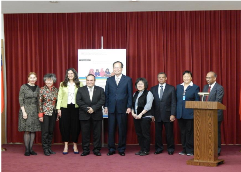
本場次由駐紐約 臺北經濟文化辦 事處主辦