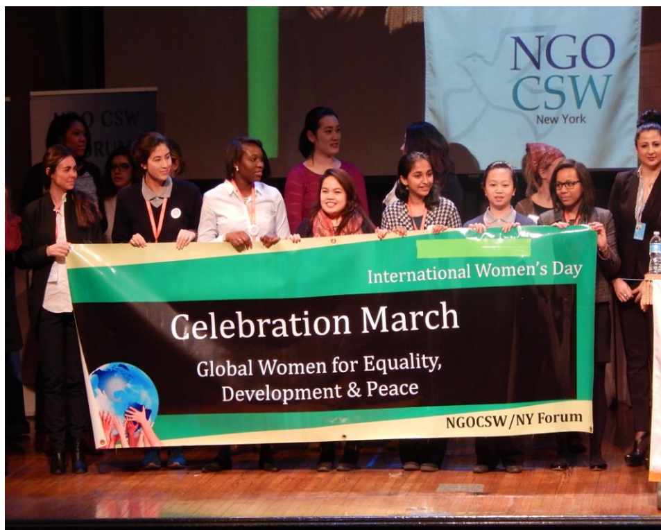
NGO-CSW會前會結束前全體大合唱