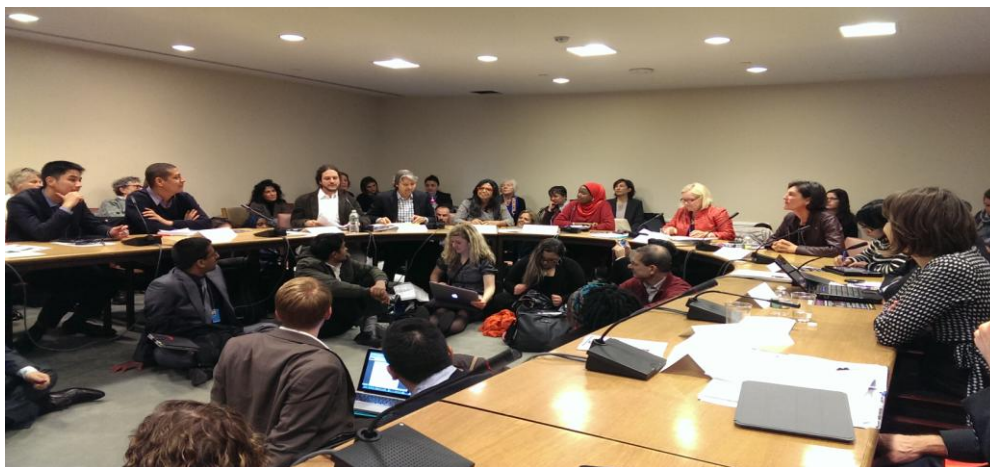
男性照顧(Men Care+)研討會議現場

1.將男性視為促進性與生殖健康權益(sexual and reproductive health and rights, SRHR)的支援夥伴，特別是家庭計畫、產前產後孕產婦健康及性傳染疾病預防等方面。 2.於性別暴力防治的方案與政策中，為男性施暴者、受暴者或目睹兒等，提供男性諮詢服務。 3.執行使父親負擔更多兒童照顧角色的計畫或措施，如：育嬰假。