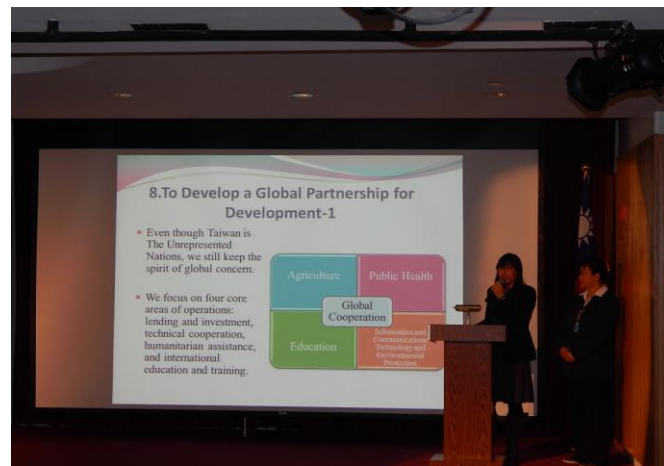
千禧年目標下的臺灣成果分享 會議現場