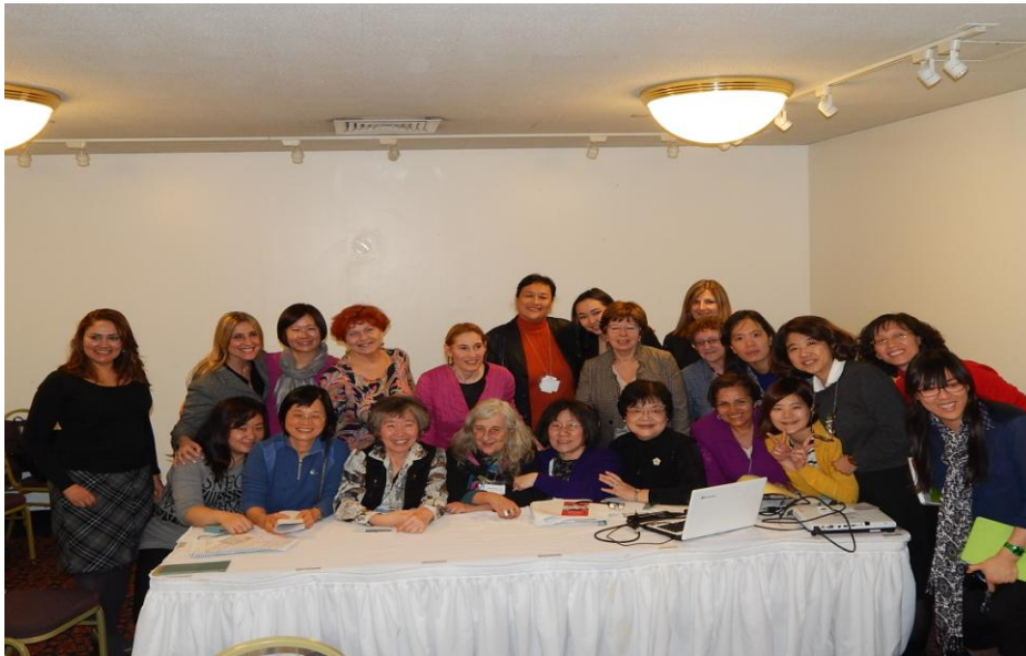
本場次會議由中華心理衛生協會主辦