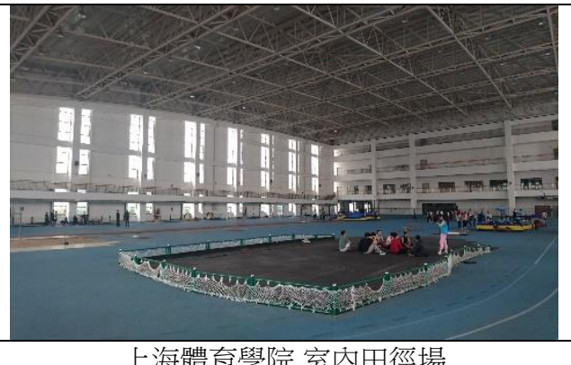
上海體育學院 室內田徑場