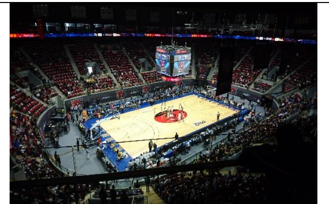
上海寶山體育館 2017 PAC-12聯盟男籃賽事