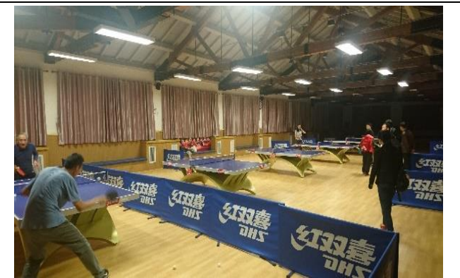
上海交大徐匯校區 室內桌球訓練場