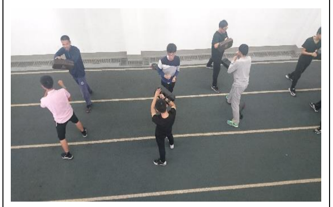
上海交大閔行校區 體育課(拳擊)