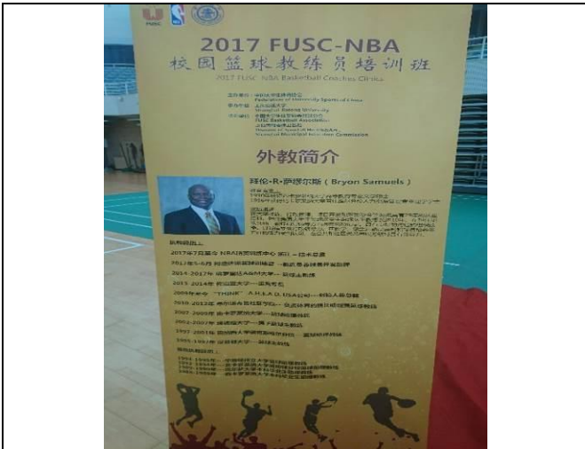
教練員培訓班師資簡介