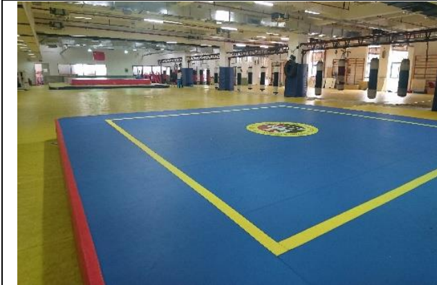
上海體育學院 武術散打訓練場