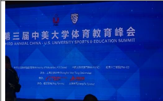
上海交大徐匯校區 中美大學體育教育峰會