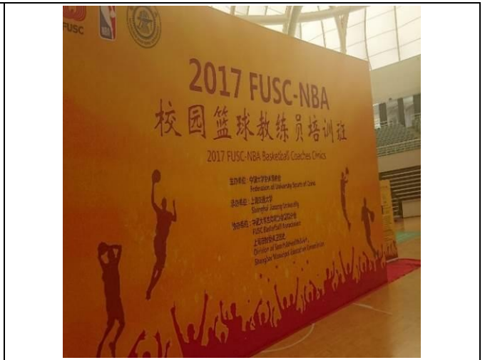
上海交大閔行校區教練員培訓班 TRUSS