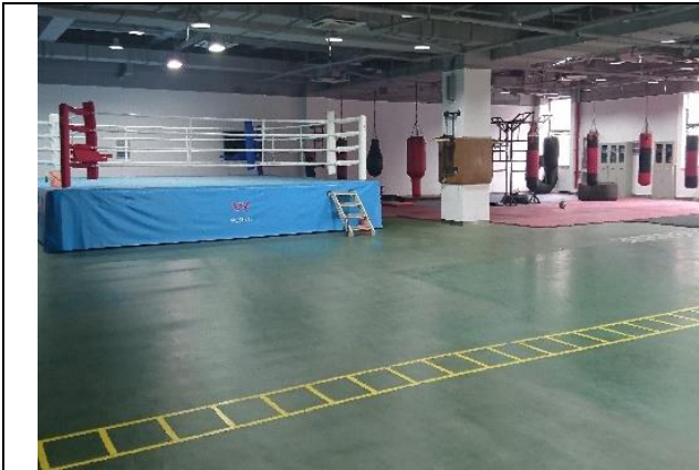
上海體育學院 拳擊訓練場