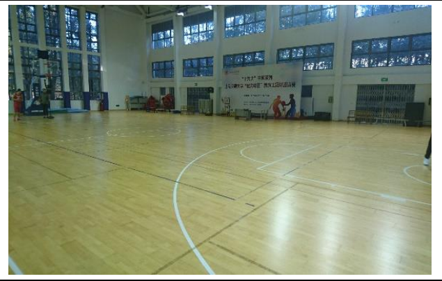
上海交大閔行校區 南區體育館籃球場