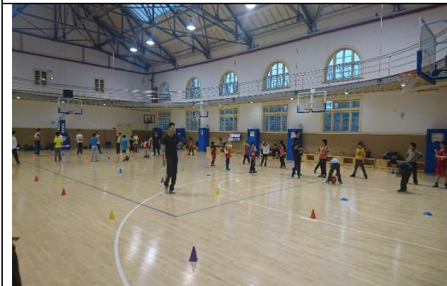
上海交大徐匯校區 室內籃球場