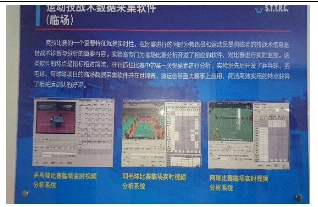
上海體育學院 運動技戰術數據統計軟體