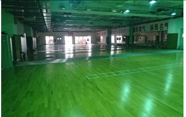
上海體育學院 擊劍訓練場