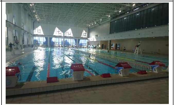
上海交大閔行校區 游泳館(主池)