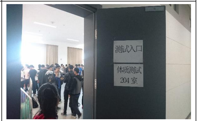
上海交大閔行校區 體能檢測室