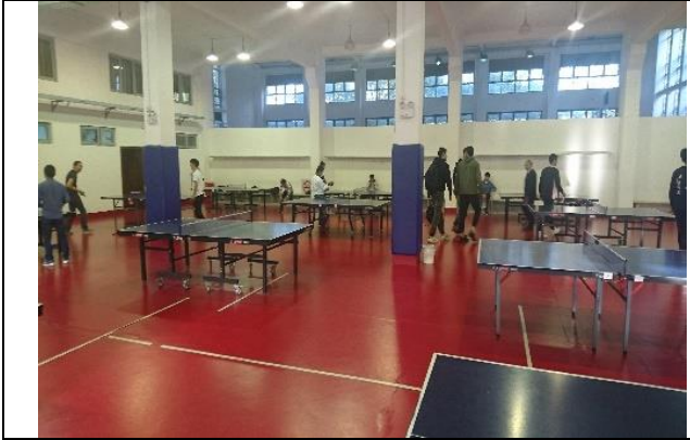
上海交大閔行校區 南區體育館桌球場