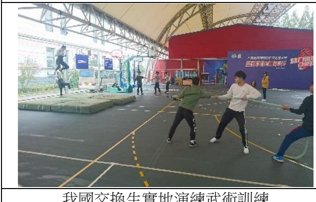
我國交換生實地演練武術訓練