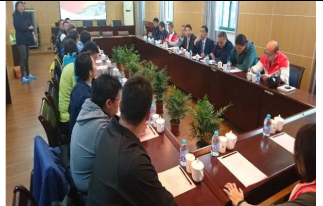
上海體育學院座談