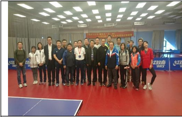
上海交大閔行校區 桌球隊合影