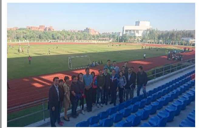
上海交大閔行校區 田徑場