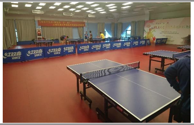
上海交大閔行校區 桌球場