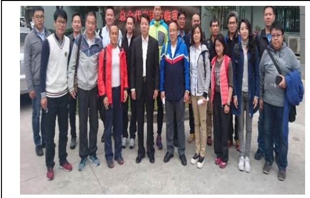
上海體育學院合影