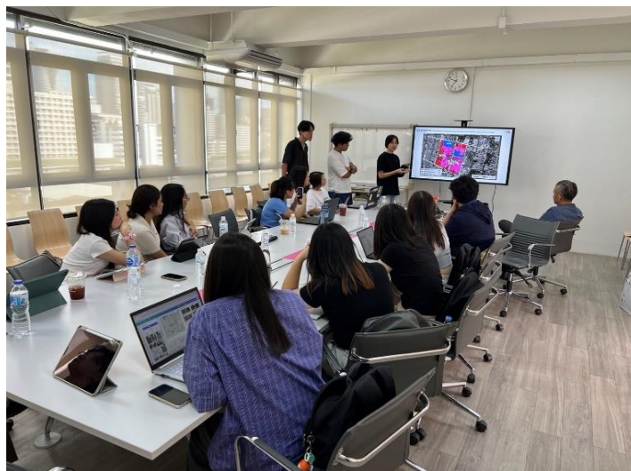
兩校學生成果報告評析