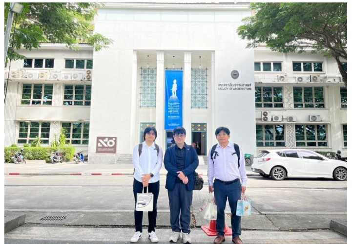
拜訪朱拉隆功大學建築學院