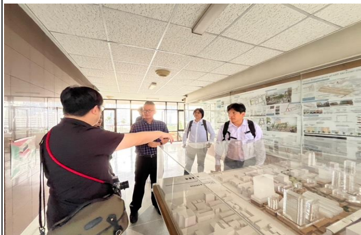
參觀朱拉隆功大學建築學院