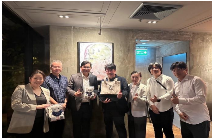
與朱拉隆功大學建築學院院長及副院長合照