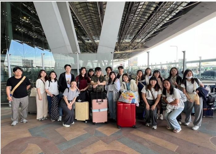
全體師生泰國機場大合照