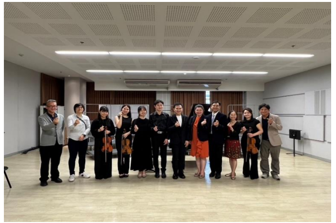
本校音樂系師生音樂演奏