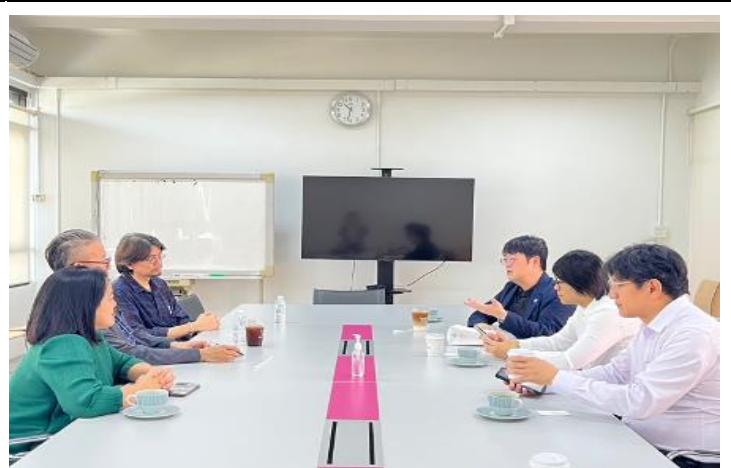
朱拉隆功大學都市與區域規劃學系交流