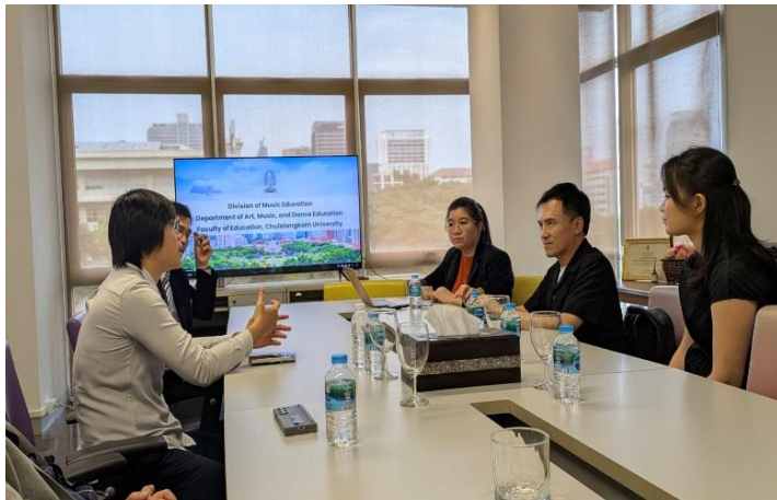
朱拉隆功大學音樂教育學系交流