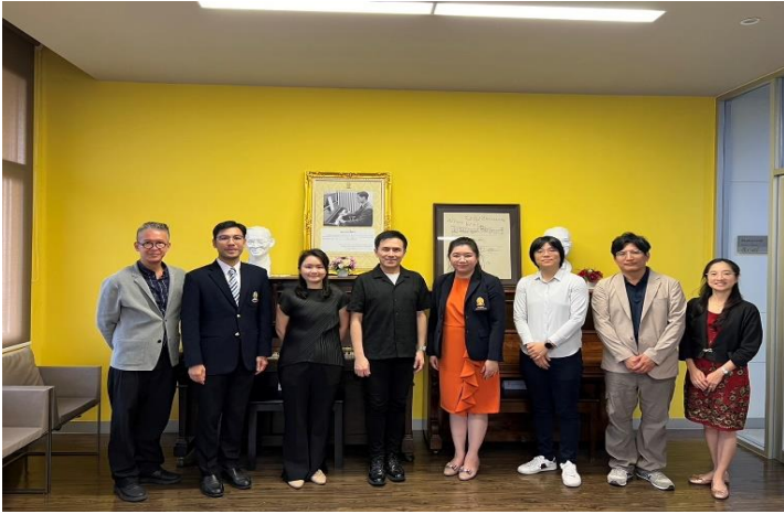
朱拉隆功大學音樂教育學系交流