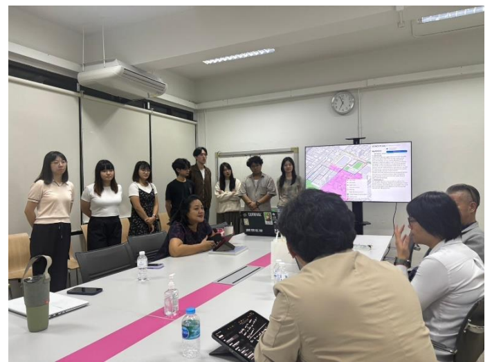
兩校學生成果報告評析