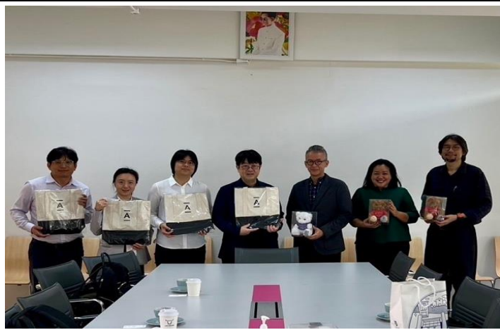
朱拉隆功大學都市與區域規劃學系交流