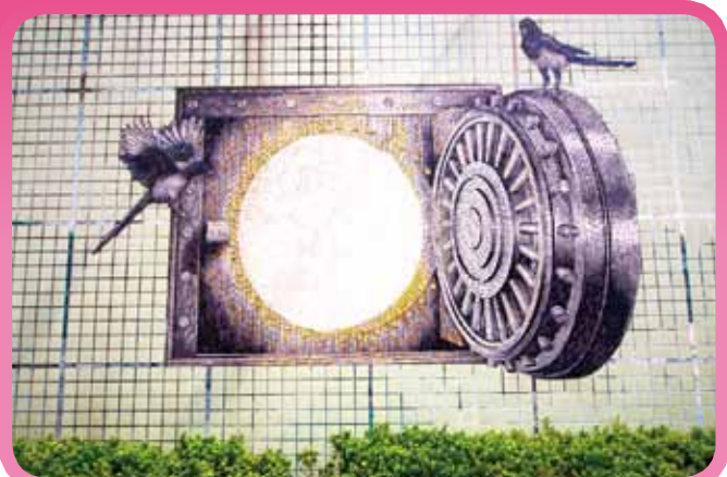
▲ 本區域擁有眾多金融機構，黃金閃耀的金庫圖像，象徵此處源源不絕的商機及未來發展的無限潛力。