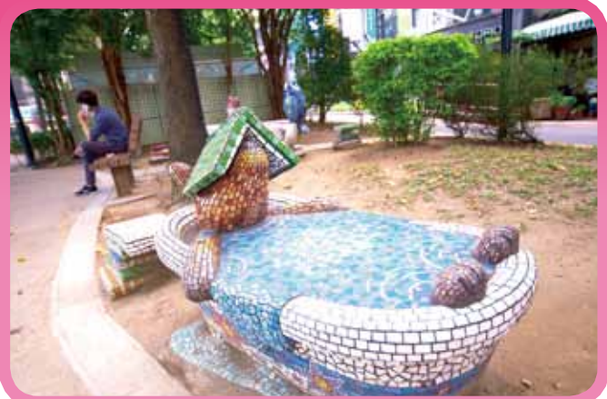
▲ 作品以結合本地的咖啡館、餐旅與地下書街特色而成。