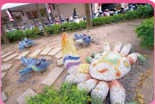
▲ 有朋自遠方來，淡水紅樹林的彈塗魚與招潮蟹相約於本商圈逛街、美髮與購物。