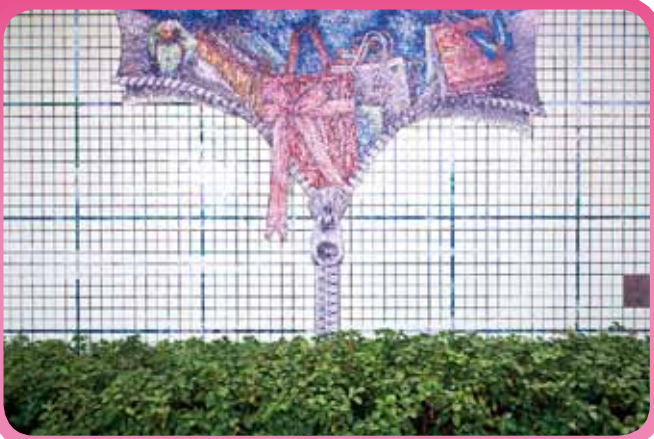
▲ 色彩繽紛的馬賽克麵包與購物袋象徵此區蓬勃的消費景象。