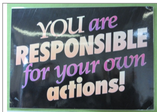
圖一：「反省室(Responsibly Thinking Room)」標語：對自己的行為負責！

昆士蘭省的學生在 12 年級畢業前要接受大會考（ Overall Position, OP ），依會考成績與在校成績申請大學或其他高等學府就讀，所以，11 年級學生逐漸要面對升學選擇。我們參訪當天，正巧該校集合所有 11 年級學生開週會，校長