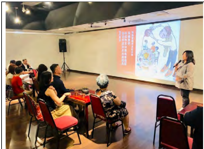
本局率同文基會松山文創園區參觀紫藤文化企業集團

本次會面，該集團表示希望建立與臺北市文化及創意合作交流機會，該集團訂於9月18日率「眾籌圓夢工廠」之馬來西亞新創品牌來臺灣參訪，期望與松山文創園區的松菸創作者工廠建立交流合作機制。