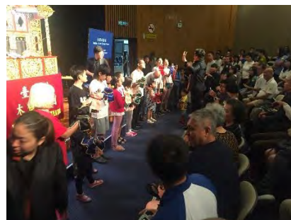
演出後劇團與現場觀眾交流互動熱絡