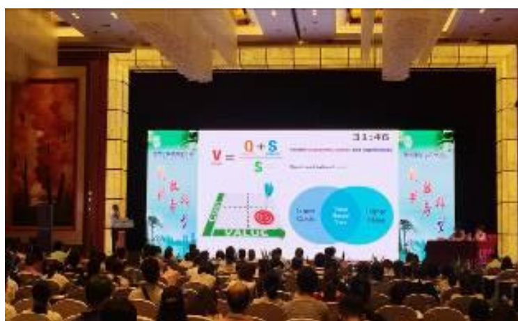
圖三、專題演講報告