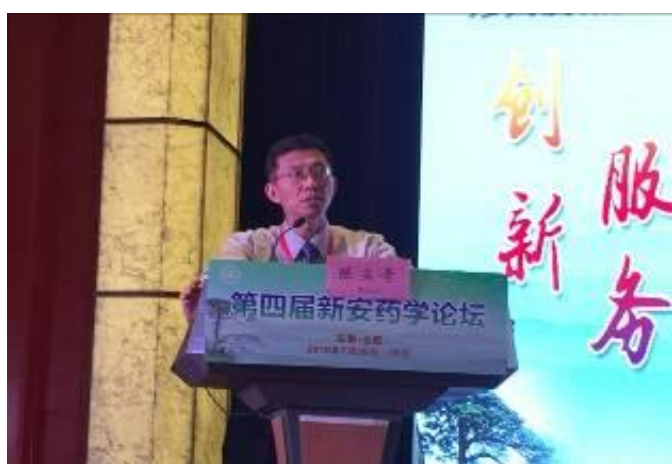
圖二、專題演講報告-