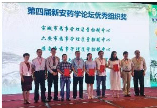
圖一、擔任頒獎貴賓與優秀論文得獎者合影