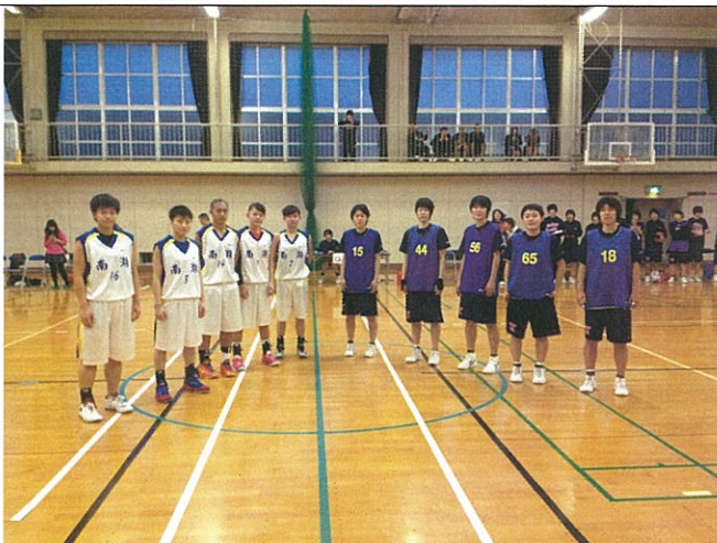
與金澤高校先發球員賽前合影