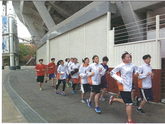
早晨於體育館外體能訓練