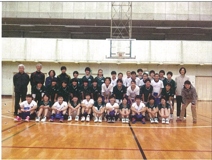
賽前雙方校方人員暨教練和球員合影