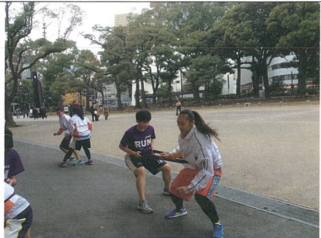
早晨於體育館外肌力訓練