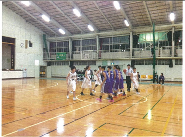
神奈川縣亞軍隊~旭日高校