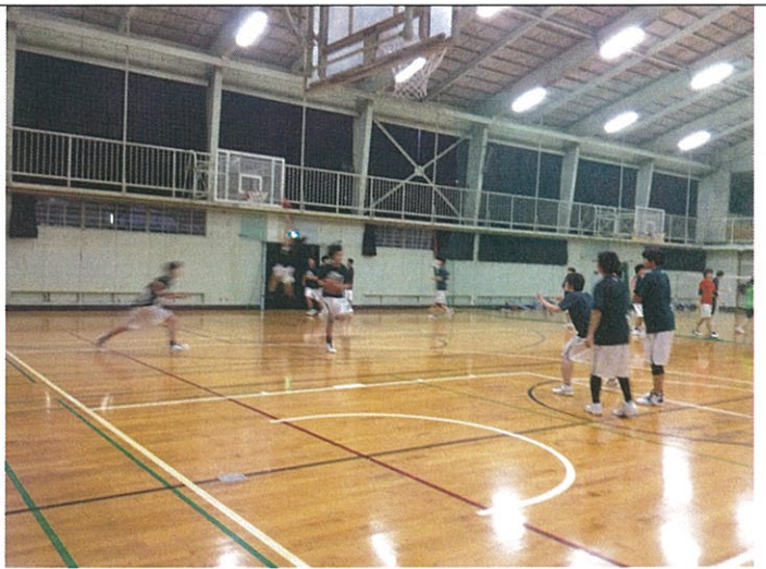
神奈川縣亞軍隊~旭日高校訓練實況