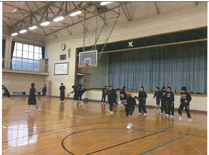
神奈川縣冠軍隊~金澤高校熱身與訓練實況