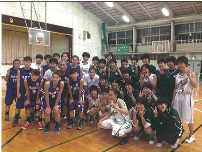
賽後雙方球員合影