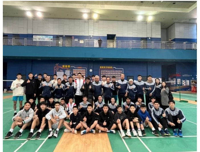
在羽球場與北市大羽球隊及乒羽網中心師生大合照