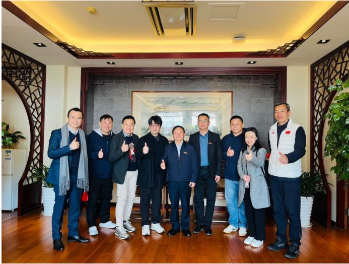
北市大拜訪師長與福建農林大學校長合影