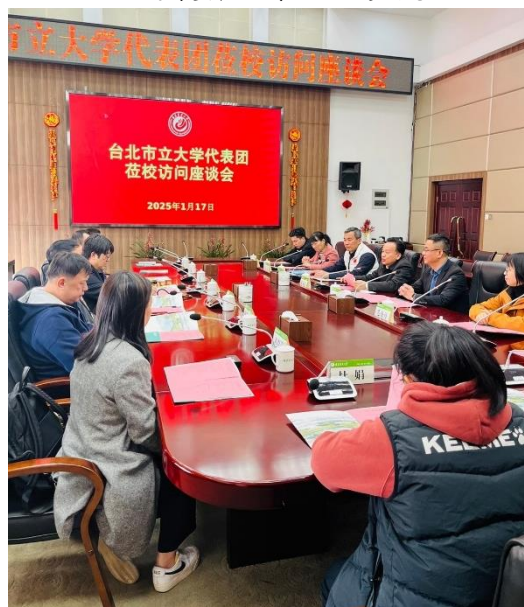
與福建農林大學進行合作討論