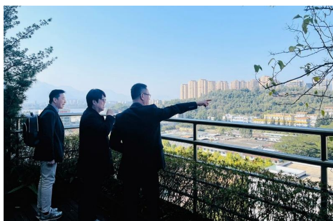
福建農林大學校園參觀