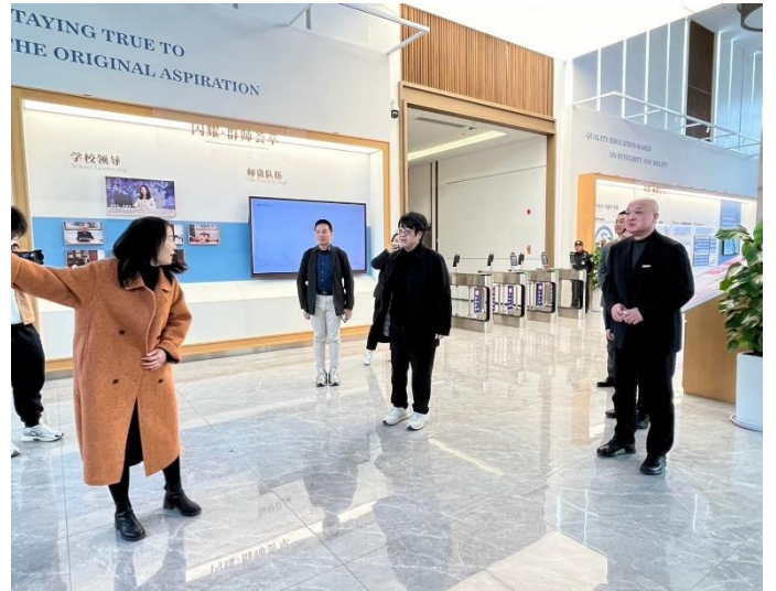
福州外語外貿學院介紹該校校史