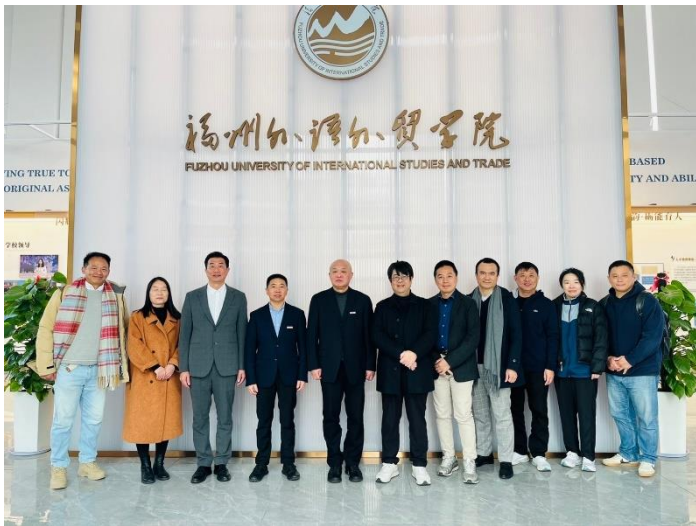
北市大拜訪師長與福州外語外貿學院大合照