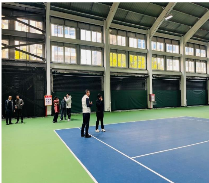
福建農林大學體育場館參觀