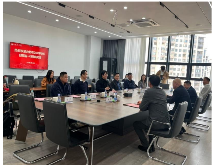
與福州外語外貿學院進行合作討論