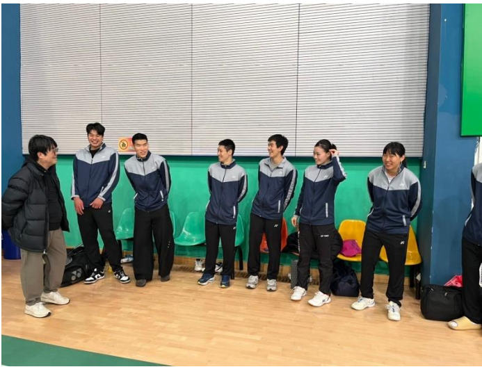
關心北市大羽球隊至福建省乒羽網運動管理中心 移地訓練的情況