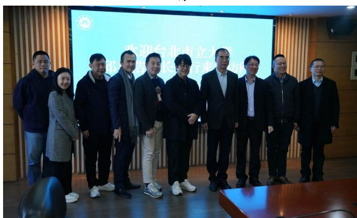
北市大拜訪師長與福建師範大學大合照