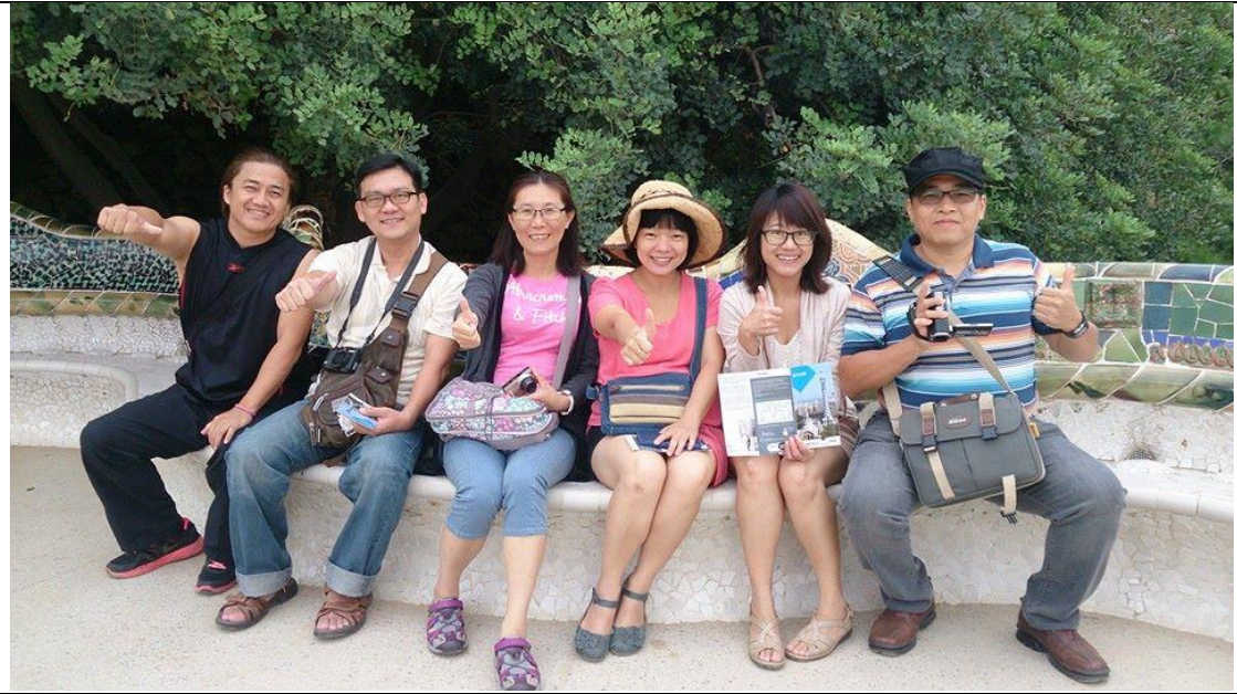
相片說明：參訪 Gaudi 知名作品-奎爾公園，了解西班牙建築之美。