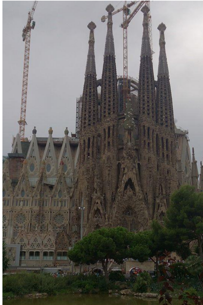
相片說明：參訪 Gaudi 知名作品-聖家堂，深入探索世界文化遺產。