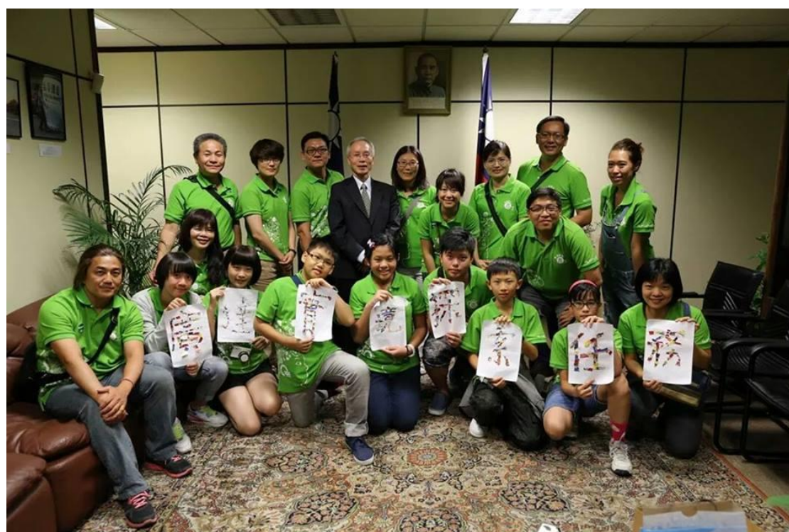
相片說明：參訪駐西班牙辦事處，與駐外人員交流訪談。