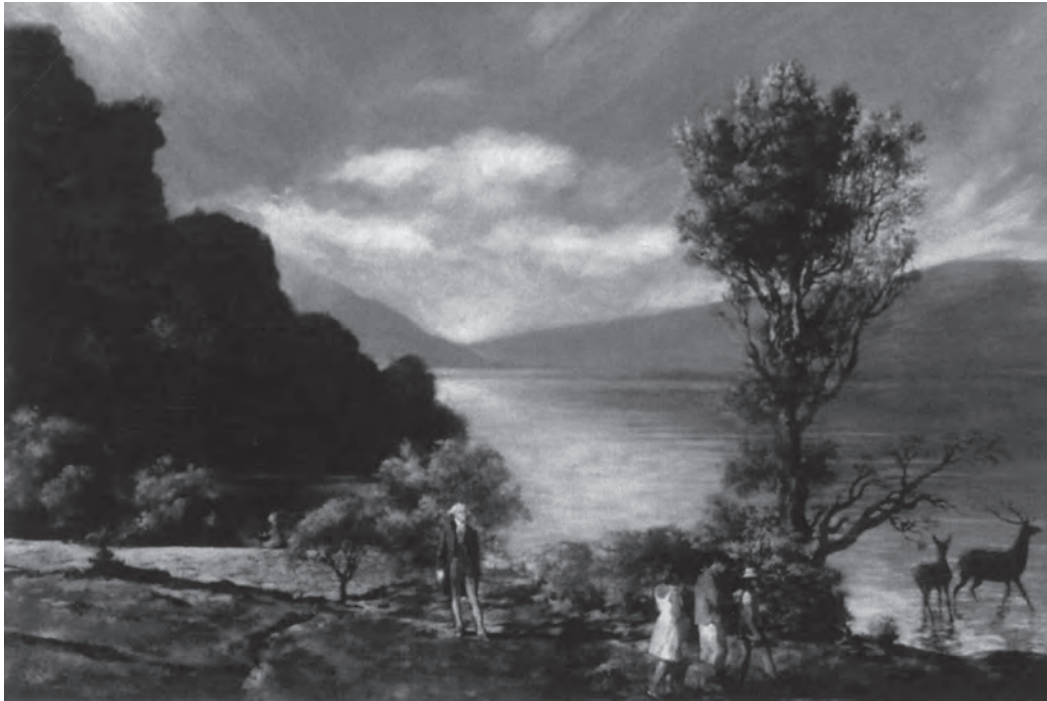
圖10 維塔利·寇瑪與亞歷山大·梅拉米德 (Vitaly Komar and Alexander Melamid)，〈美國最想要的(畫)〉(America's Most Wanted)，數位影像，線上統計調查，1994-1995，Project for The Most Wanted Paintings on the Web , Alternative Museum, New York

Melamid, 1945-) 的一幅風景畫〈美國最想要的(畫)〉( America's Most Wanted , 1994)【圖10】。其中，他們以一種先進的社會科學研究方法：目標族群(focus group)和精準的加權民意統計，針對美國家庭抽樣調查，進而發掘美國人最想要的風景畫是甚麼樣態(Danto, 2004: 291-298)。畫家依據這份數據作畫，結果是一張藍色調為主的湖光水色，其中穿插著美國總統喬治·華盛頓(George Washington)、穿著休閒服飾的美國家庭，以及野生動物等不同元素，並置在同一個畫面之中。然而，透過這一套精準的測量工具，普查民意所做出的〈美國最想要的(畫)〉，不僅荒謬的大肆上演時代穿越劇，而且諷刺的是怪異的畫面反而是大眾「最不想要的畫」！丹托藉此指出在後歷史的時代，一如黑格爾所預料，詼諧有趣、無畏大膽的喜劇模式恰好為藝術終結做了最好的定義。這齣喜劇並非一定要像寇瑪與梅拉米德般詼諧搞怪，就像李西特運用照片模糊的作畫，依然可以用「喜劇」的方式表達某種悲劇(或其他)。因為當代藝術的重點就是奠基於雙重的迴圈，對照出藝術的自身面相；其關鍵就是思考的方向，而不是內容主題的呈現(Danto, 2004: 299-300)。