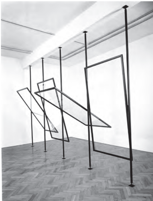
圖3 傑賓·李西特 (Gerhard Richter)，〈四面窗玻璃片〉(4 Panes of Glasses)，玻璃與鐵，每片為190×100 cm，1967，Collection Anton Herbert, Herbert Foundation

從此一「理想真實」出發，可以想見不論是具象的「照相—繪畫」，還是抽象作品，甚至是裝置作品，其實都可以望見李西特質疑藝術體制，積極探尋藝術本質的問題。譬如〈四面窗玻璃片〉(4 Panes of Glasses, 1967)【圖3】，李西特以支架頂住四塊裝框的玻璃片，使其懸空，玻璃框因之可以上下翻卷。觀者在這個裝置中，可以隨意走動，關注在玻璃片後方的景物；然而其也隨著方位的移動，看到不同的變化。表面上，〈四面窗玻璃片〉是一個簡易互動的裝置作品，但事實上李西特透過它思考藝術再現的問題，如透視法的幻覺技術與真實物象間的差異性，或所謂「寫實」思維的批判性