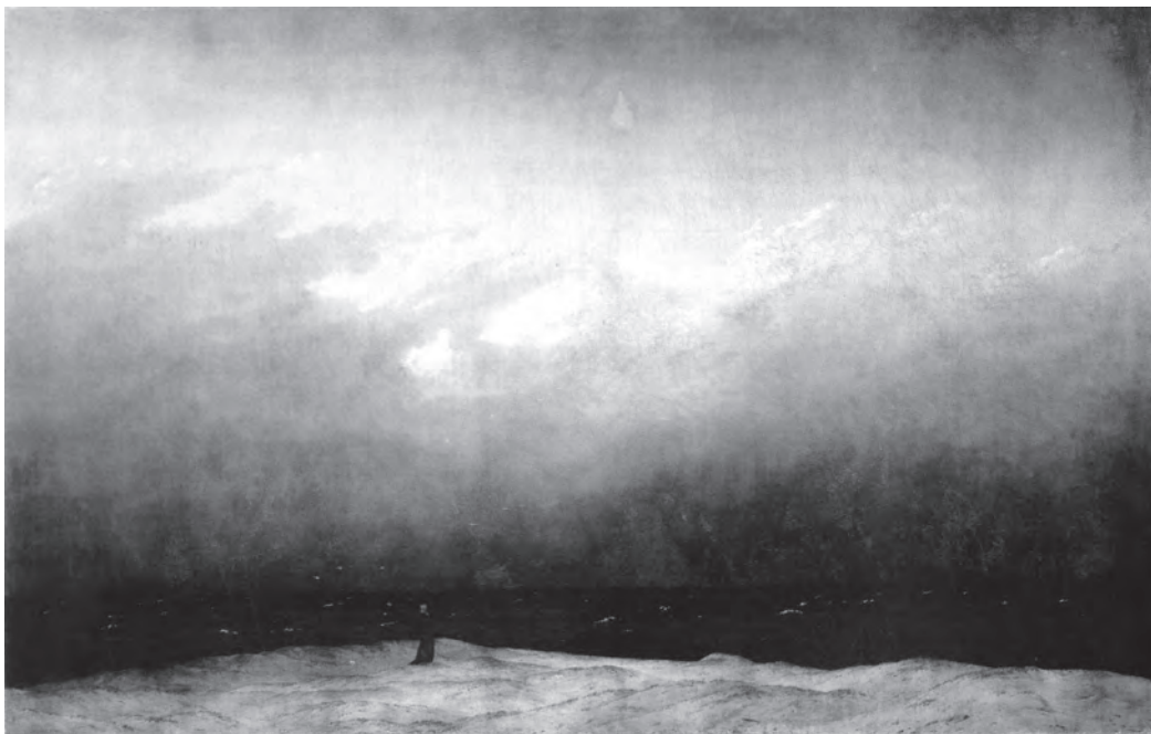
圖6 卡斯帕·大衛·弗里德里希 (Caspar David Friedrich) ,〈海邊的僧侶〉( The Monk by the Sea ) ,油彩、畫布,110×171.5 cm,1808-1809,Alte Nationalgalerie, Berlin