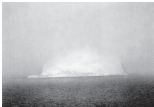
圖8 傑賀·李西特 (Gerhard Richter) ,〈霧中冰山〉( Iceberg in Mist ) ,油彩、畫布,70×100 cm,1982,Private Collection, San Francisco

Monk by the Sea ,1808-09)【圖6】。風雨欲來前的寧靜，深沈陰鬱的籠罩整個天空，一個不知名的僧侶站在一片袤廣無垠的海洋面前，使人心中油然而升起一股「寄蜉蝣於天地，渺滄海之一粟」之情。反觀李西特的作品，畫面中少了一位代理人（僧侶），觀者的視線直接進入無人場域，即便是由攝影機具所轉化的「照相—繪畫」，這個寫實如