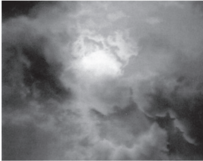
圖9 傑賀·李西特 (Gerhard Richter) ·〈雲的研究 (逆光)〉 ( Cloud Study (Contre-jour) ) ·油彩·畫布·80×100 cm·1970·Private Collection, on long-term loan to the Galerie Neue Meister, Staatliche Kunstsammlungen, Dresden

信片式的風景畫，但他作品中的時間感卻是「斷續的」(intermittence)。觀者無法輕易的轉化幻覺心理，這或許可歸咎於李西特對攝影機及照片的援用，藉由快門抓拍與攝影的調停，「照相－繪畫」的時間感是內爆的、碎裂的、片段的，因此這種互為的流變——「是照片？還是繪畫？」該疑問則造成觀者內心的衝擊與干擾，而無法真正進入到「幻象域」，反之彷彿掉入了「擬像域」(simulative universe)。史多爾便認為，「照相－繪畫」在攝影與繪畫之間，產生了一種劇烈的張力關係：「一個觀者可能得以寄託的美麗想像空間」以及「一幅得以寄託的美麗圖畫，卻使觀者敏銳的察覺到其不可能性」，而觀者這種視覺與心理的衝突裂斷，史多爾稱為「連續不斷的混沌空間」(perpetual limbo) 狀態 (2002: 67)。將此概念進一步延展，李西特作於1970年前後的〈雲的研究 (逆光)〉 ( Cloud Study (Contre-Jour) ) 【圖9】，或許可以提供一個具體而微的例證。