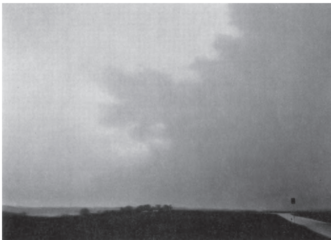
圖4 傑賀·李西特(Gerhard Richter)，〈胡貝拉特附近的風景〉(Landscape near Hubbelrath)，油彩、畫布，100×140 cm，1969，Ludwig Forum für Internationale Kunst, Aachen

基於此一典型風景畫所處理的外部表現，及「可繪畫性的」再現題材前提下，再回頭檢視李西特的風景畫，則不禁令人感到困惑。李西特的風景畫具有「如詩如畫般」的質素嗎？或者照李西特本人的說法，它們是「美麗的」風景嗎？從1968年起，李西特運用自己所拍攝的照片，製作一系列的風景畫；其中最早的一張便是〈科西嘉島(晴)〉【圖2】，其除了以光滑、飽滿的「照相—繪畫」手法，處理他首次的異地旅遊經驗外，李西特也嘗試不同的方式表現海景、山景、城市、鄉村，乃至雲朵、彩虹、冰山等景觀。在這一創作爆發期的李西特，除了處理多樣性的藝術表現，並思索藝術本質的同時，單純的想畫一張「美麗的」風景畫，似乎是一個「去國懷鄉的」(nostalgias)合法性藉口，但這樣的託辭卻也無法合情合理的解釋其筆下的圖像——以照片般的寫實手法呈現平滑、淺薄的表面、過於精準的顏色、猶如快照抓拍的構圖，在在的呈現出「非典型」的風景場域。換言之，與其說李西特的風景畫帶有一絲如詩似畫的「美麗風格」；不如說是失溫的、漠然的、「非人稱」的平凡場景，就如1969年的作品〈胡貝拉特附近的風景〉(Landscape near Hubbelrath)所呈現的一般【圖4】。