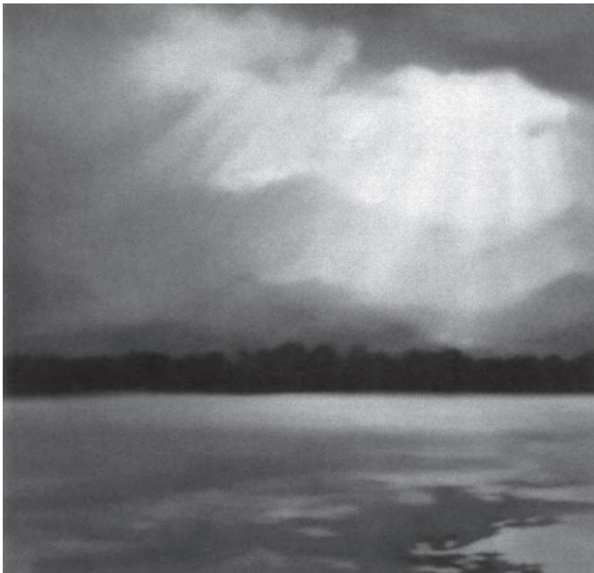
圖2 傑賀·李西特 (Gerhard Richer) ,〈科西嘉島(晴)〉(Corsica (Sun)) , 油彩、畫布, 254×478 cm , 1968 , Private Collection