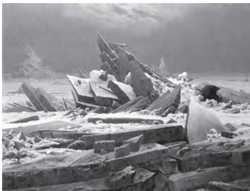
圖7 卡斯帕·大衛·弗里德里希 (Caspar David Friedrich) ,〈冰海〉( The Sea of Ice ) ,油彩、畫布,126.9×96.7 cm,1823-1824, Kunsthalle Hamburger, Hamburger