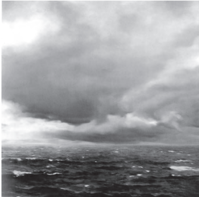
圖5 傑賀·李西特 (Gerhard Richter)，〈海景(烏雲密布)〉(Seascape (Cloudy))， 油彩、畫布，200×200 cm，1969，Private Collection, Berlin

某件卡斯帕·大衛·弗里德里希的畫作並不是一件過往的事物。成就過往的東西只是使作畫的種種條件因素獲得核可：例如特定的意識形態。在那之外，如果有什麼「良善的」東西，那將使我們涉及——超越意識形態——藝術，亦即我們認為值得奮戰到底（感知、展示、製作）的東西。因此即便到了「今日」我們仍極有可能畫得像卡斯帕·大衛·弗里德里希一般 (Elger et al., 2009: 72)。 21