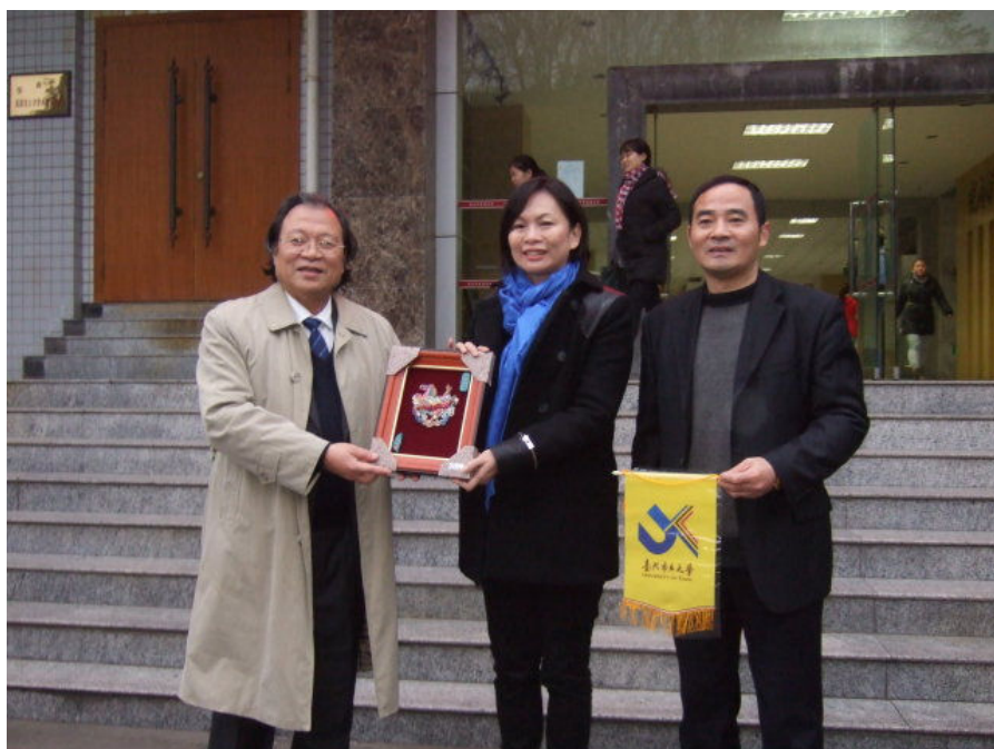
照片三：與宜賓學院院長合影