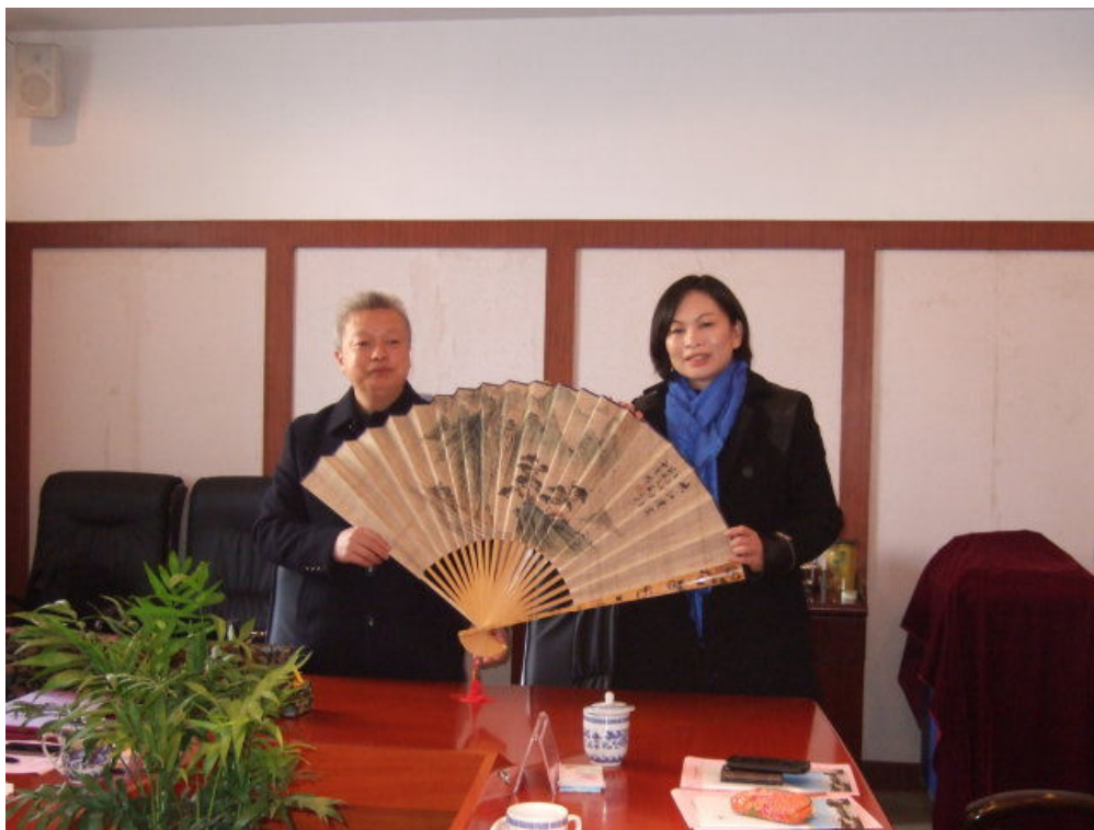
照片二：座談會後兩校互贈紀念品