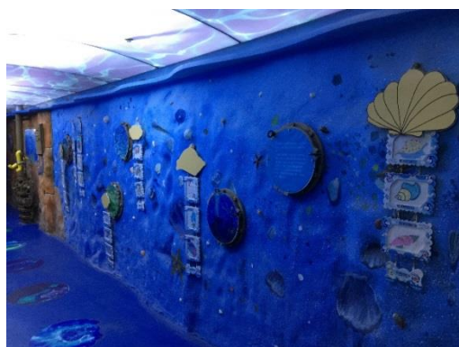
海洋探秘館學生作品展示牆。