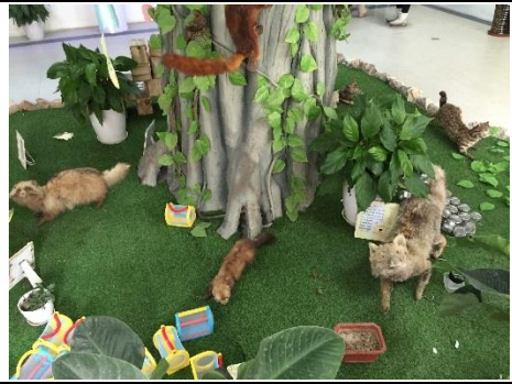
生命探究空間各種動植物標本。