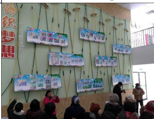
編織夢想—學生作品牆。