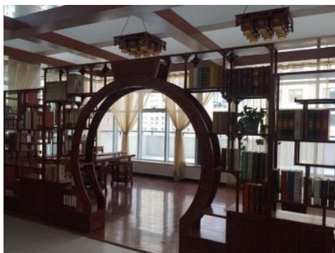
棗山書苑藏書豐富