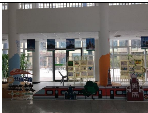
一樓大廳「一帶一路」情境佈置。