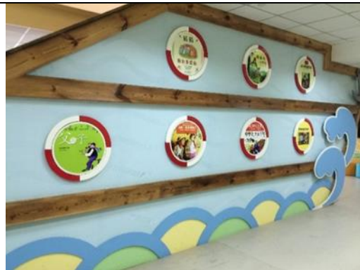
棗山書苑繪本牆展示。