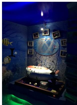
蛟龍號機械手採集海底標本模型