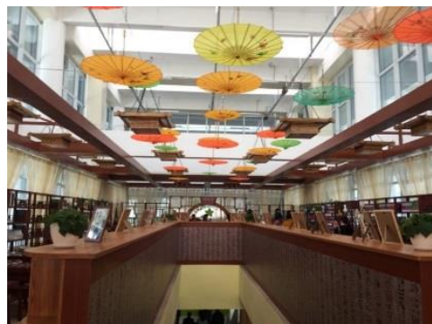
三樓古色古香的棗山書苑。