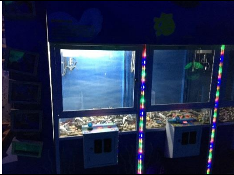
海洋生物抓娃娃機。