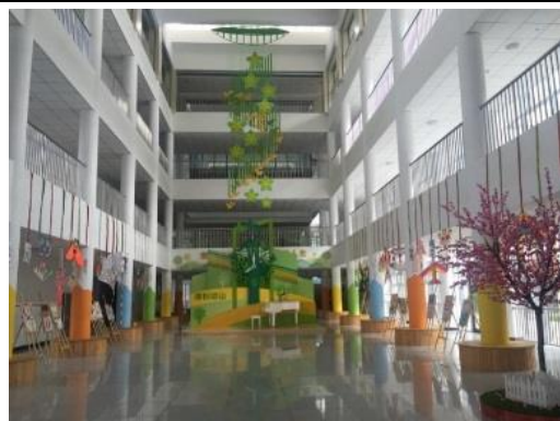
一樓大廳敞亮的空間規畫。