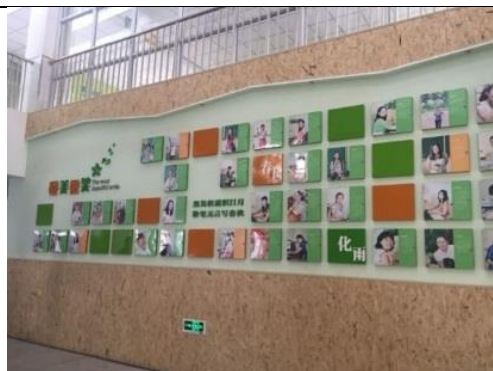
充滿教師風采的春風化雨牆。