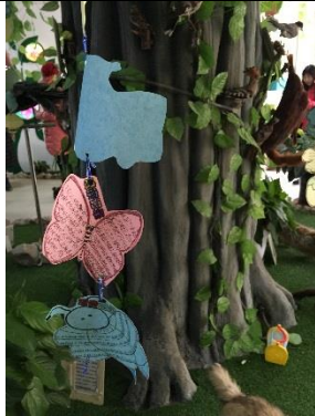
生命探究空間學生觀察紀錄。