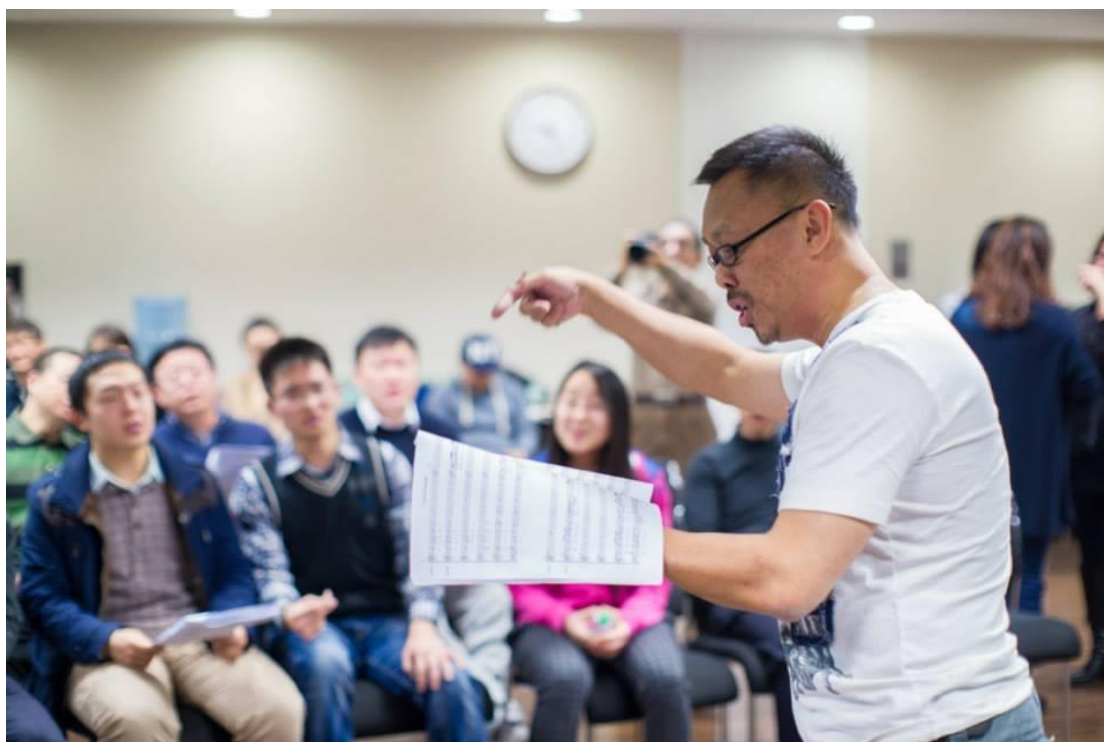
我自己也有實際帶領學員一起分部演唱英語歌曲。