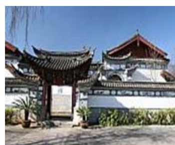
照片五 雲南民族村內之村寨，左：彝族村、中：白族村，右：納西村