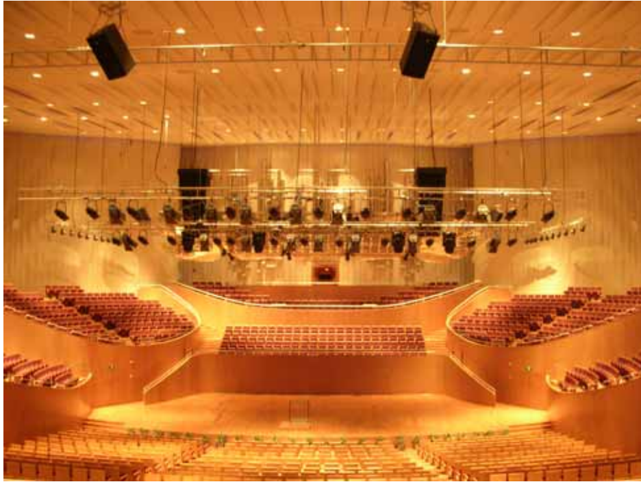
照片十：上海東方藝術中心內 1020 席位東方歌劇廳