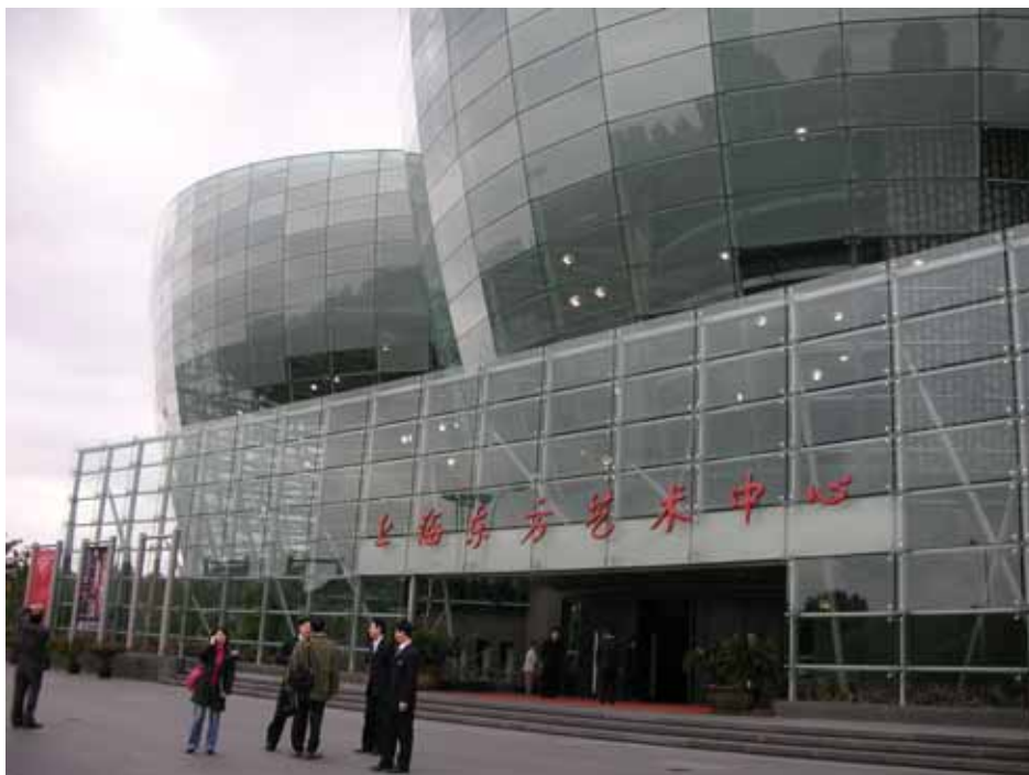
照片九：猶如五片蝴蝶蘭花瓣的上海東方藝術中心

新開發的浦東新區，相較於上海其他行政區域，顯得過於「沈寂」許多。東方藝術中心落成之後，不但建立浦東新區的文化空間，也為上海城市文化新格局增添濃墨重彩的一筆；而上海市政府也藉由上海東方藝術中心的建造完成，使上海市區空間發展軸線有著不一樣的風貌，可說是以文化建設帶動空間（浦東新區）改造、經濟發展最佳案例。