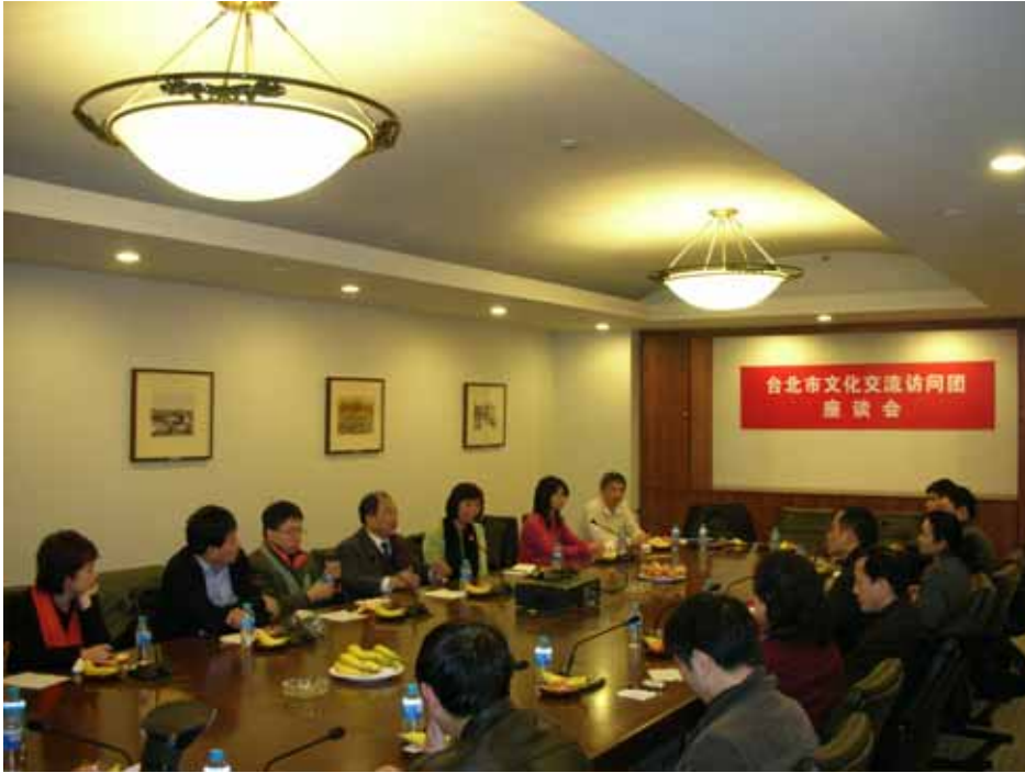
照片十四：參訪團與上海美術館代表進行交流座談