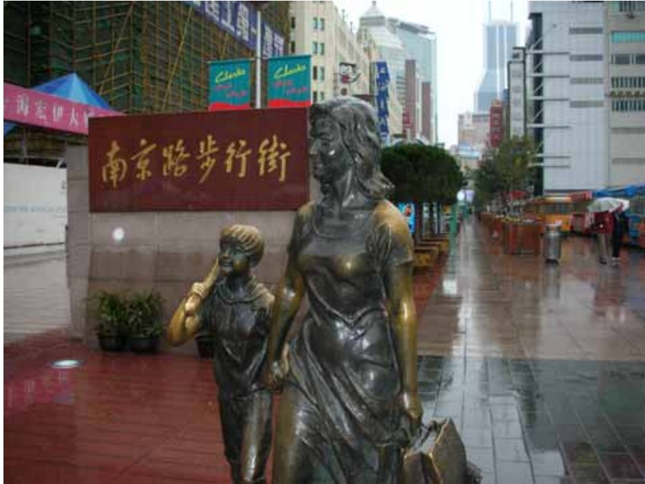
照片十三：中國上海國際藝術節「南京路天天演」活動場地