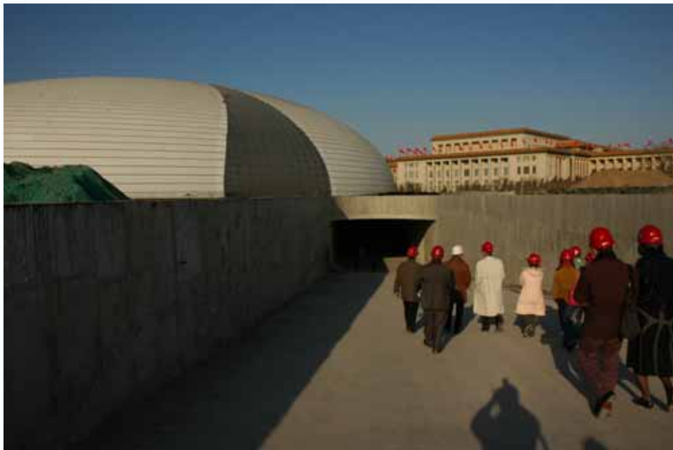
照片十九：參訪團至國家大劇院施工現場勘察。