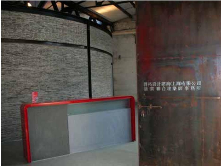
照片八：上海濱江創意園區內進駐之建築師事務所