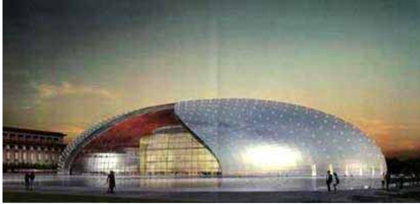
圖片：國家大劇院完工示意圖

問題尚未解決三、背負著國家最高水準演藝殿堂，將使得營運成本過高，無形中進而影響一般市民進入門檻，接近藝文活動的機會。而這些問題也值得作為日後經營台北藝術中心借鏡。