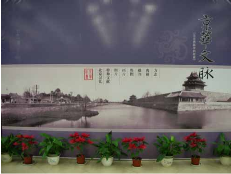
照片二十一：首都博物館「京華文脈」特展