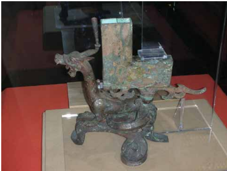
照片二：展出西漢南越王墓出土文物

博物館內分為 3 個展覽區，分別是綜合展示大樓、南越王墓原址保護區、主題展示樓，西漢南越王墓的發掘及博物館的興建，相關物件提供歷史研究者了解南越國以及秦漢時代嶺南地區的經濟、文化、政治、社會情形第一手的資料。而除了挖掘出土的文物外，該館典藏最大特色為部分文物是由收藏家私人捐贈，以豐富博物館展陳。