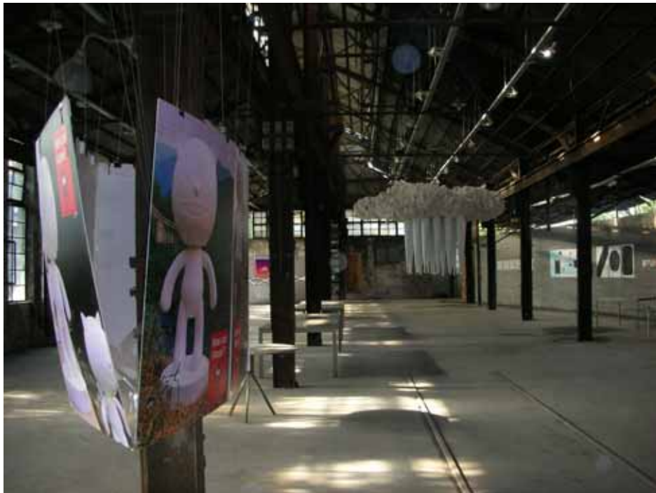
照片七：閒置廠房規劃為當代藝文展覽場所