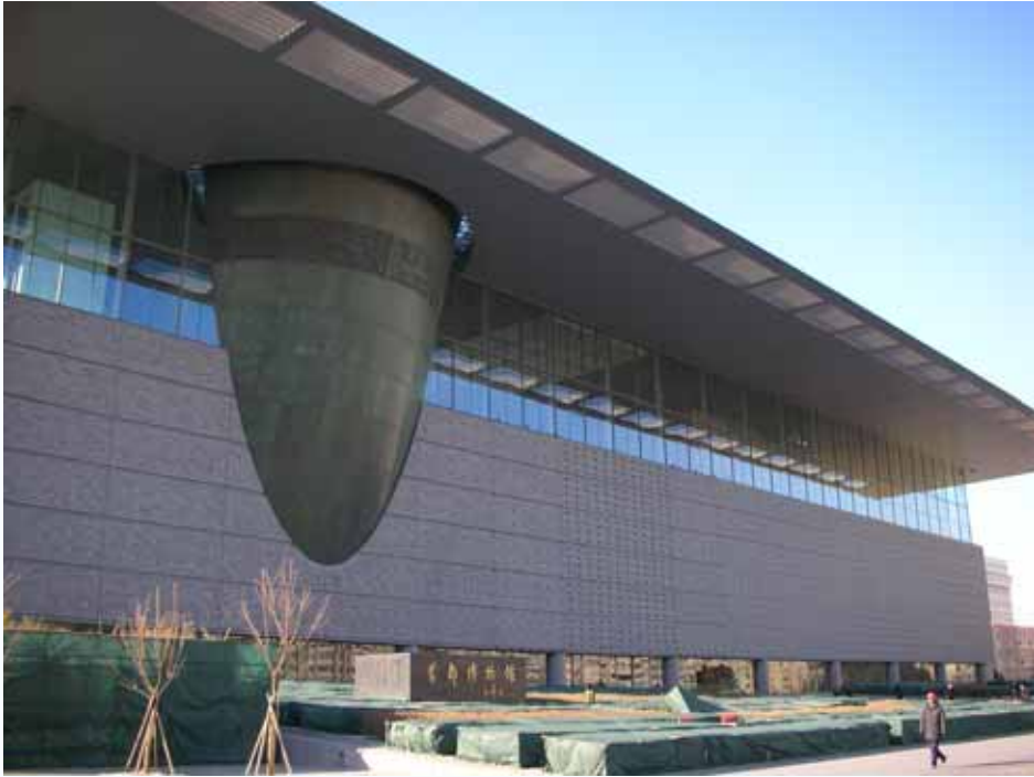
照片十五：象徵文物發掘、破牆而出之首都博物館建築外貌