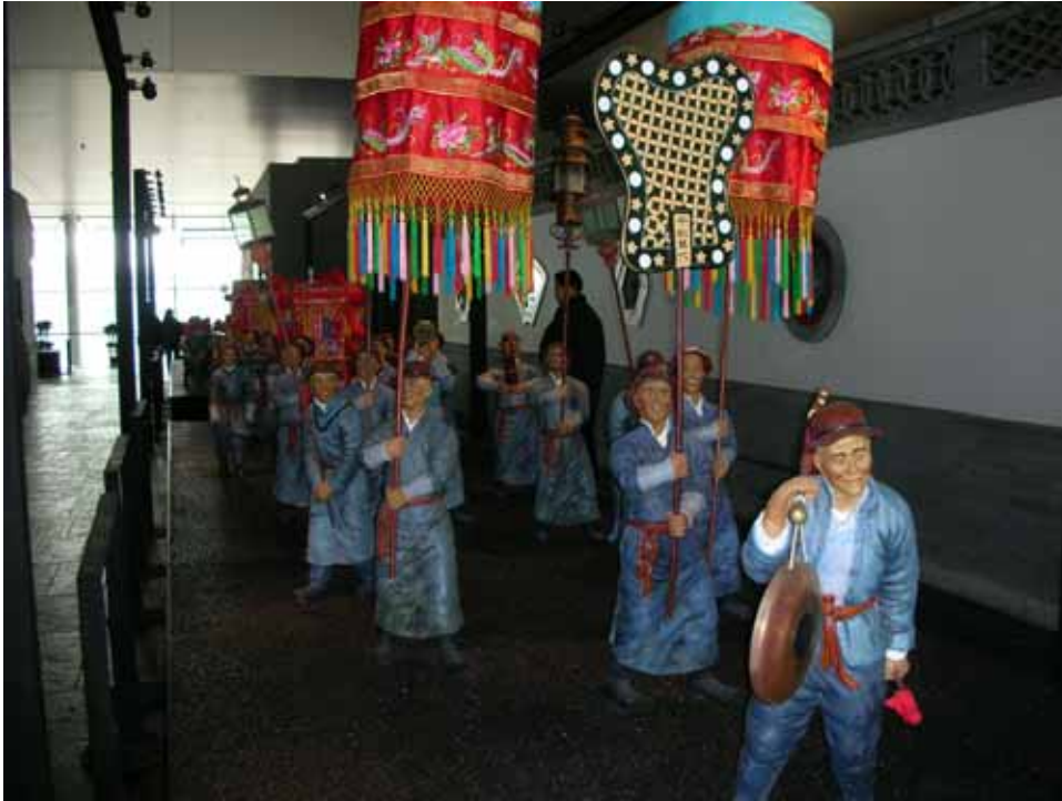
照片十七：首都博物館「京城舊事—老北京民俗展」模型