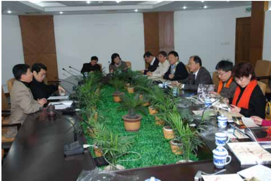
照片十二：中國上海國際藝術節中心董事長簡介藝術節經營模式

另為了避免藝術節流於菁英文化，擴大一般民眾參與感，該中心於藝術節期間除了在南京路置地廣場舉辦「南京路天天演」活動，讓市民免費欣賞演出外，更透過政府撥款補貼、降低演出成本、社會企業資助等方式，發行 10-100 人民幣優惠票價，以吸引更多市民走進劇院，近距離欣賞國內、外一流團體的精彩演出，增強藝文盛會可及性及普及性，進而提昇上海市文化素養及美學氛圍。