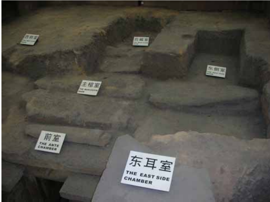
照片三：西漢南越王陵墓原址保護區