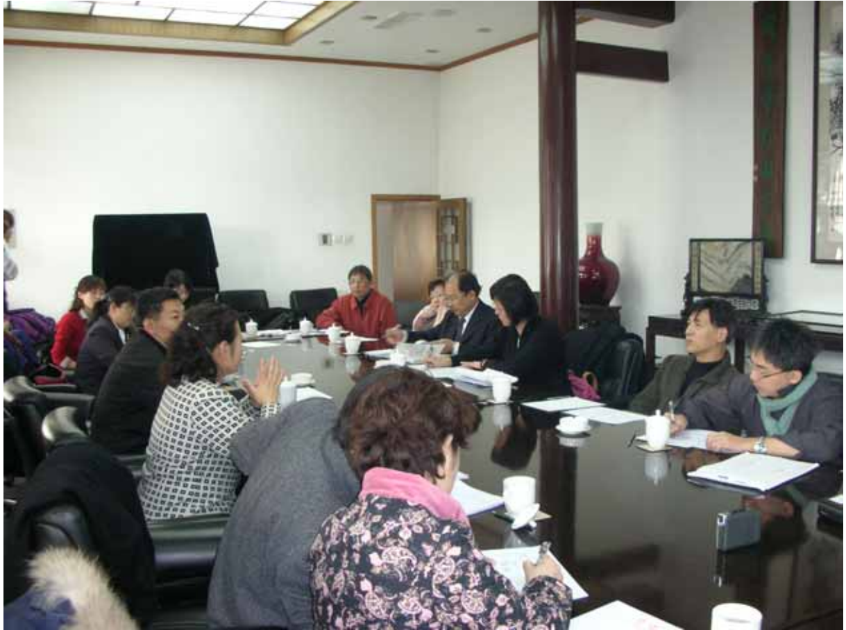
照片二十二：海峽兩岸代表於合園商討全面性藝文交流事宜。