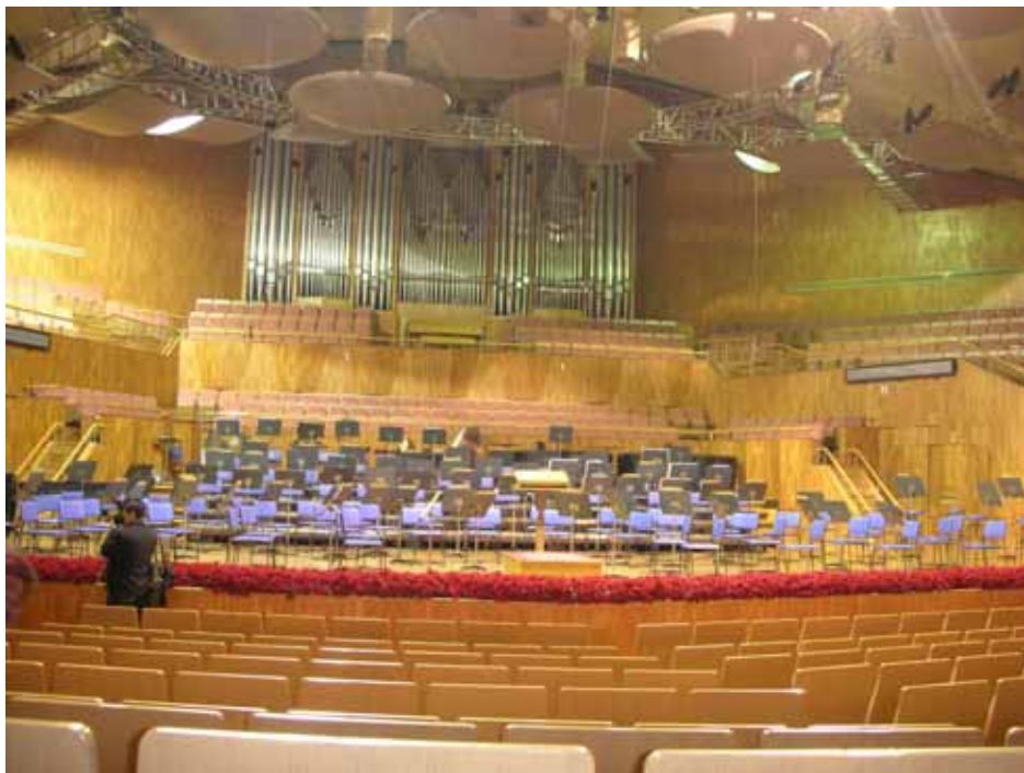
照片四：星海音樂廳內五邊形交響樂演奏廳

已舉辦2屆的「廣州3年展」，與臺北市立美術館雙年展在性質上有著異曲同工之妙，並從中學習臺北市立美術館策展精髓，藉由「廣州3年展」的舉行，多元化的呈現國際上當代文化藝術的發展動向，而在中國文化藝術界及國際上產生了重大的影響。另外廣東美術館於2003年舉辦了《中國人本——紀實在當代》大型攝影展，這是大陸地區第一個大規模有系統的攝影展，展覽的600多張攝影作品，並集結成書，在大陸地區引起不少迴響與話題。攝影作品現都由該館所收藏，可說是大陸地區攝影展示、收藏最具代表性的美術館。