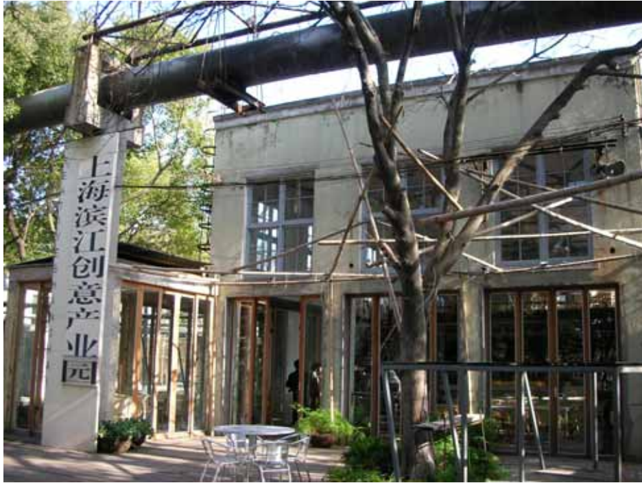
照片六：閒置空間重新打造為融合滄桑、摩登元素的咖啡館