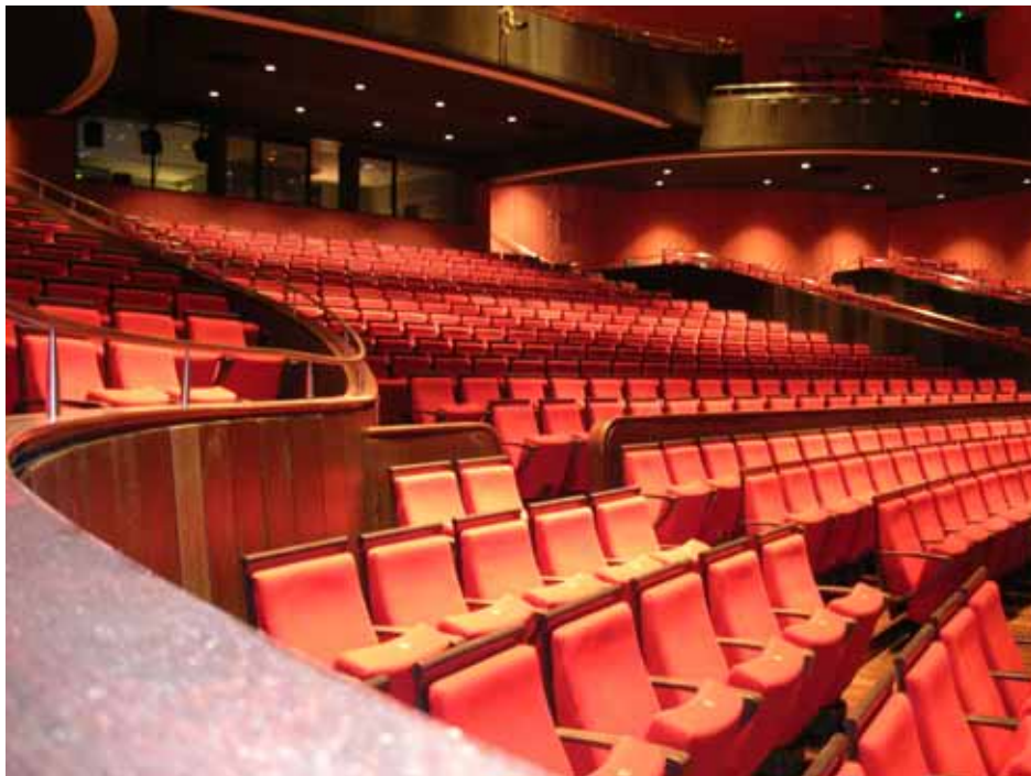
照片十一：世界級水準的東方音樂廳