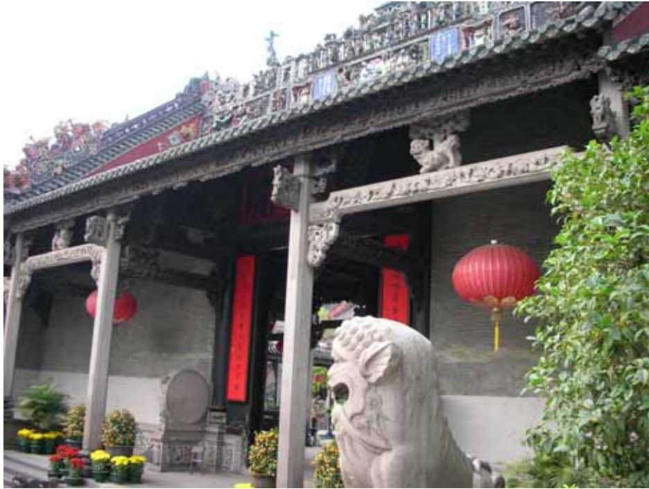
照片一：陳家祠正殿入口

成，及文獻會負責培訓史蹟解說員，在本市規劃 16 條解說動線，不定期的接受各界預約解說史蹟，為傳佈其存在的歷史意義及藝術價值，奉獻心力。因此，就整體推廣面而言，應有過之而無不及。