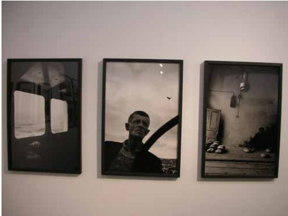
照片五：廣東美術館攝影展

上海做為大陸改革開放的窗口，充滿了活力與機遇。上海快速的發展不但表現在經濟領域，也體現在日益繁榮的文化領域。自從改革開放以來，上海可說是大陸現代文化產業的發源地，開放多元的上海，深刻體認文化是衡量一城市國際競爭力的重要指標，欲成為具有獨特魅力的國際化大都市，必須藉由區位優勢，營造良好投資環境，吸引海內外各方人才、資本投入文化產業，透過獨資、合資、合作等多種方式，形成以公有制為主體、公私共有、共同發展的經濟制度，進而增進上海文化產業整體實力及競爭力。而 2010 年上海世界博覽會的舉辦，更將成為上海文化產業發展的重要契機。