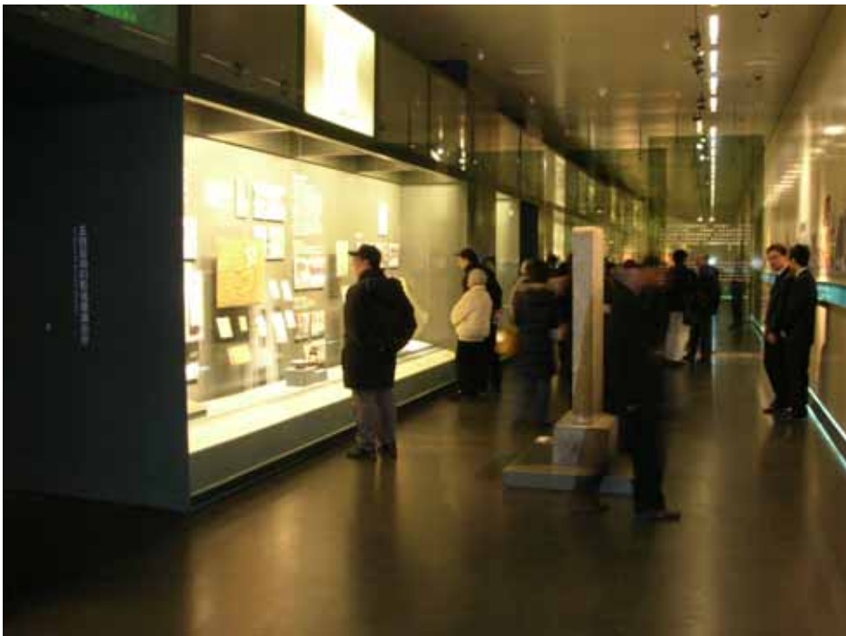
照片十六：首都博物館北京通史定期展