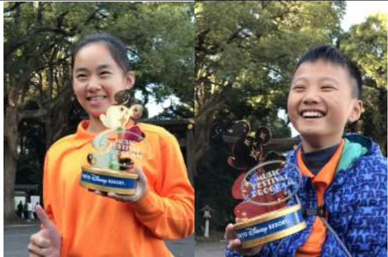
與迪士尼致贈紀念獎座合影 ←高尾山神社學習日本祭祀禮儀