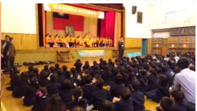
校內舉行小型演奏會，全校學生欣賞演出