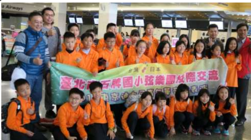
松山機場出發，感謝議員前來加油打氣