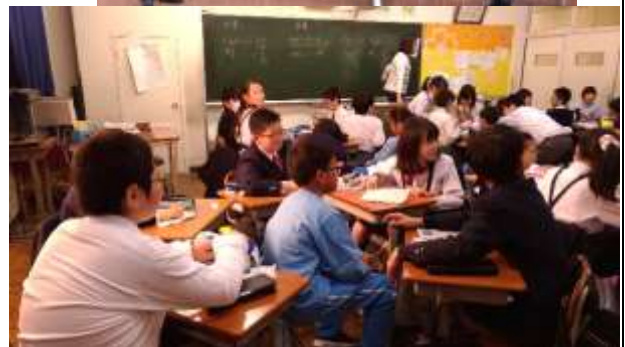
在中華學校一起學習、上課