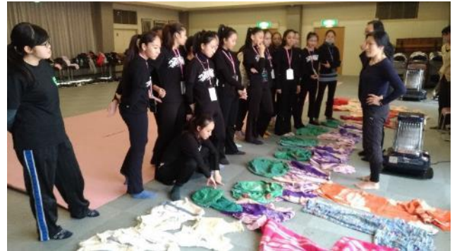
說明：舞踏工作坊成果展定妝(裝)