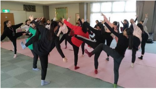
說明：舞踏工作坊-今貂子先生-1