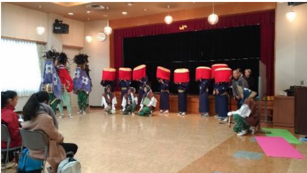
說明：觀賞日本傳統舞蹈-獅子舞