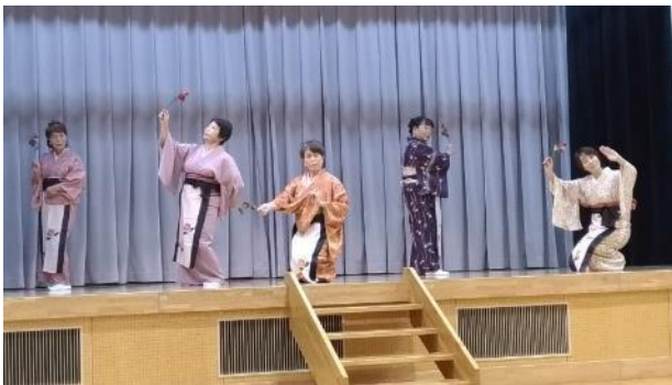
說明：二代目西崎綠舞蹈研究所觀賞日本傳統舞蹈