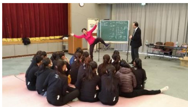
說明：舞蹈工作坊內容講述-今貂子先生-1