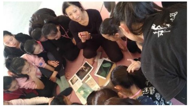
說明：舞踏工作坊-今貂子先生-2