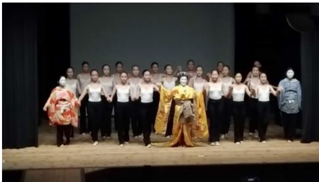
說明：正式演出謝幕