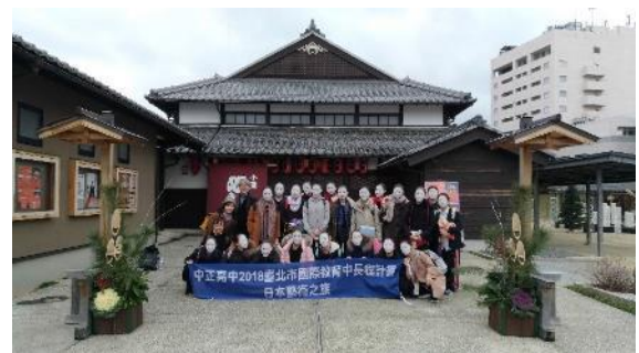
說明：演出前於小浜市車站・旭座劇場師生合影