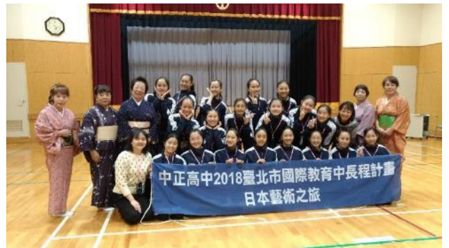
說明：二代目西崎綠舞蹈研究所師生合影