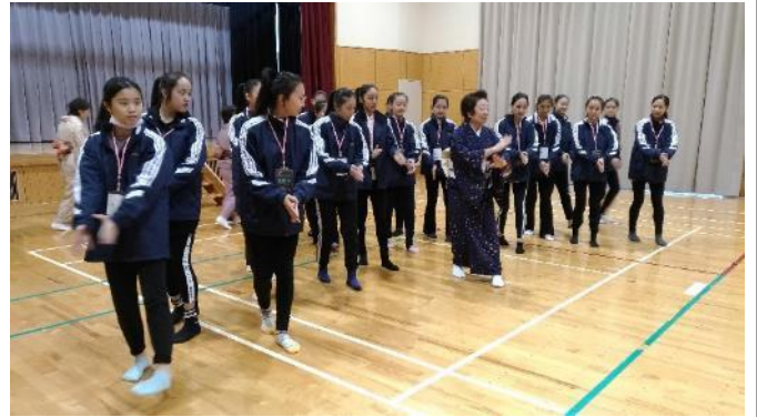
說明：二代目西崎綠舞蹈研究所學習日本傳統舞蹈