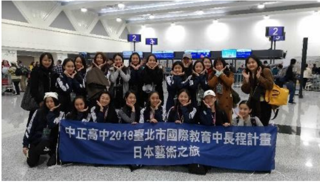
說明：啟程出發—桃園國際機場