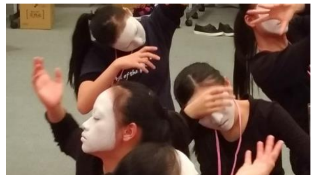
說明：舞踏工作坊成果展排練-2