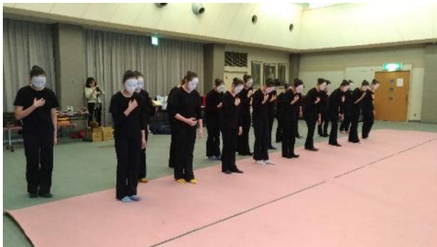
說明：舞踏工作坊成果展排練-1