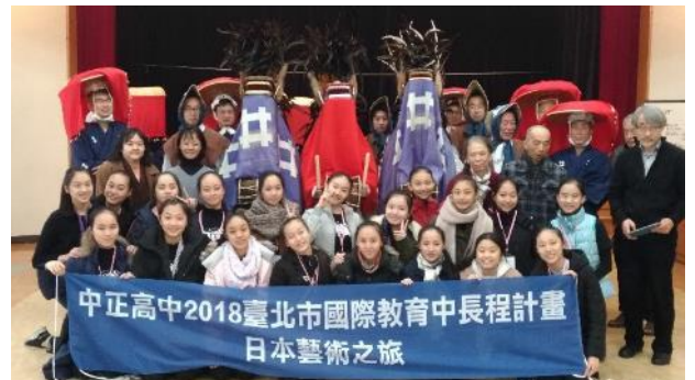
說明：獅子舞表演人員與師生合影