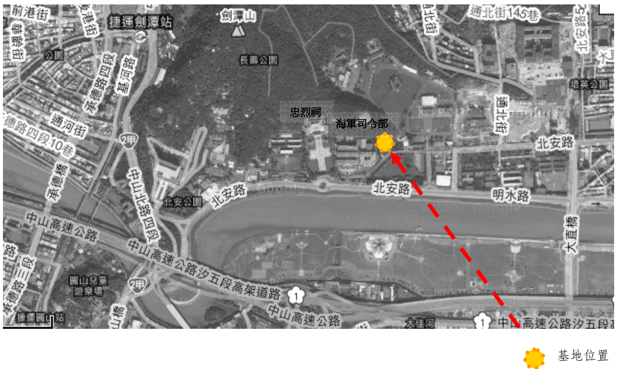
圖 1-1 基地位置圖

依臺北市政府文化局提供之土地撥用範圍，計有臺北市中山區北安段 4 小段 205-6 等 20 筆地號，土地面積共有 7,854.65 平方公尺。