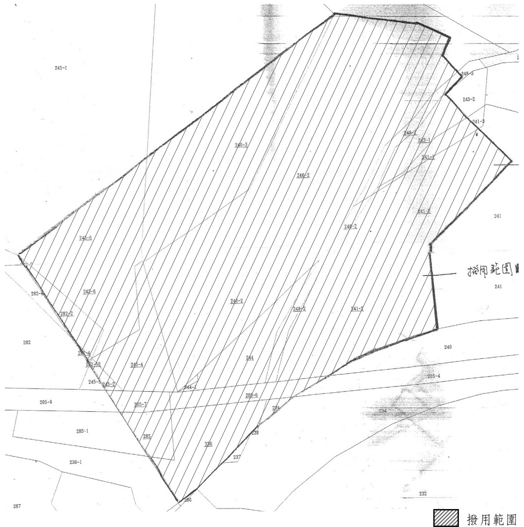
圖 1-2 撥用範圍地籍圖

依臺北市中山地政事務所土地登記資料謄載，上述土地於民國 87 年 12 月 21 日由臺北市政府文化局接管，文化局，並於民國 96 年 12 月取得經主管機關核發無妨礙都市計畫證明書。(參表 1-1)