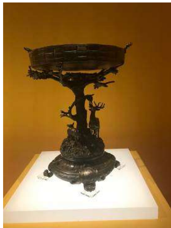
故宮鼓浪嶼外國文物館所館藏之陶瓷、漆器等文物藏品，極具異國情調、典雅精緻。