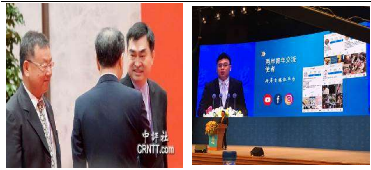
左：6月16日上午海峽論壇大會開幕典禮前，鄧副市長與澎湖縣長賴偉峰及全國政協主席汪洋(背對者)互動 右：青年交流講者發表演說