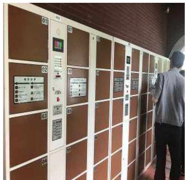
6月16日下午參訪故宮鼓浪嶼外國文物館，於入口處即需將所有物品全數鎖入特製置物櫃中。