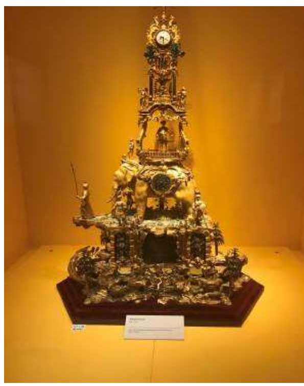
參觀故宮鼓浪嶼外國文物館，18 世紀英國銅鍍金象馱轉花鐘(右)，精雕細琢，是文物館的鎮館之寶。