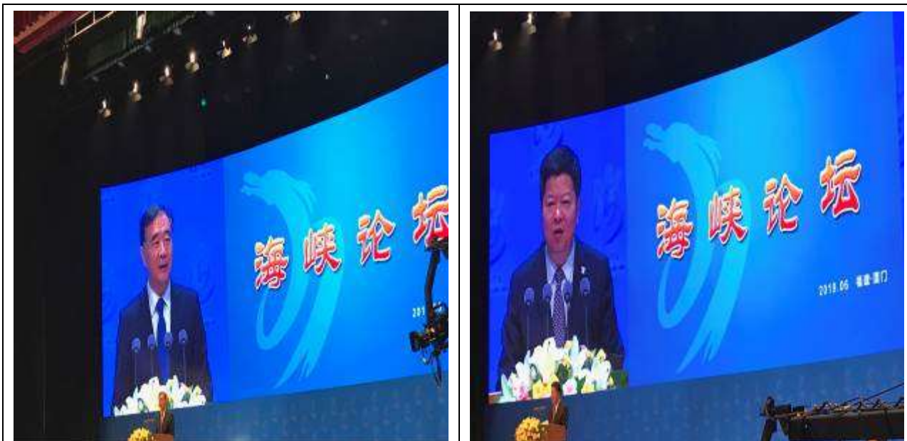
6月16日上午海峽論壇大會開幕典禮由國臺辦龍明彪副主任主持(右)，大陸中央政治局常委、全國政協主席汪洋出席致詞(左)